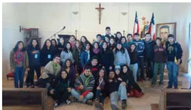
Jóvenes, representantes de las diferentes pastorales juveniles del Decanato Santos Apóstoles participaron de su tradicional campamento de invierno.

Coordinador Pastoral Juvenil, Guacarhue.