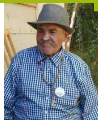
Parroquia de Coltauco