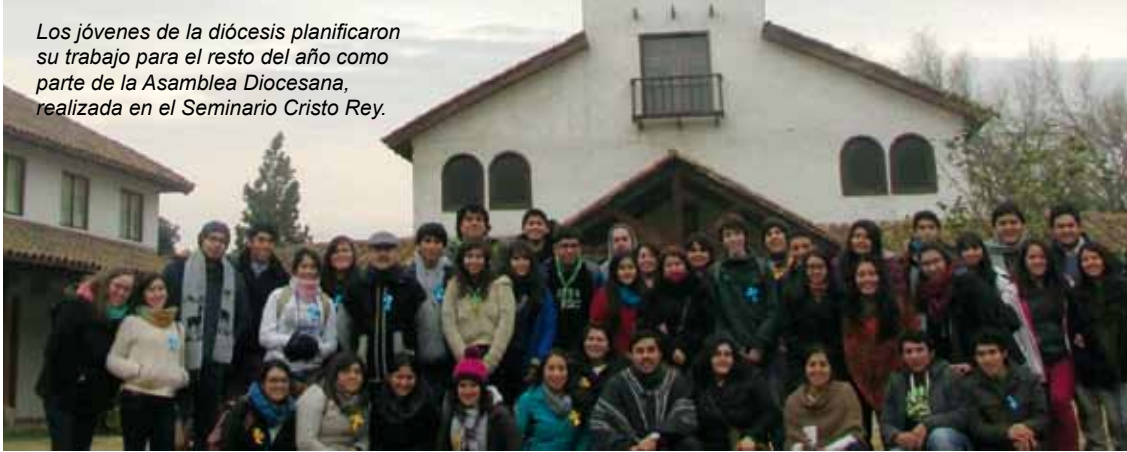
Los jóvenes de la diócesis planificaron su trabajo para el resto del año como parte de la Asamblea Diocesana, realizada en el Seminario Cristo Rey.

CON MÁS DE 60 JÓVENES DE DISTINTOS LUGARES DE LA SEXTA REGIÓN SE DESARROLLÓ LA ASAMBLEA ANUAL DE PASTORAL JUVENIL DIOCESANA EN EL SEMINARIO CRISTO REY DE GRANEROS.