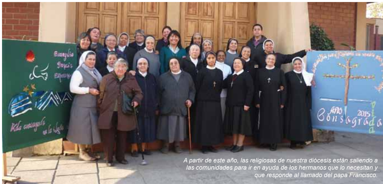
A partir de este año, las religiosas de nuestra diócesis están saliendo a las comunidades para ir en ayuda de los hermanos que lo necesitan y que responde al llamado del papa Francisco.

COMO PARTE DE SU PROGRAMA ANUAL, LA ORGANIZACIÓN QUE AGRUPA A LAS RELIGIOSAS DE LA DIÓCESIS, DECIDIÓ IR MÁS ALLÁ DE SUS CONVENTOS Y APOSTOLADOS, SALIENDO A LAS COMUNIDADES.