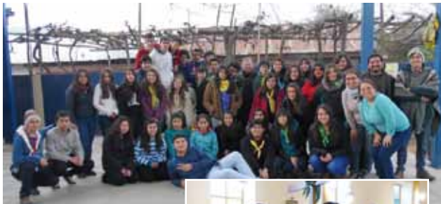
Jóvenes de confirmación de primer y segundo año participaron activamente en el campamento de invierno que por tercer año consecutivo, organiza la Pastoral Juvenil de la parroquia de San Vicente de Tagua Tagua.

Durante las diferentes jornadas, jóvenes, laicos, sacerdotes y diáconos impartieron talleres como: los cimientos de nuestra cruz: La Familia y los amigos, ¿Cómo cargan la cruz los jóvenes? El sentido de la cruz hoy en día. Además, los jóvenes participaron diariamente de la Eucaristía junto a la comunidad de Toquihua.