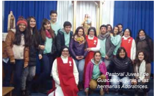
Pastoral Juvenil de Guacarhue, junto a las hermanas Adoratrices.

Coordinador Juvenil parroquial Parroquia San Juan Evangelista, San Vicente de Tagua Tagua.