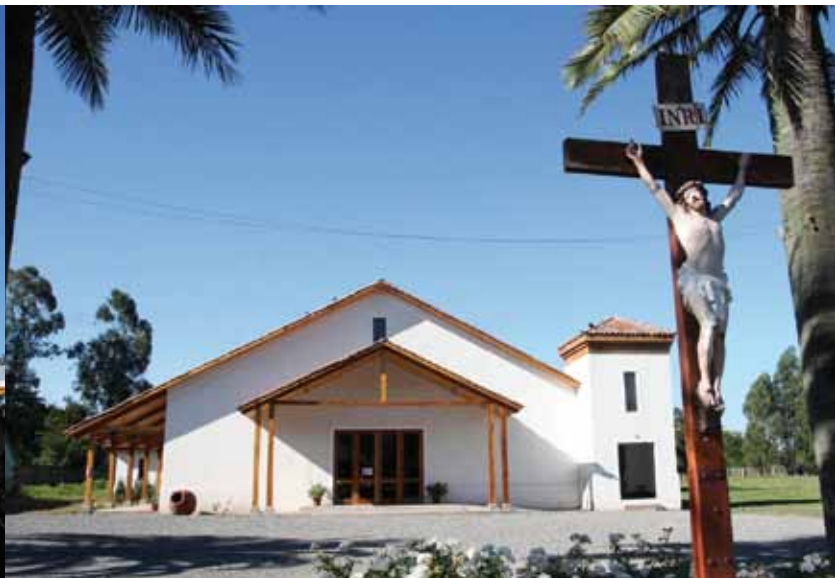
Nuevo templo parroquial de Tinguiririca.