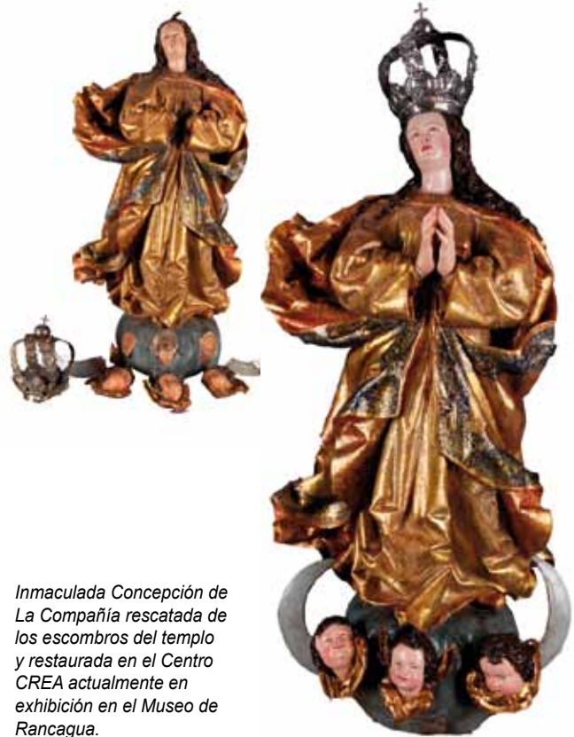
Inmaculada Concepción de La Compañía rescatada de los escombros del templo y restaurada en el Centro CREA actualmente en exhibición en el Museo de Rancagua.

La Fundación La Santa Cruz tiene el encargo de apoyar estos esfuerzos y a partir de este año les está dando prioridad. Es por ello que postuló un proyecto al Programa de Apoyo al Desarrollo de Archivos Iberoamericanos, de la Cooperación Española, para iniciar un proceso de conservación preventiva y educativa de los archivos parroquiales históricos, hasta