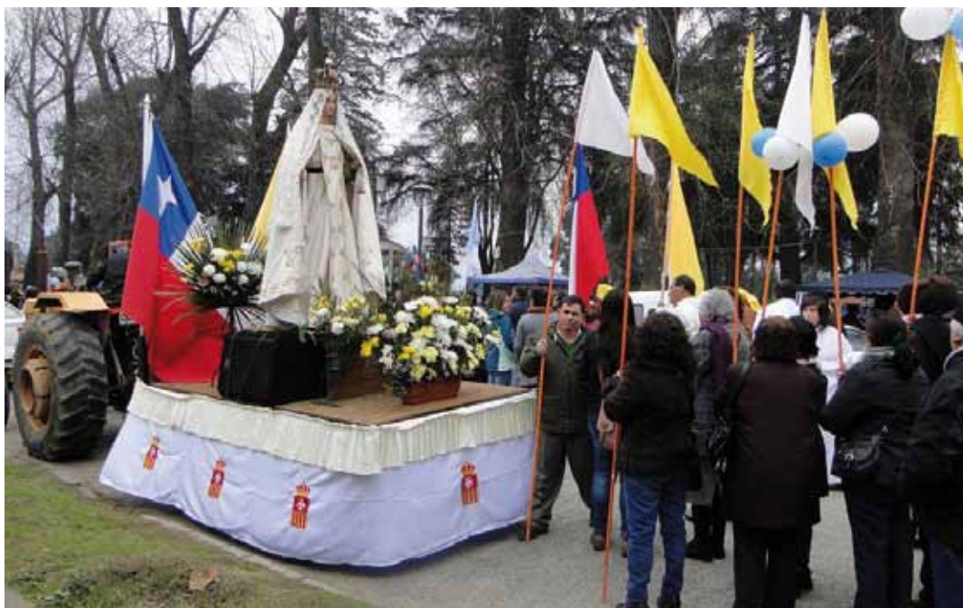
Procesión del Decanato de Purísima.

LOS DECANATOS DE PURÍSIMA Y CARDENAL CARO REALIZARON MASIVAS CELEBRACIONES.