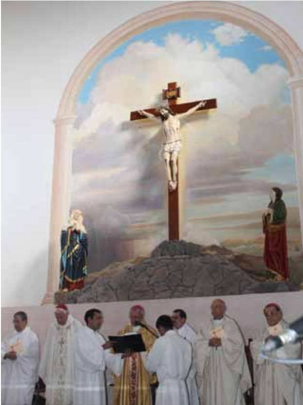
Altar del reconstruido templo parroquial de Santa Cruz.

futuras. Entre ellos hay elementos tangibles (muebles, cuadros, ornamentos e inmuebles) e intangibles (fiestas, ritos, tradiciones) que constituyen nuestro patrimonio cultural, sustrato que fundamenta la identidad, dándole también su carácter específico.