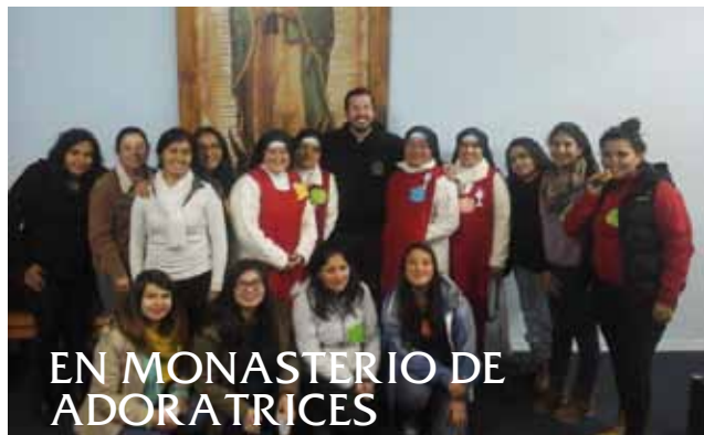
EN MONASTERIO DE ADORATRICES