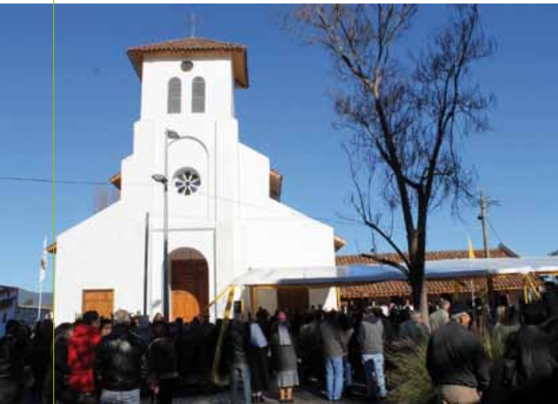
Nuevo templo parroquial de Chépica.

LA IMPORTANCIA Y NECESIDAD DE CONSERVAR EL PATRIMONIO HISTÓRICO Y ARTÍSTICO DE LA IGLESIA HAN SIDO VISUALIZADOS POR LA FUNDACIÓN LA SANTA CRUZ, QUE TIENE EL ENCARGO DE APOYAR ESTOS ESFUERZOS.