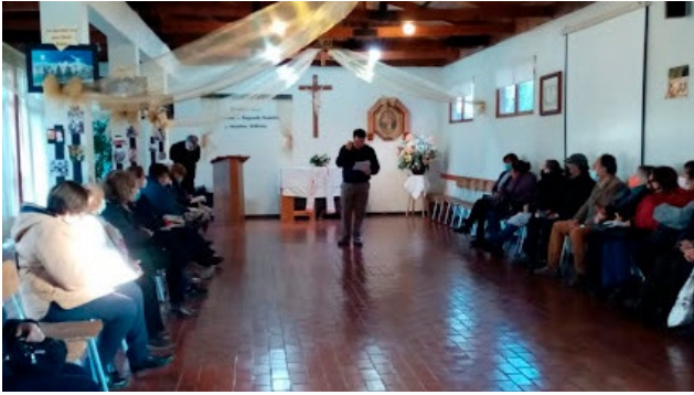
Entre los decanatos visitados se encuentran Purísima, Rancagua y Santos Apóstoles.