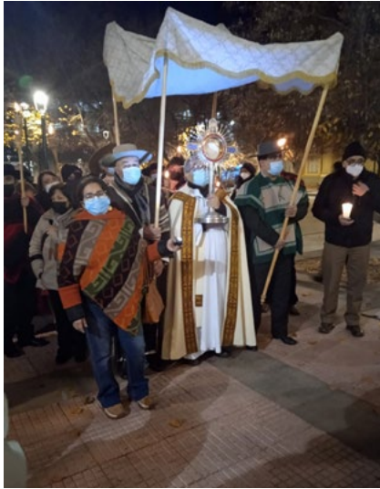
El decanato de Rancagua organizó una procesión desde la P. San Francisco hasta la P. El Sagrari