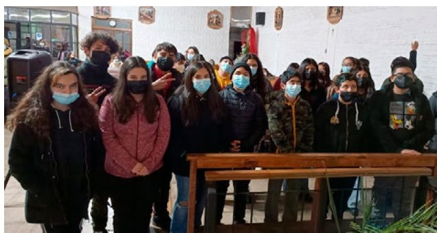
Los jóvenes que se están preparando para recibir el sacramento de la confirmación participaron activamente en las actividades de la fiesta patronal.