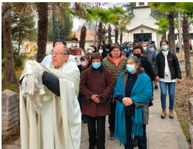
En El Manzano también efectuaron una procesión con el Santísimo.