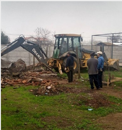
La comunidad está preparando todo para cuando lleguen los jóvenes misioneros a trabajar.

E ntre el próximo 13 y 22 de julio trabajarán en nuestra diócesis, jóvenes misioneros de Trabajo País, quienes realizarán diferentes acciones en algunas de las comunidades parroquiales. Entre ellas, se encuentran Población Claudio Arrau y Parroquia Santa Clara, de Rancagua; comunidad Santa Victoria y La Puntilla, de Pichidegua; Cuchipuy, de San Vicente de Tagua-Tagua; y Nilahue Cornejo de Pumanque. Como parte de este trabajo, el pasado 11 de junio un grupo de jóvenes de la entidad, visitaron las comunidades de Santa Victoria y La Puntilla de la Parroquia Nuestra Señora del Rosario de Pichidegua, donde construirán un salón parroquial y una capilla. Cabe recordar que Trabajo País ha estado más de una vez en nuestra Diócesis desarrollando labores basadas en sus tres pilares: oración, servicio y comunidad, a