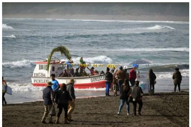
El clima permitió realizar la procesión en los botes.

El párroco de Pichilemu agradeció la coordinación realizada por el Departamento de Turismo de la Ilustre Municipalidad de Pichilemu, los dos Sindicatos de pescadores y fieles de la Parroquia Inmaculada Concepción.