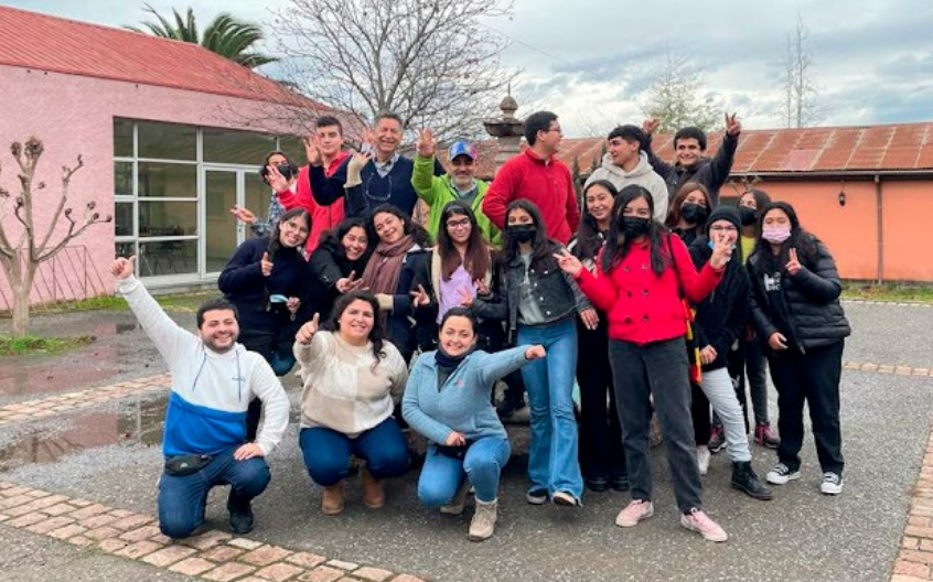
Jóvenes del Decanato Santa Rosa se reunieron en vísperas de Pentecostés en Pelequén.