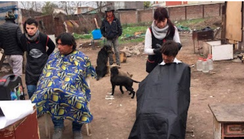
Junto con llevarles alimentos, abrigo, se desarrollan operativos de higiene para las personas situación de calle.