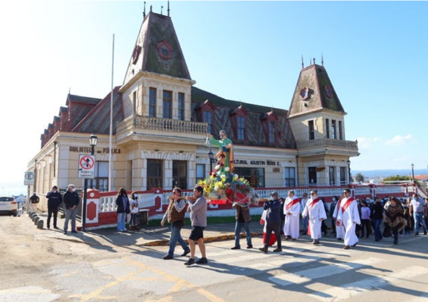
Fieles llevaron en procesión la imagen del santo, desde el templo parroquial hasta la Caleta La Puntilla.