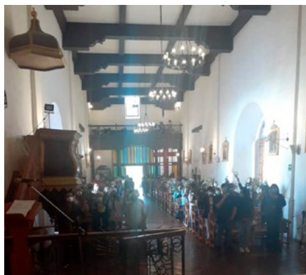
Parte de los compromisos del padre es con los adultos mayores y los jóvenes.