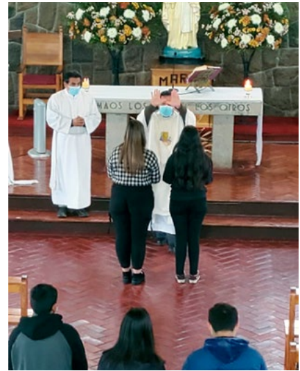
La parroquia Nuestra Señora de La Merced de Coltauco celebró Corpus Christi con la asistencia masiva de los jóvenes que se están preparando la para recibir el sacramento de la Confirmación.