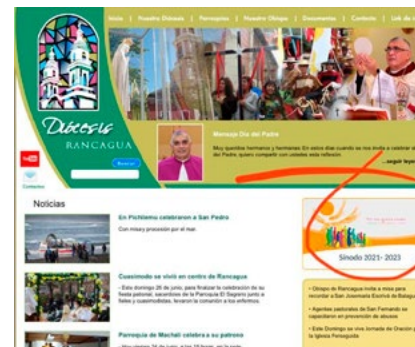
El Informe Diocesano al Sínodo se puede descargar de www.obispododerancagua.cl , sección Sínodo.

b) El martes 9 de noviembre, se realizó un encuentro virtual (Zoom) en el que cerca de 90 personas, entre sacerdotes, religiosos y religiosas, diáconos y agentes pastorales. En éste se explicó el proceso de discernimiento en el que se encuentra la Iglesia chilena y cómo se va articulando con este trabajo sinodal, que ha encargado el Papa Francisco.