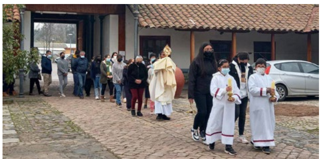
Llegando a la parroquia después de la procesión por las calles del pueblo de Quinta de Tilcoco.