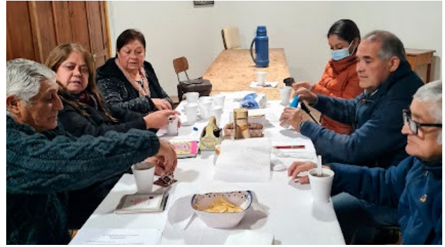
En el ciclo de charlas sobre "El sentido del dolor y el sufrimiento humano" ya han participado alrededor de 60 personas.