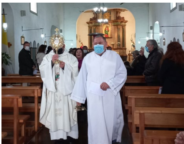
En la parroquia San Judas Tadeo durante la Eucaristía.