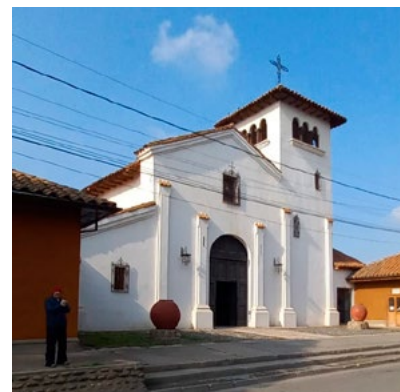
Abrir de par en par las puertas de la iglesia es uno de los desafíos de su párroco, padre Manuel Peña.