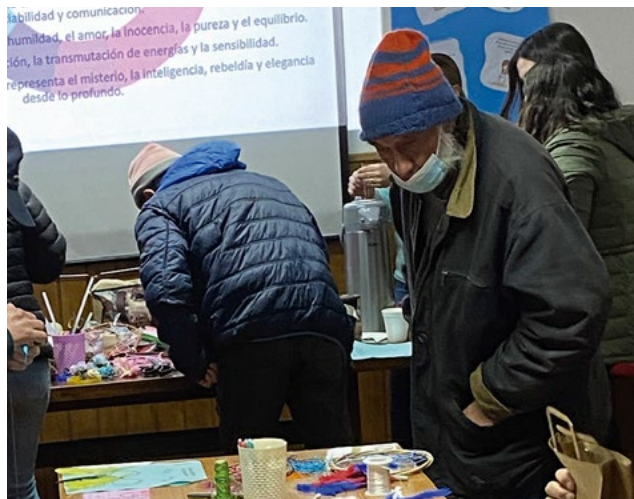
El taller permite a los beneficiarios tener más confianza en sí mismos, adquirir herramientas personales para desarrollar una manualidad y luego venderla.

ellos se vayan empoderando y creyendo en ellos mismos”, acota. Es así como hay participantes que ya están teniendo algún emprendimiento que les permite dejar la situación de calle.