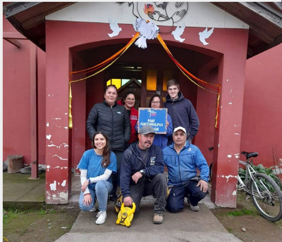
Ya vino un grupo de avanzada de misioneros de Trabajo País a Pichidegua para ver los trabajos que se realizarán.