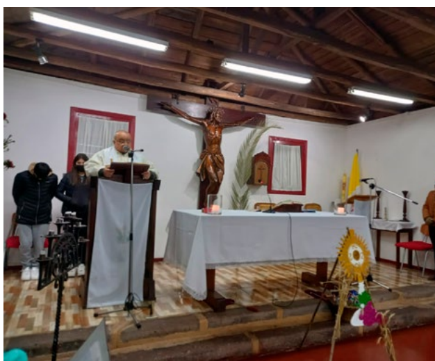
En la parroquia San Nicodemo de Coínco el día de Corpus Christi.