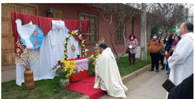
En Malloa los fieles salieron a las calles para adorar la presencia del Señor en medio nuestro.