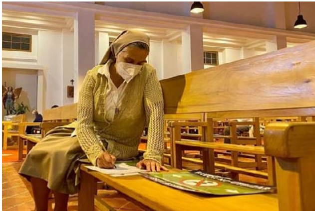
Desde octubre de 2021 se realizaron distintas consultas e instancias de escucha, lo que dio origen a este informe.