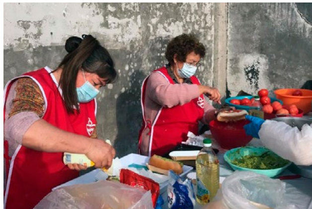
Toda la comunidad ha cooperado para reunir fondos.