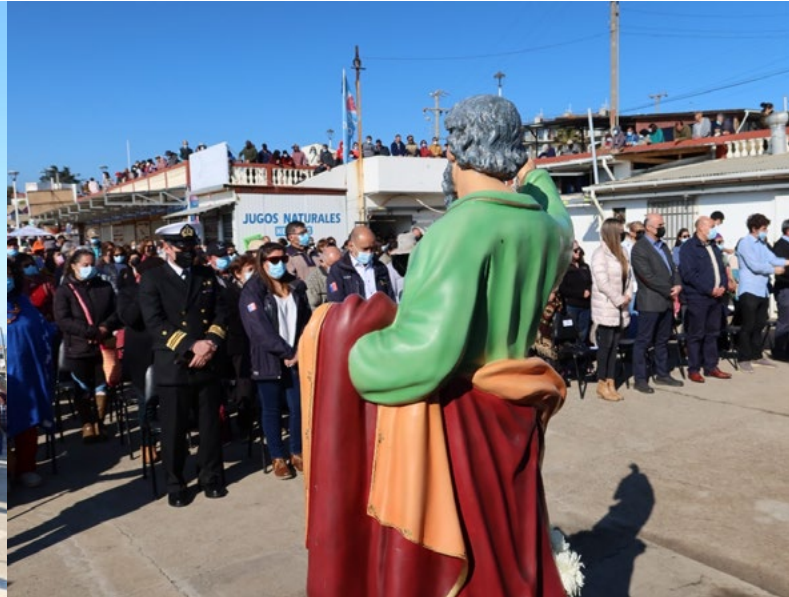
Gran cantidad de personas se reunieron en la caleta.