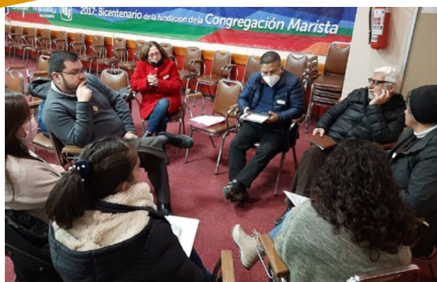
Las asambleas reunieron a laicos y consagrados para dar su parecer.