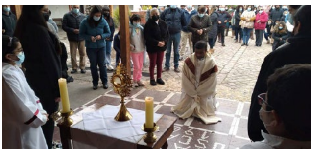
Con gran devoción se vivió esta solemnidad en la parroquia Asunción de María de Quinta de Tilcoco.