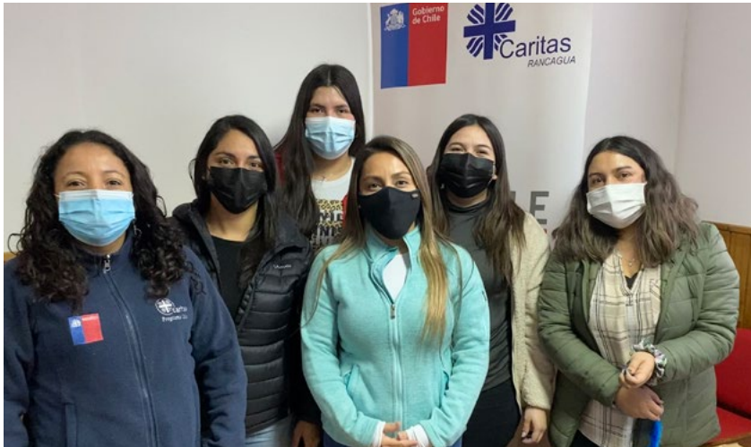
El grupo de profesionales que trabajan en el Programa Calle.