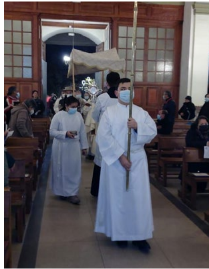
En la Catedral hubo una liturgia y adoración al Santísimo.