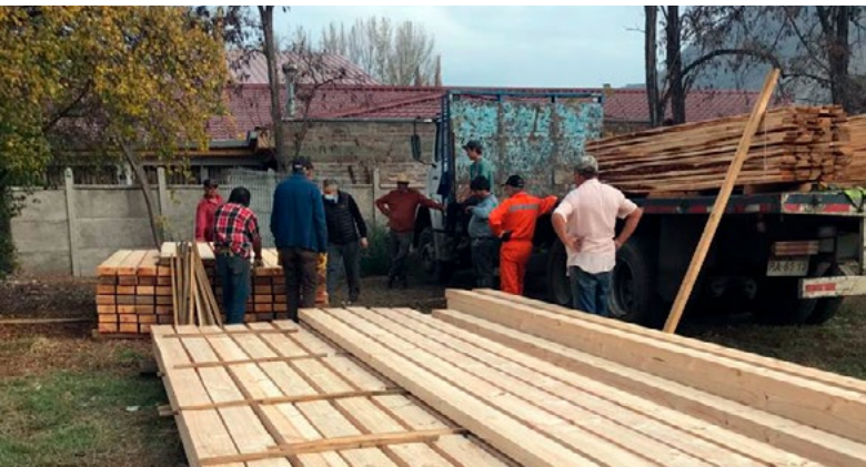
Con los primeros recursos reunidos, la comunidad está trabajando en lo principal para levantar la capilla.