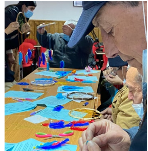
Manuel cuenta que mientras trabajan pueden compartir con el grupo.