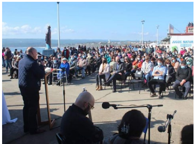
La caleta La Puntilla fue un lugar de encuentro para celebrar esta fiesta.

asistentes pudieron compartir y degustar ceviche de reineta, mariscal, vino navegado, chocolate caliente y sopaipillas. Disfrutando también de los tradicionales pies de cueca con los que se homenajeó a San Pedro.