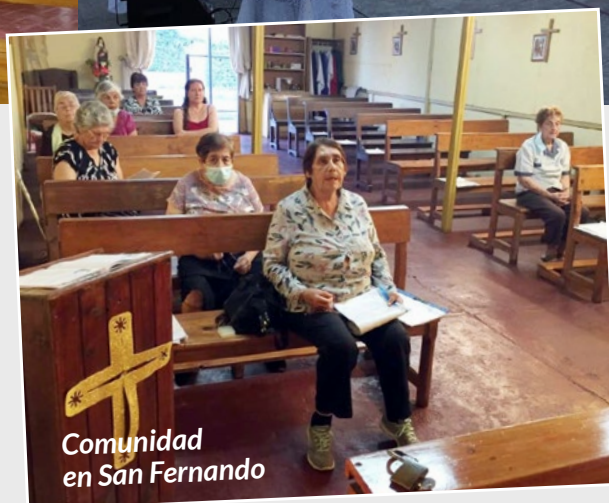
Comunidad en San Fernando