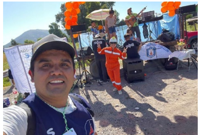
Decanato de Rancagua animó segunda Estación.