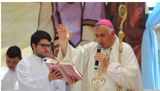
Muchos jóvenes y niños participaron acolitando en la Misa. Además estuvieron los Seminaristas

La gran caravana, a la que en algunos tramos los Bomberos rociaron con agua para refrescar, llegó al