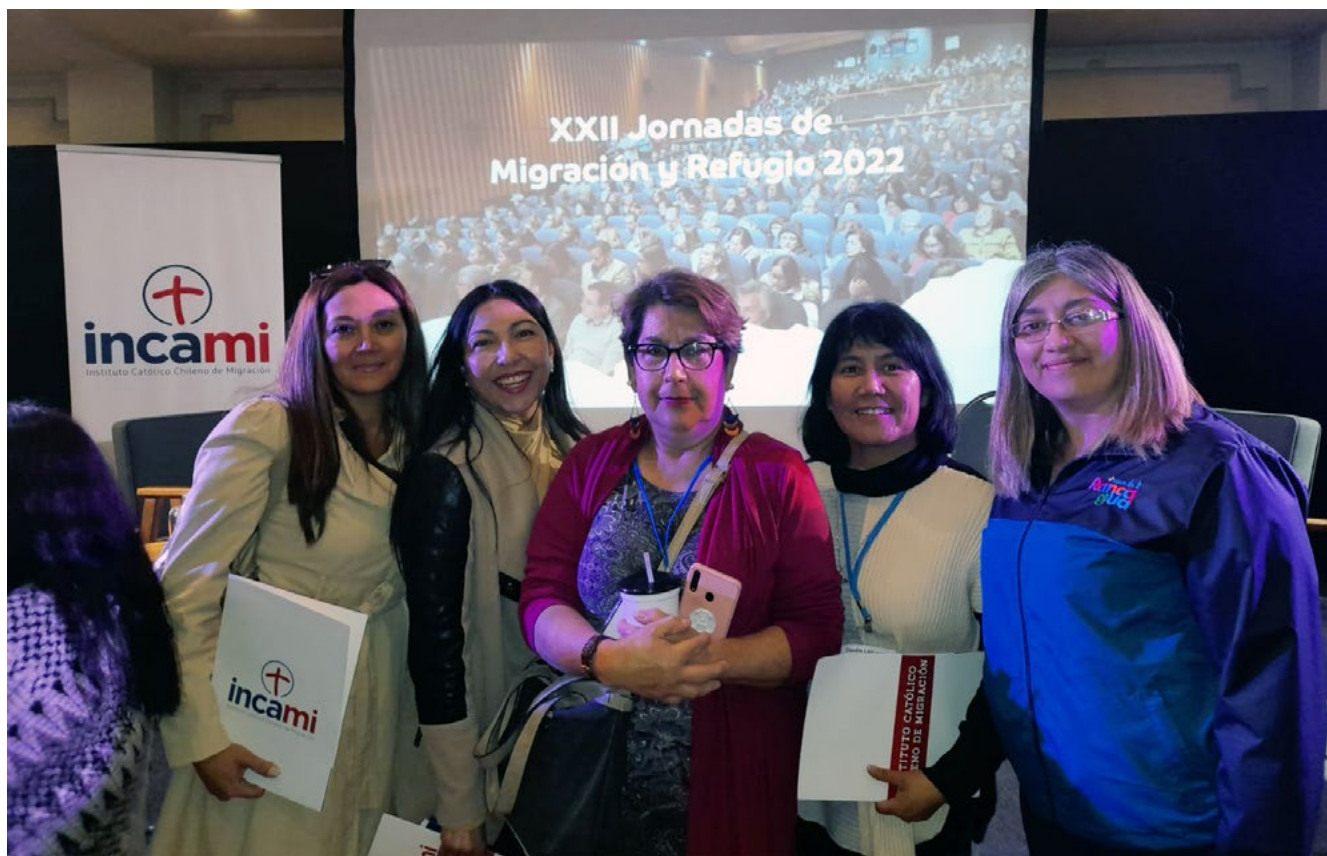
Delegación de Rancagua que participó en las Jornadas.

los rostros de Cristo en los más vulnerables de este tiempo y buscando dar respuestas, en la medida de lo posible a las necesidades de cada una de estas personas y sus familias.