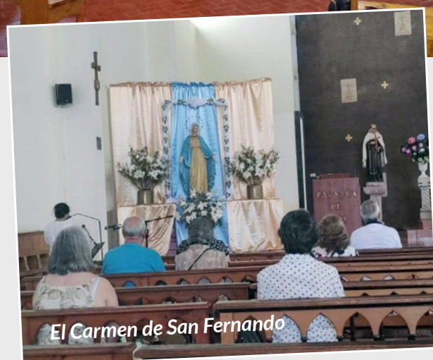
El Carmen de San Fernando