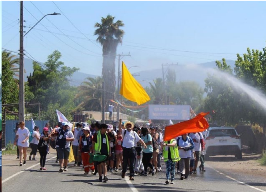
Muchos jóvenes desafiaron el calor y participaron en la peregrinación.