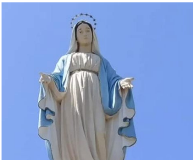
En los santuarios de Puquillay y La Compañía se preparan para recibir a los fieles.

Todo empieza con la misa a la chilena el día 7 de diciembre a las 19 horas, luego habrá una misa cada hora hasta las 24 horas. Desde esa hora y hasta a las 5 de la mañana se realizará una muestra de Canto a Lo Divino, que es tan tradicional durante esta fiesta.