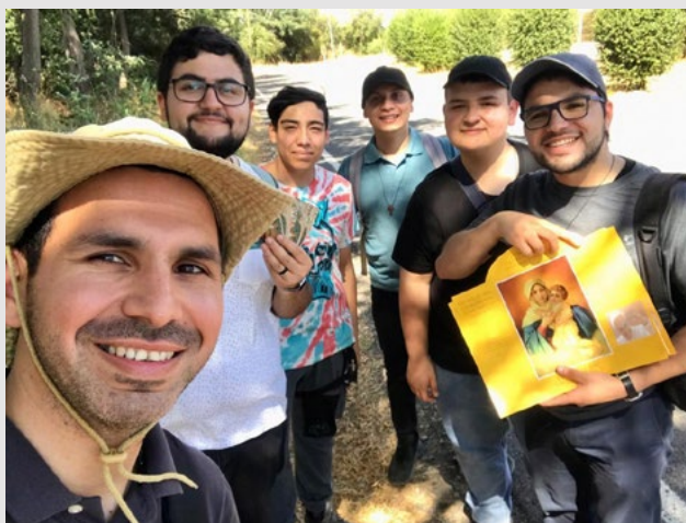
En este tiempo han desarrollado también instancias de misión territorial junto a jóvenes de la diócesis que tienen inquietudes vocacionales hacia una vida sacerdotal.

En otro ámbito, han desarrollado también instancias de misión territorial junto a jóvenes de la diócesis que tienen inquietudes vocacionales hacia una vida sacerdotal y que aún están en