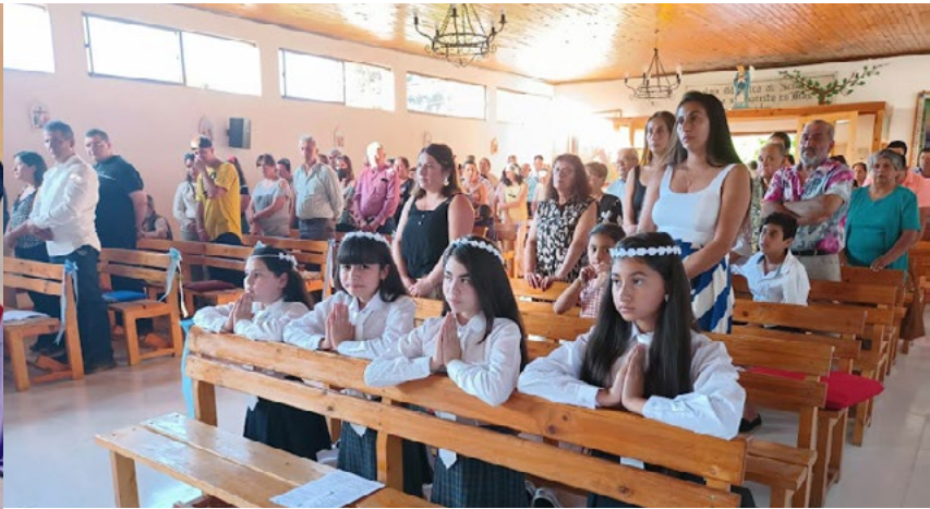
Reactivar la catequesis de Primera Comunión fue una de las primeras tareas en las que se empeñó el padre Miqueles. Este 2023, el objetivo es retomar con fuerza la de Confirmación y Confirmación de adultos.