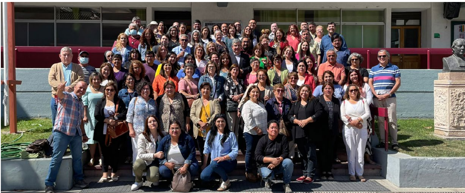
Cerca de un centenar de profesores de religión católica de la Diócesis de Rancagua asistieron a la jornada presencial del Congreso Interdiocesano.