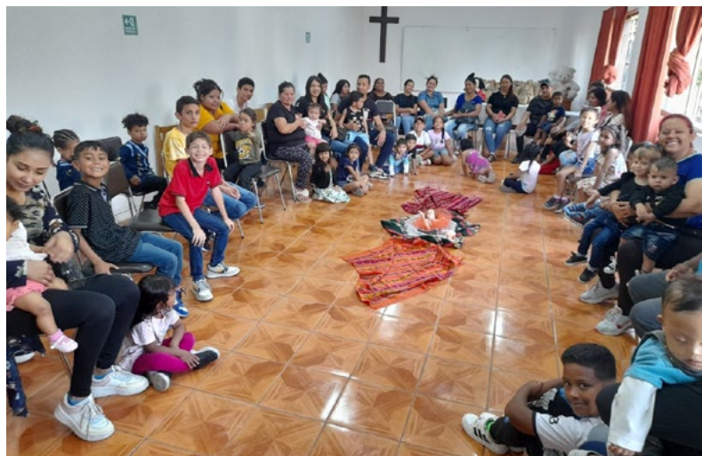
El departamento también realiza celebraciones en las que se unen personas de distintos países.

Todo lo anterior se va logrando con disposición a aprender, para ello el equipo se ha abierto a recibir formación en jornadas, diplomados, charlas y reuniones que permiten obtener insumos que van en directo beneficio de las personas a las cuales atendemos. Hemos aprendido a pedir ayuda y aquí me quiero detener, porque hay personas, parroquias, colegios, profesionales y fundaciones que nos apoyan permanentemente a través de campañas solidarias; otras, nosotras les solicitamos para actividades o acciones concretas que hemos desarrollado durante el año como son apoyo de arriendos compartidos en los meses de invierno, frazadas, compra de pañales, alimentos,