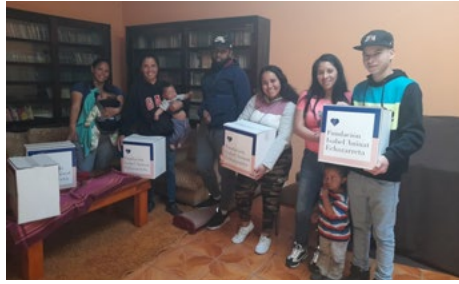
16 | Pastoral de Migrantes, los aprendizajes y desafíos