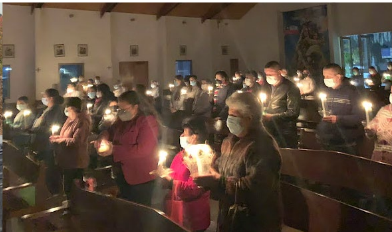
Los feligreses participaron felices en la misa de la luz.