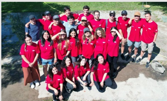
En la localidad de Coya, de Machalí, llegaron 25 voluntarios de Misión País.