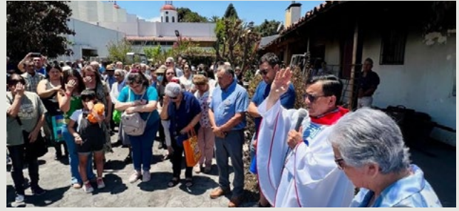
Después de la misa dominical se invitó a los fieles a ingresar al sitio del incendio para que viesen en terreno lo ocurrido y para hacer una oración de protección del lugar.