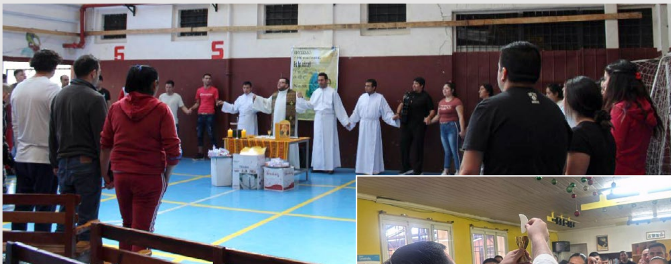
En la cárcel se han efectuado misas con gran participación.