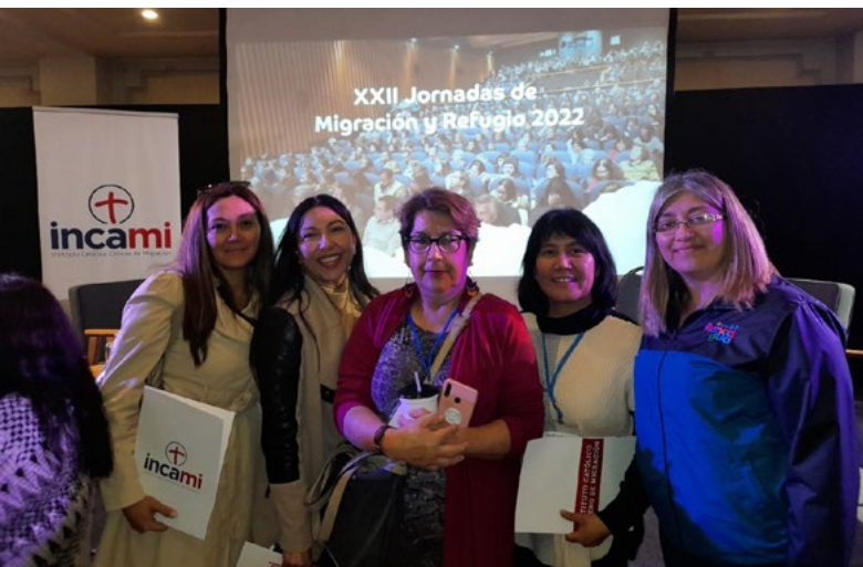
Voluntarias del departamento han participado en seminarios y capacitaciones para entregar una mejor ayuda a quien lo necesita.