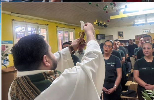
Los seminaristas han misionado en la Cárcel de Santa Cruz, atendiendo a internos y funcionarios.