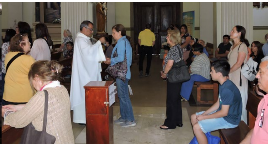
Con mucha devoción participaron los fieles en este adiós al Papa.

empecé a resbalar y siempre me devolvió la luz de su semblante. En retrospectiva veo y comprendo que incluso los tramos oscuros y fatigosos de este camino fueron para mi salvación y que fue en ellos donde Él me guió bien.