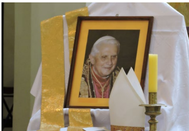
Papa Benedicto XVI falleció el 31 de diciembre de 2022.