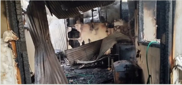
Totalmente destruida resultó la casa parroquial de San Vicente