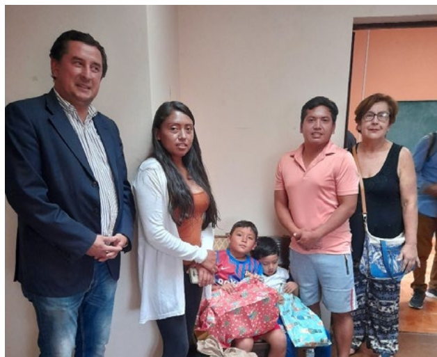
Familias de migrantes llegan a la oficina del departamento, ubicada en Cuevas 050, a solicitar orientación y ayuda. El departamento también apoya con víveres.