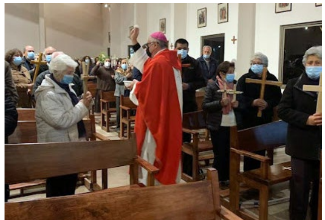
El obispo de Rancagua, monseñor Guillermo Vera Soto en su visita a la parroquia de Tinguiririca, durante su fiesta patronal.

son los que van indicando las necesidades y hay personas que colaboran para llegar a ellas”.