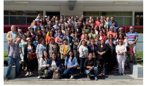
20 | Profesores de religión católica en Congreso Interdiocesano