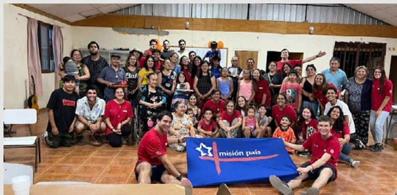
Durante su estadía en Requínoa los jóvenes también tuvieron momentos de reflexión con la comunidad.