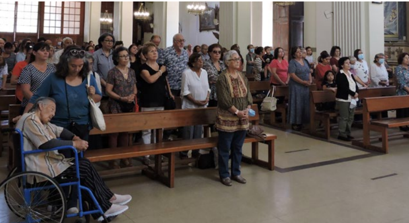
Gran cantidad de fieles participaron en la misa.