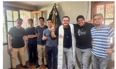
24 | Los frutos de la Pastoral Vocacional