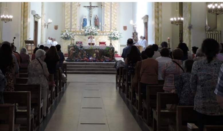
El 6 de enero se ofició una misa en la Catedral de Rancagua por el fallecido Papa.