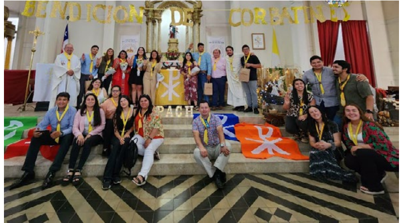
Son doce jóvenes: dos asesores laicos y 9 dirigentes, los que comenzarán a trabajar para contagiar en niños de 5 a 17 años, el color amarillo en Rengo y puedan conocer a Jesús a través del juego.