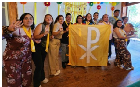
22 | Jóvenes comprometidos con la fe