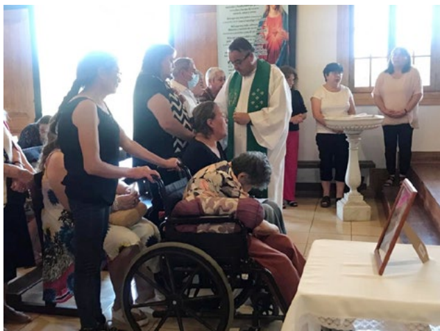
En la Parroquia Jesús Buen Pastor se realizó una novena que concluyó con la misa, en la cual se dio la Unción a los Enfermos.