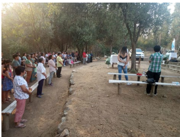
Hasta el cerro llegaron los fieles de Peumo para celebrar a la Virgen de Lourdes.

Gran cantidad de fieles llegó hasta la capilla de Los Marcos para celebrar la eucaristía junto al obispo diocesano.