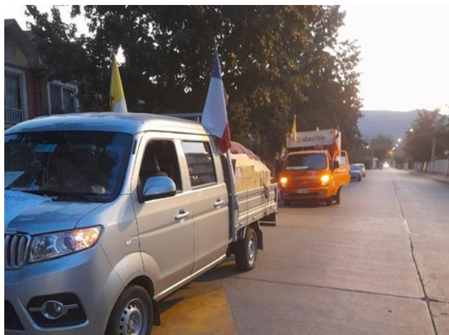
Caravana de ayuda de Machalí partió a Ninhue, región de Ñuble.

que realizaron los Agustinos presentes en la región del Bío Bío, específicamente las parroquias San Agustín de Concepción y El Buen Pastor de San Pedro de la Paz. Ellos se contactaron con el párroco de Santa Juana, quien les indicó las necesidades más apremiantes. Entre ellas estaba el conseguir 200 estanques de agua para las familias que no cuentan con agua potable y que deben recibir agua de los camiones aljibes. Como los incendios destruyeron también sus estanques han visto muy dificultada la posibilidad de recibir este elemento vital, para cubrir sus necesidades más básicas.