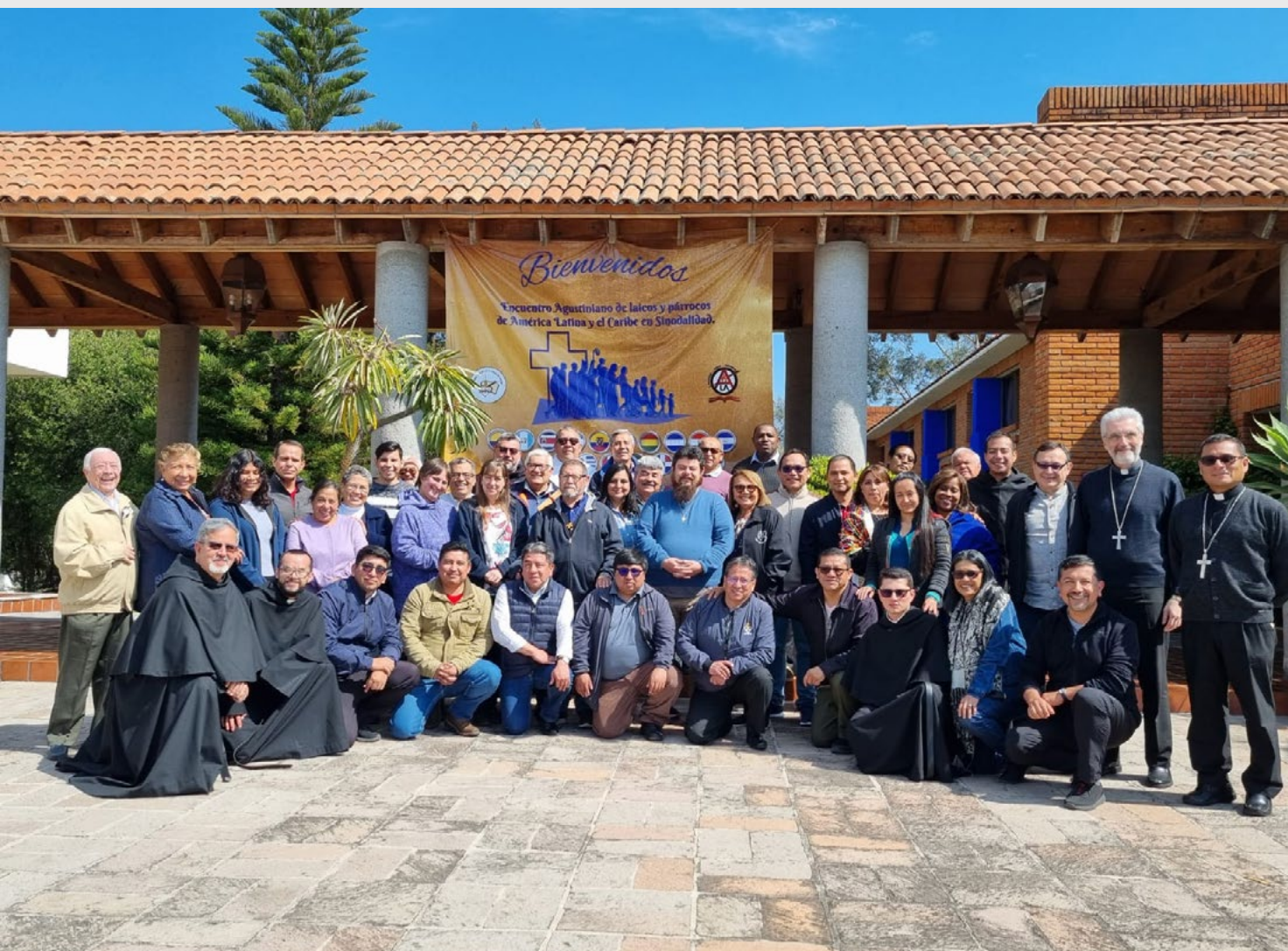
Participantes del Encuentro realizado en México.

Fue un encuentro con una alta participación de laicos, y no solamente en todo momento fuimos respetuosamente escuchados, sino que las propuestas y aportes fueron recibidos con idéntica valoración a los que podía manifestar en un grupo de trabajo un obispo, por ejemplo.