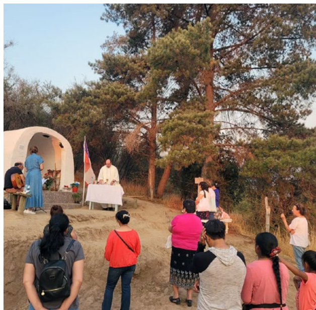
En El Manzano , se celebró la Santa Misa en el día de la Virgen de Lourdes en el cerrito de La Llavérica .

Así también celebraron en otras comunidades tales como: Peumo , San Vicente de Tagua Tagua , en la capilla de Los Marcos de Codegua , hasta donde llegó nuestro obispo diocesano el 9 de febrero a oficiar la Santa Misa , entre otras.