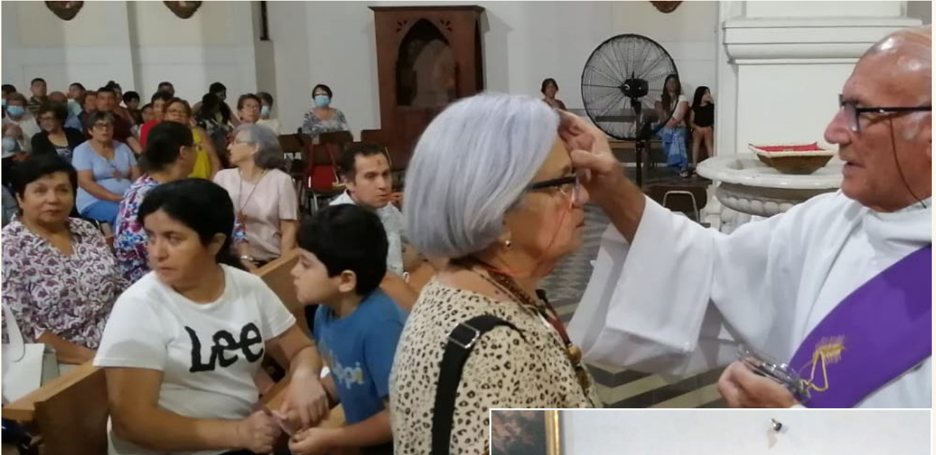
En la Basílica Santa Ana de Rengo hubo gran presencia de fieles.