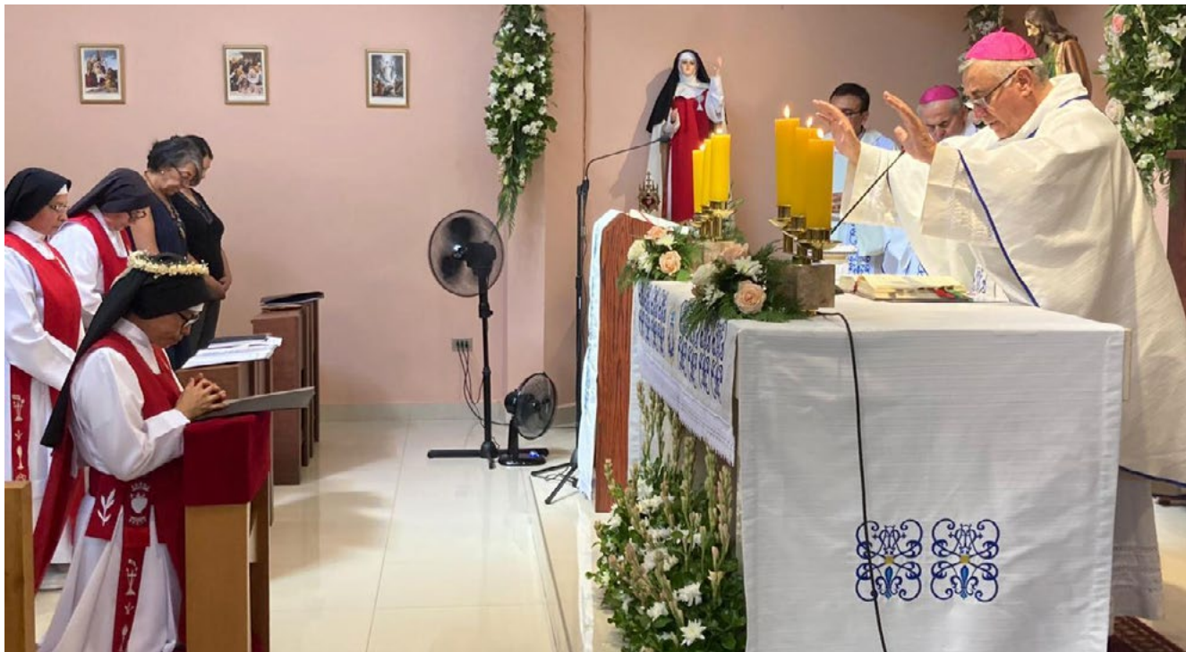
El obispo diocesano presidió la ceremonia.