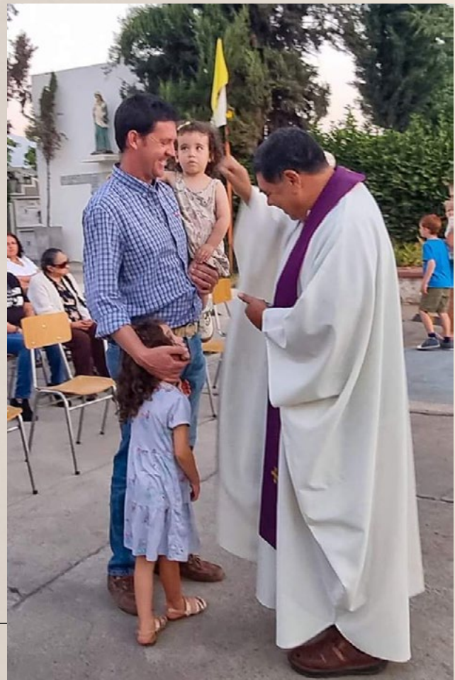
Una de las misas de miércoles de ceniza se realizó en el cementerio de Codegua.

Entregamos algunas imágenes de celebraciones de Miércoles de Ceniza en distintas parroquias y comunidades de la diócesis.