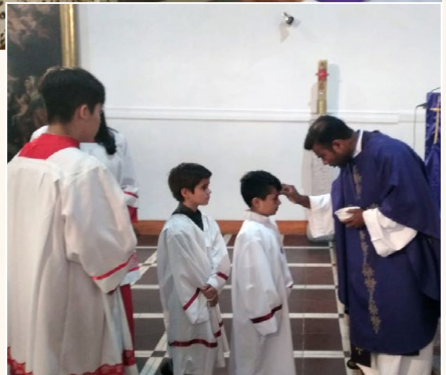
En la P. Asunción de María de Quinta de Tilcoco se destacó el camino de conversión que se inicia con la Cuaresma.