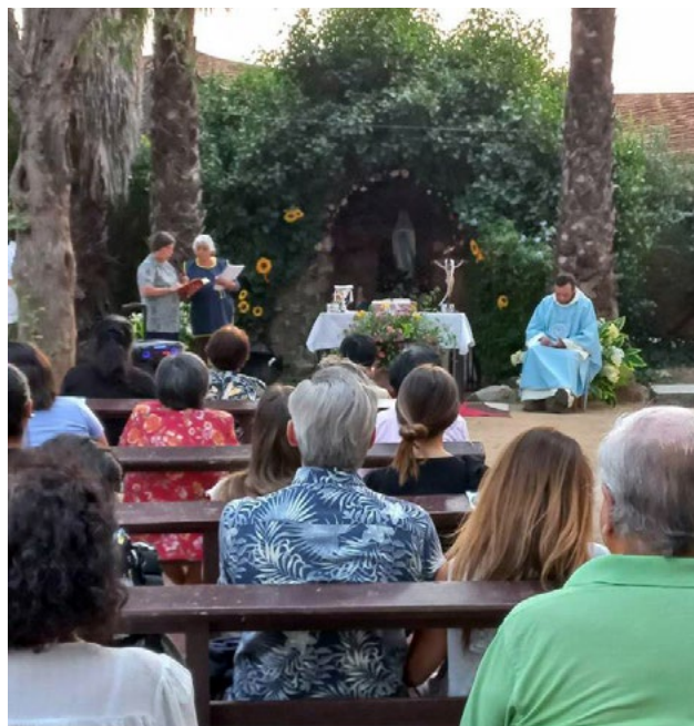
En La Torina, dependiente de la Parroquia de Pichidegua, se celebró al aire libre una misa, frente a la gruta.