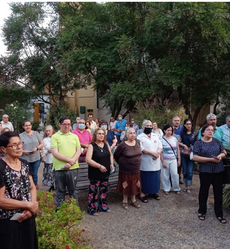
En Rengo, en la Basilica Santa Ana , se realizó una misa y posteriormente, frente a la gruta afuera del templo, se hizo una bendición a los enfermos.