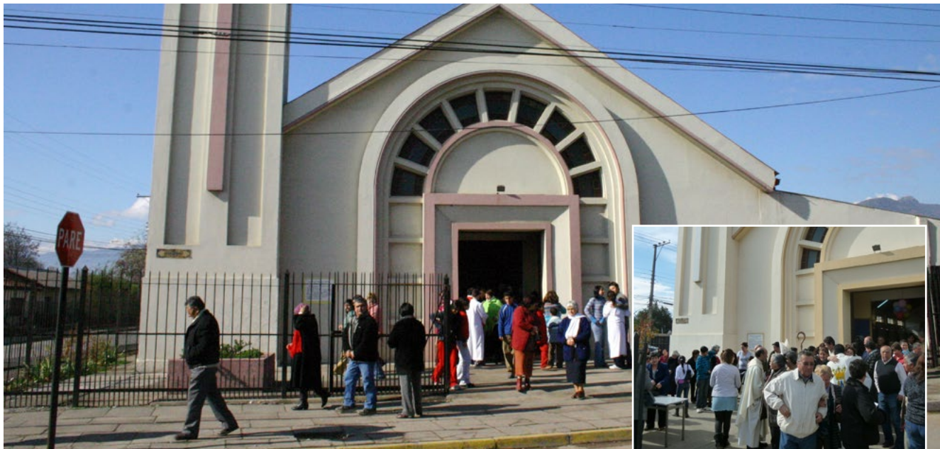
Hace 55 años que la Parroquia San José Obrero se desmembró de la P. El Sagrario, creando su propia identidad.