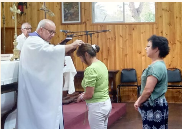
En las distintas comunidades que componen la Parroquia de Coínco se realizó la imposición de las cenizas.