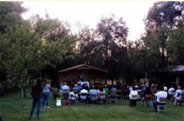
La misa se realizó en la ermita de la Parroquia Jesús Crucificado de Los Lirios.