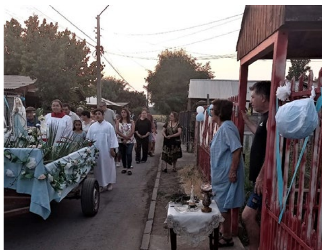
Los fieles realizaron una procesión con la imagen de la Virgen en Quinta de Tilco.