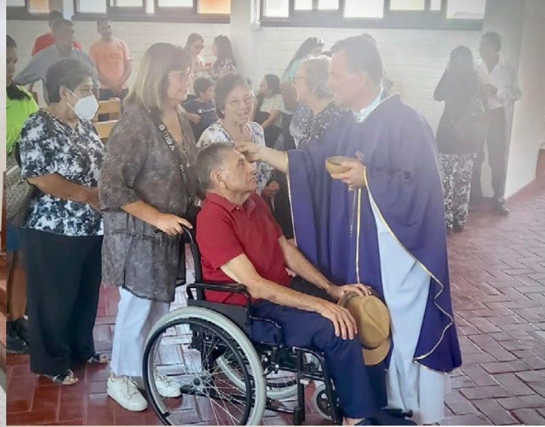
En la P. El Carmen de San Fernando, con alegría y con una buena afluencia de fieles desde niños pequeños a personas con discapacidades y adultos, se realizó la imposición de las Cenizas en las tres eucaristías.