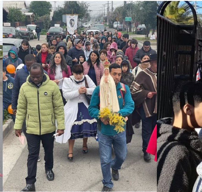
Con alegría la comunidad rancagüina participó en la caminata como celebración del Día del Joven Católico.