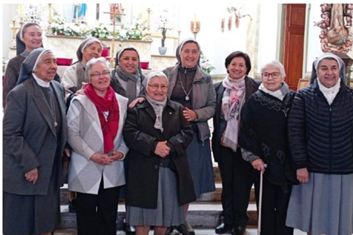
Las hermanas Esclavas del Sagrado Corazón de Jesús que con esfuerzo, entrega y generosidad han transmitido el carisma de la beata Catalina por generaciones de estudiantes.