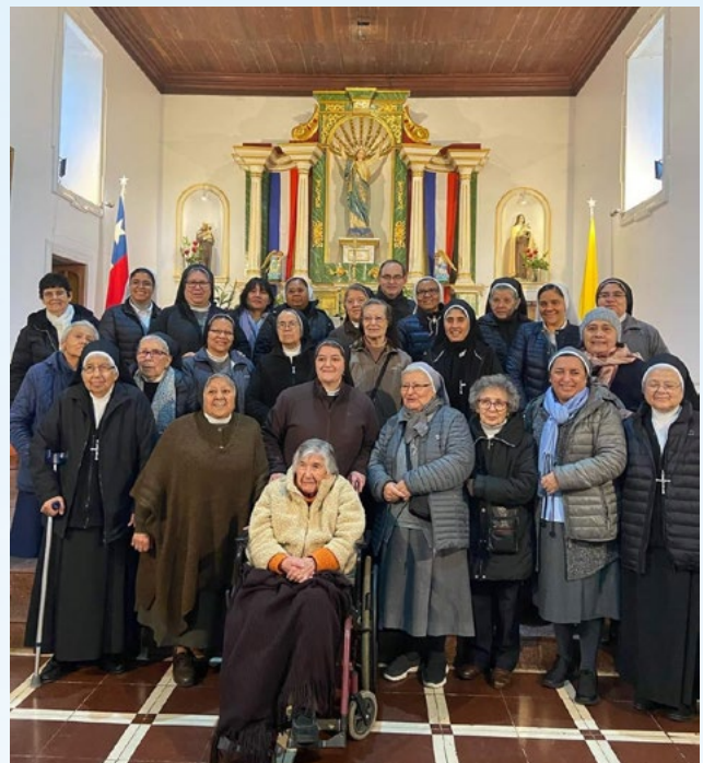
Religiosas celebraron su día en la parroquia de Quinta de Tilcoco.

Hay que recordar que en la Diócesis de Rancagua existen 13 comunidades religiosas masculinas y 20 comunidades religiosas femeninas distribuidas en diferentes comunas de la Región de O’Higgins.