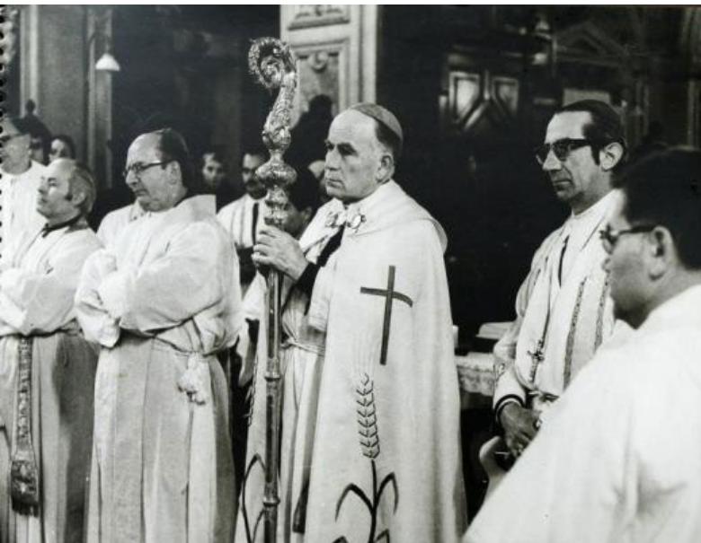
Foto del Cardenal Raúl Silva durante misa en la Catedral de Santiago.