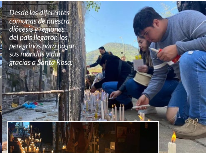
Desde las diferentes comunas de nuestra diócesis y regiones del país llegaron los peregrinos para pagar sus mandas y dar gracias a Santa Rosa.