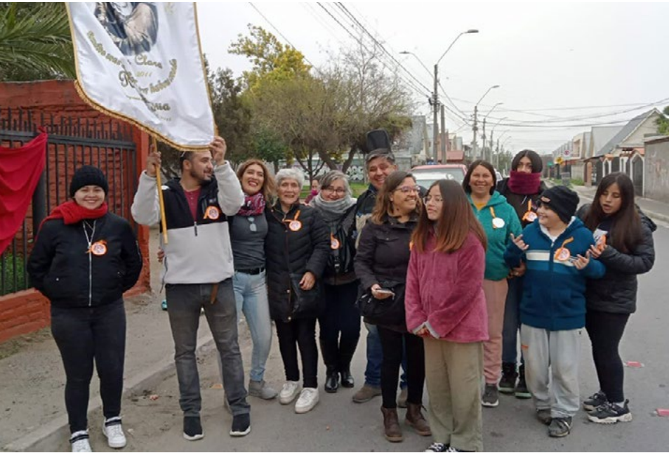
Desde diferentes puntos de Rancagua participaron en la procesión y posterior Cantata a la Virgen.