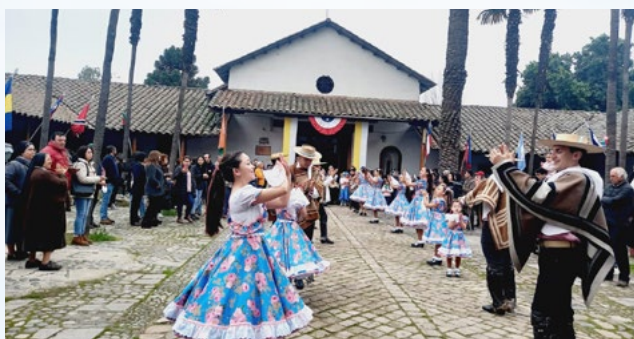
Quinta de Tilcoco celebró su fiesta patronal el día de la Asunción de la Virgen y día de la Vida Consagrada, con una Eucaristía, cantos y varios pies de cueca.

También en Lo Miranda celebraron su fiesta patronal con diversas actividades pastorales en homenaje a la Asunción de la Virgen.