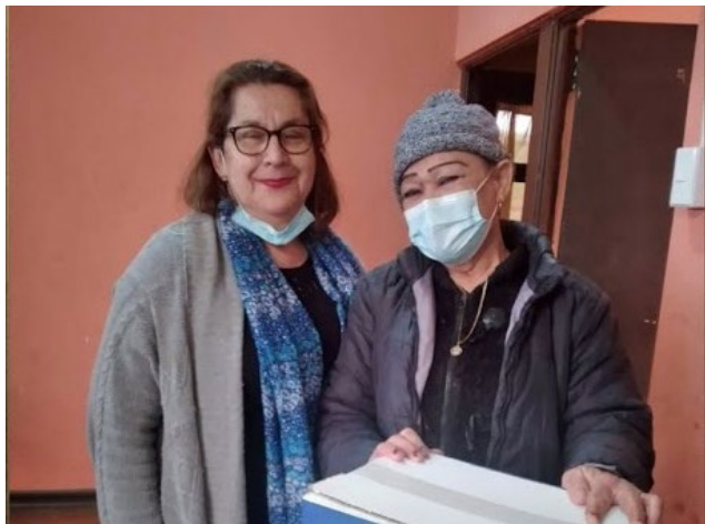
La Pastoral de Migrantes, con aporte de la diócesis, entregó ayuda solidaria a los migrantes de la Diócesis.

Esta nueva ley promulga en democracia y en convenios distintos actores de la sociedad civil en tema migratorio y de derechos humanos. De esta manera se da cuenta que para abordar el fenómeno de la migración que afecta a nuestro país es necesario una mirada integral, que los enfoques con los que se lee este proceso deben ser dialogados. Y eso es un gran avance. Aunque se mantiene el lineamiento de seguridad del Estado. Otro avance que esta ley impulsa y que aún no se logra definir con total claridad es la idea de que, si la persona extranjera hace un debido proceso, entiéndose su regularización migratoria, podrá acceder a prestaciones del Estado en el ámbito social. Si bien esta en el texto. No se ha logrado implementar por el entrapamiento que hay aún hoy en los procesos por parte de las instituciones administrativas que lo regulan.