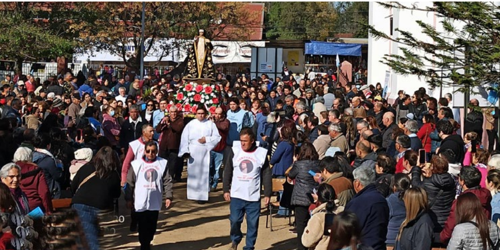
Masivamente llegaron este año los peregrinos hasta Santa Rosa.