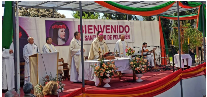
El obispo de Rancagua, monseñor Guillermo Vera Soto presidió la misa solemne el miércoles 30 de agosto al mediodía.