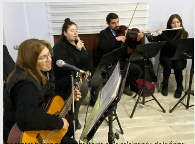
Los cantos fueron parte importante de la celebración de la fiesta patronal.

Con alegría y mucha devoción participaron en la misa solemne, presidida por el obispo de Rancagua.