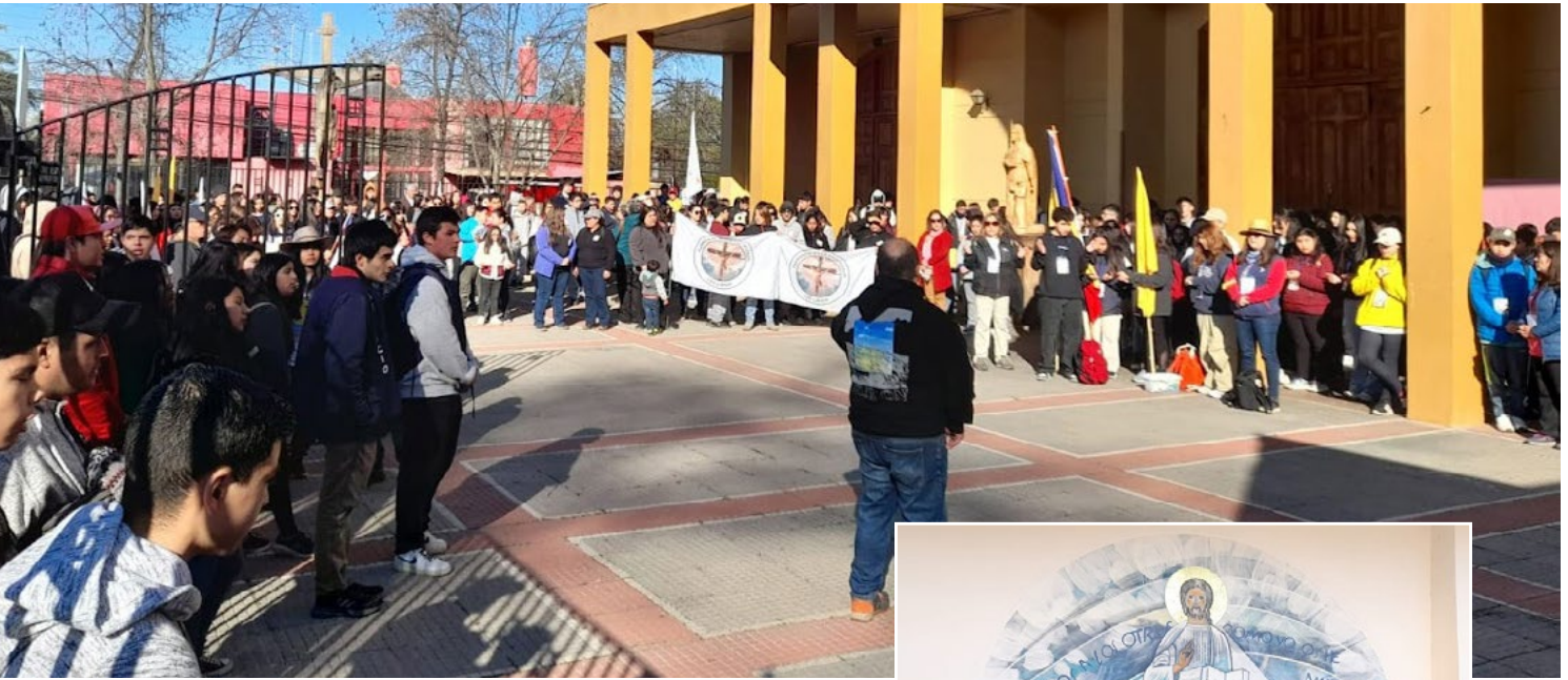
Jóvenes de diferentes partes de la Diócesis se hicieron parte de esta peregrinación juvenil a Santa Rosa.