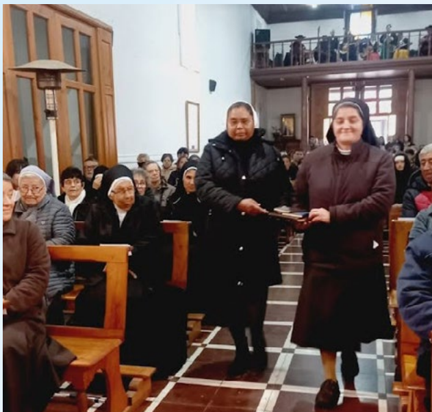
Durante la Eucaristía, las religiosas presentaron sus reglas y Constituciones como signo de compromiso con la vida consagrada.

La jornada comenzó con un desayuno a las 9:30 horas, para luego visitar el Santuario de la Virgen del Carmen y participar de la Eucaristía.