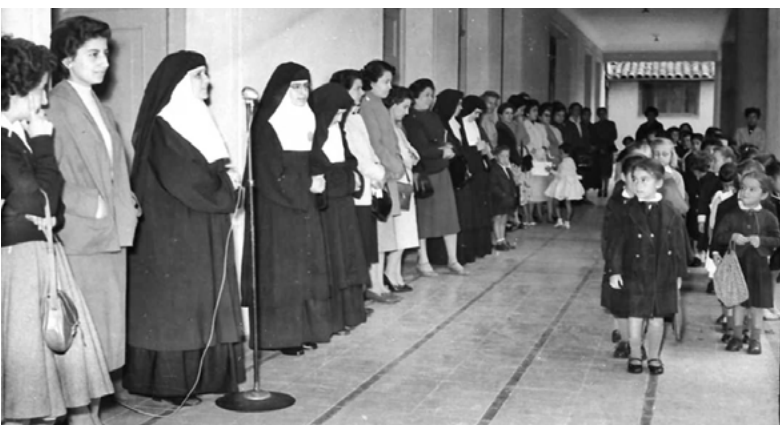
Durante los primeros años de las hermanas en Rancagua en Astorga, cuando todavía usaban hábito negro.