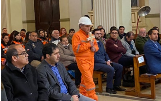
Mineros entregan ofrenda durante la misa en la Catedral.