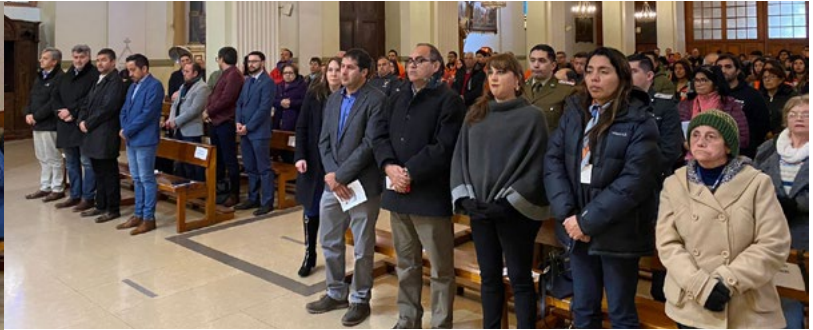
Autoridades regionales, ejecutivos de empresas, trabajadoras y trabajadores mineros, estudiantes y fieles participaron en la misa.