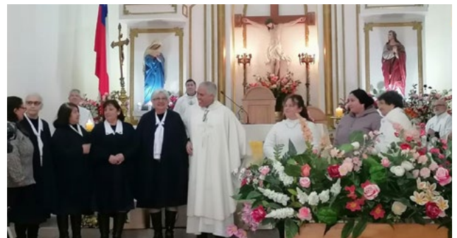
Las Damas del comedor San Vicente de Paul fueron homenajeadas en la misa