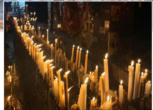
Una tradición que los peregrinos no quieren dejar atrás.