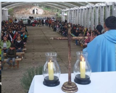
Con una peregrinación hasta el Santuario de Puquillay, los fieles de Nancagua celebraron la solemnidad de la Asunción de la Virgen.