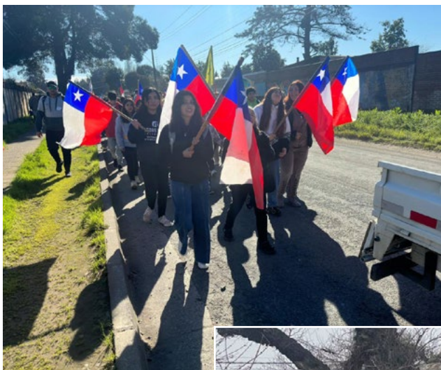
Los jóvenes no dejaron que el cansancio los venciera y tras caminar ocho kilómetros llegaron con alegría a Santa Rosa de Lima de Pelequén.