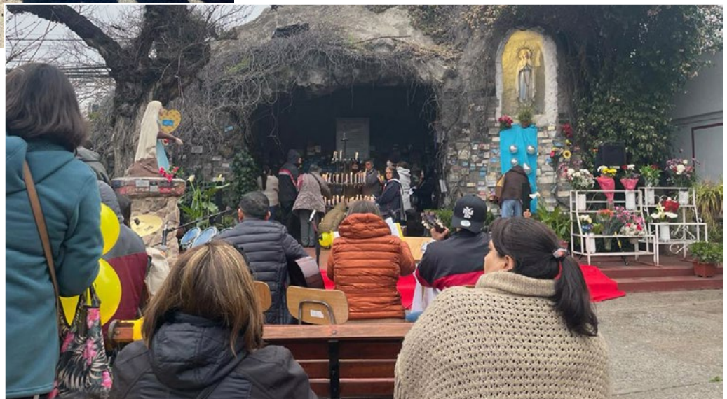
En la capilla Alberto Hurtado se reunieron los jóvenes para peregrinar a la gruta de Lourdes, de la parroquia Cristo Rey.