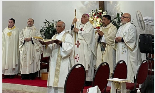
En la Eucaristía de la fiesta patronal de la parroquia San Agustín de San Fernando participaron también los frailes de la comunidad de agustinos, sacerdotes y diáconos del decanato.