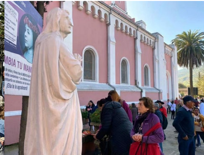
Personas de todas las edades llegaron a Pelquén para expresar su agradecimiento a Santa Rosa.