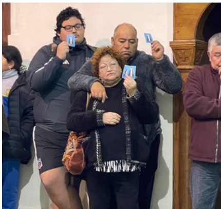
Una manifestación de fe y devoción.