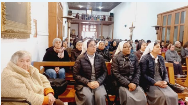
Junto con participar en la Eucaristía, visitaron el Santuario de la virgen del Carmen en Quinta de Tilcoco y compartieron con los fieles durante su fiesta patronal.

En la solemnidad de la Asunción de la Virgen, el 15 de agosto, Religiosos y religiosas celebran su consagración a Dios, participando de una Eucaristía y compartir fraterno, entre otras acciones pastorales.