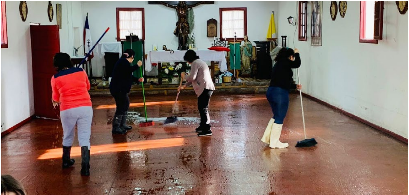
Tras la inundación de la capilla de Chillehue los agentes pastorales de la Parroquia de San Nicodemo de Coínco se trasladaron hasta sus dependencias para apoyar la limpieza.