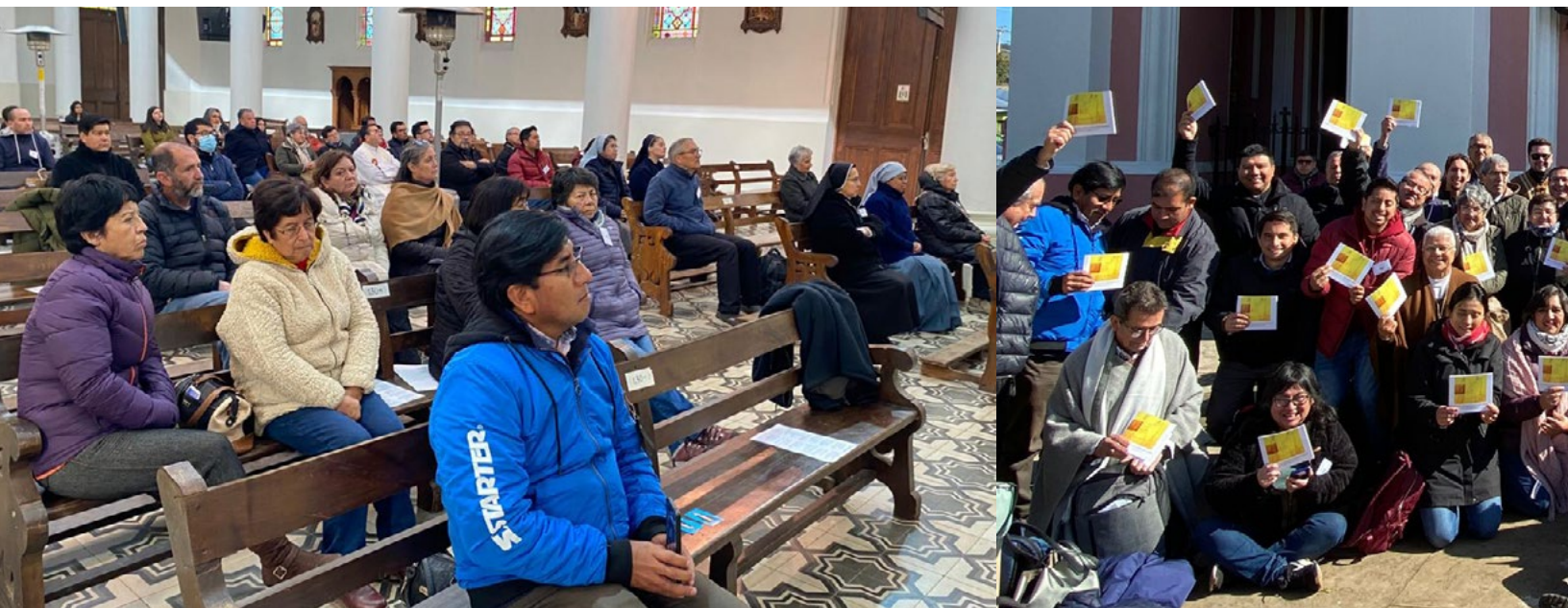
En el encuentro participaron 70 personas de 30 santuarios distintos del país, que pertenecen a 18 diócesis.