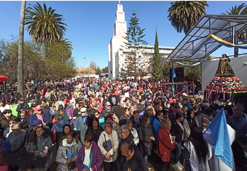
Desde muy temprano comenzaron a llegar los peregrinos al Santuario de Santa Rosa en Pelequén.