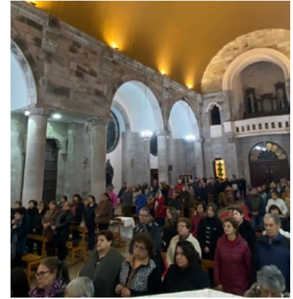
Los fieles participan con alegría en cada una de las actividades de la parroquia.