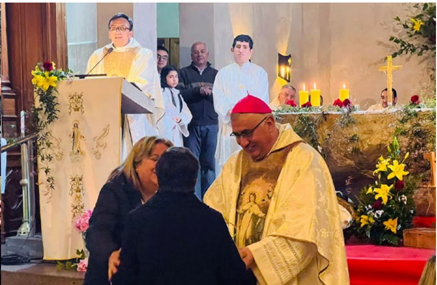
Al finalizar la Eucaristía, se entregaron reconocimientos a quienes han aportado a la iglesia. Tres fueron póstumos y 4 a agentes pastorales activos.