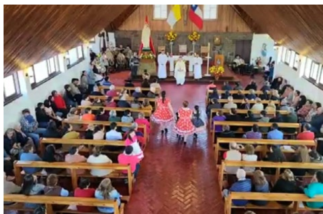
A partir de las 11 horas, la comunidad de Coltauco comenzó la celebración de su fiesta patronal con una procesión de la Santísima Virgen y posterior Eucaristía solemne.