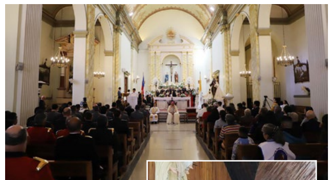
Con fe y devoción se celebró el Te Deum en un templo lleno de fieles.