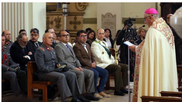
En el templo Catedral se fieles y autoridades a orar por Chile.

El obispo de Rancagua realizó una invitación a trabajar unidos por Chile. Esto se traduce, dijo, “en una capacidad de entrar en diálogo, en saber discutir con fundamentos y altura de miras los temas más delicados” señaló.