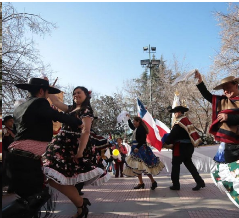
El grupo musical Acupacar, que acompañaba la procesión, bailó unos pies de cueca en honor a la Reina y Madre de Chile