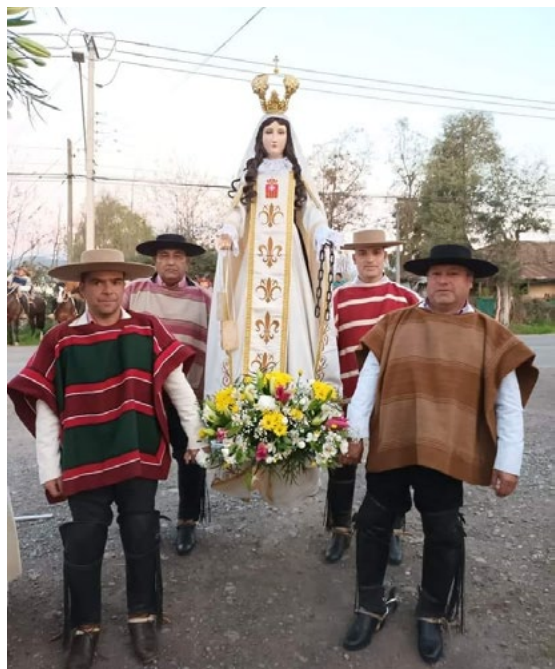
En la capilla Peor es Nada de la parroquia Nuestra Señora de La Merced de Chimbarongo se realizó la tradicional procesión, donde los huasos escoltaron a la Virgen.

A continuación, una muestra fotográfica de cómo se vivió en las comunidades parroquiales esta celebración.