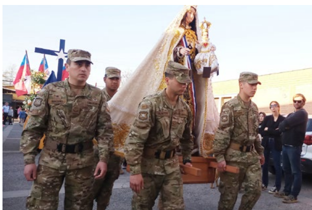
El paso de la peregrinación por las calles céntricas con la imagen de nuestra Madre y Reina de Chile, escoltada por soldados en San Fernando.

Otras parroquias y comunidades también realizaron la Oración por Chile, con distintas homenajes a la “Carmelita”. De esta forma como cada año, el último domingo de septiembre, fieles, sacerdotes, religiosas y diáconos dieron gracias a Dios y a la Virgen del Carmen por la Patria.