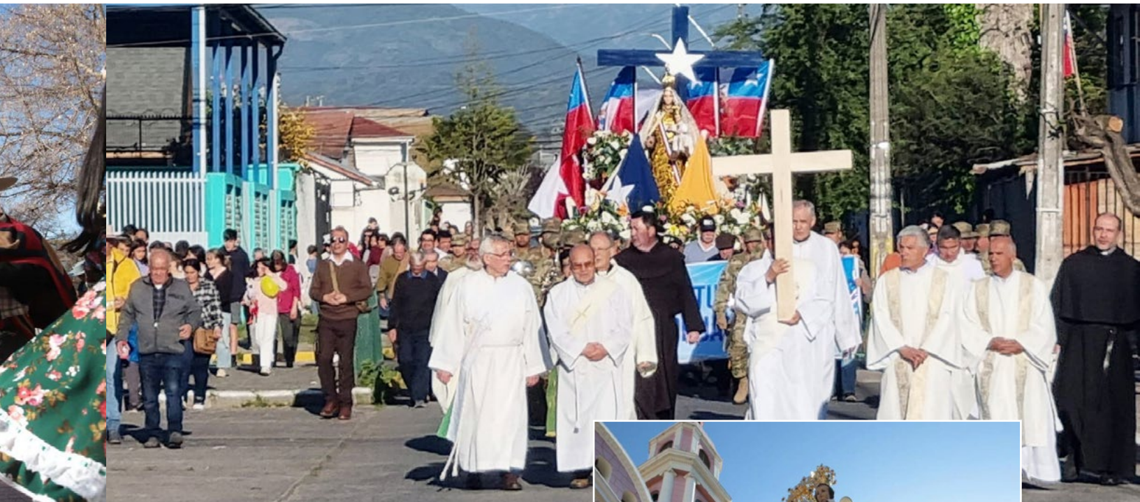
En San Fernando la peregrinación comenzó en la P. San Fernando Rey