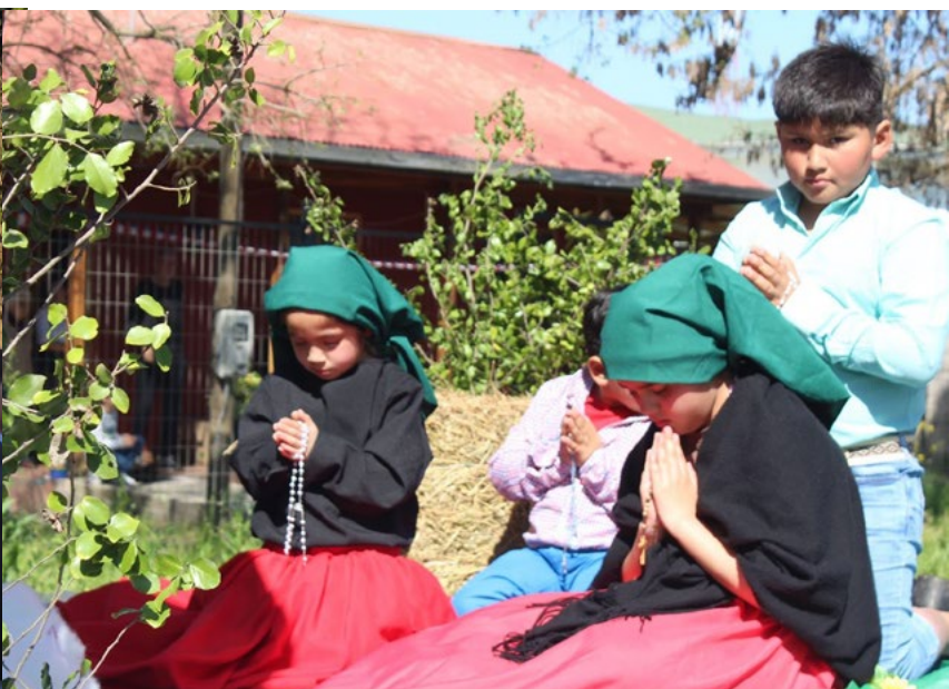
Los niños y jóvenes de Zúñiga participaron en la celebración de la fiesta patronal de la Virgen de La Merced, realizando representaciones de algún pasaje de la Palabra de Dios.