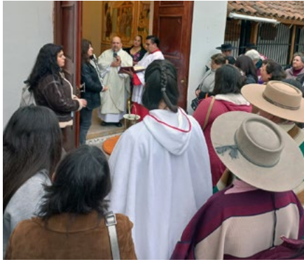
Huasos y files de la Parroquia preparándose a cruzar la Puerta Santa el 22 de septiembre