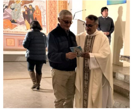
Entrega de Novenario.