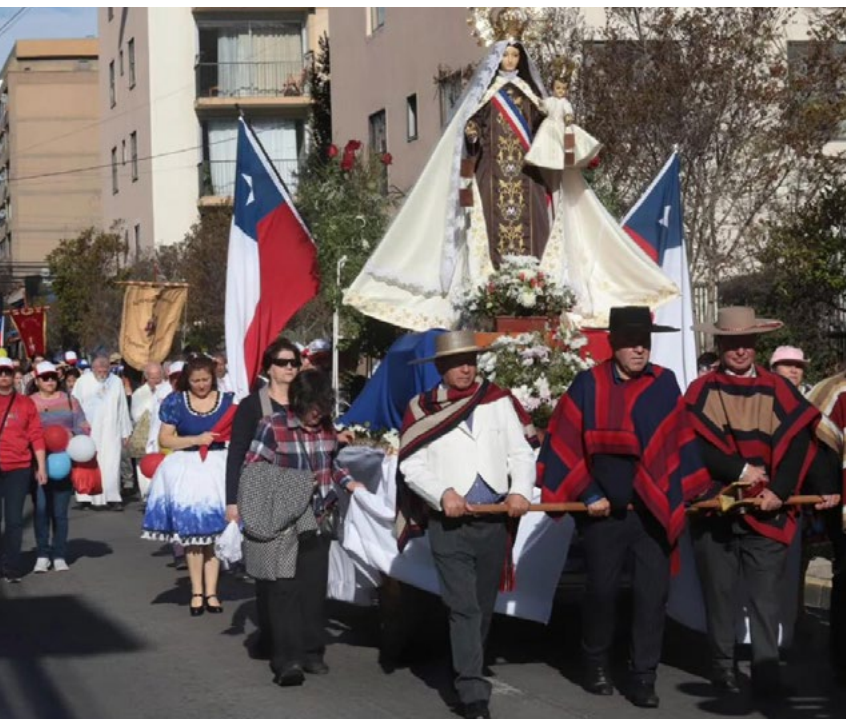
La procesión en Rancagua se llevó a cabo desde el frontis de la Parroquia Nuestra Señora del Carmen hasta la Catedral.