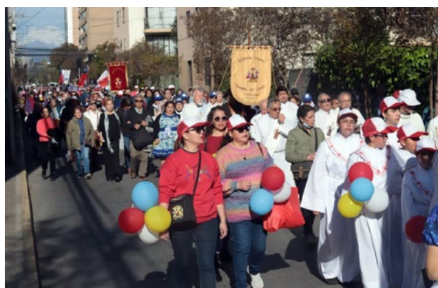
Fieles peregrinaron con la imagen de la Virgen de la Carmen, bellamente adornada con flores en Rancagua.

además, durante todo el trayecto la Virgen del Carmen fue escoltada y aclamada por la Banda de Música del Regimiento N° 19 de Colchagua y Carabineros de Chile.