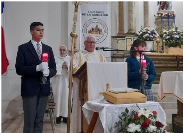
La parroquia Santa Ana de Rengo celebró misa y Te Deum con ocasión de las Fiestas Patrias, el pasado 17 de septiembre.