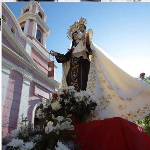
Virgen del Carmen, Reina y Madre de Chile.