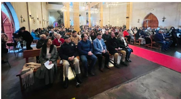
Comunidad en general, autoridades locales y representantes de diferentes instituciones comunales asistieron a la ceremonia y Eucaristía del inicio del Año Santo de La Merced.

Con los sonos de la banda instrumental comunal, los fieles, autoridades e instituciones locales de Doñihue esperaban atentos el inicio de la ceremonia de apertura de la Puerta Santa de la parroquia y posterior Eucaristía Solemne, ritos con los cuales se dio inicio al Año Jubilar de La Merced y el recorrido hacia la celebración de su bicentenario, el próximo año 2024.