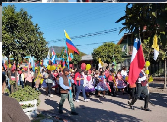
Con una colorida procesión los fieles de la parroquia de Nancagua rindieron homenaje a su patrona.

Con globos, banderas y mucha alegría los fieles celebraron por las calles de Nancagua a su patrona la Virgen de La Merced. También hubo bailes folclóricos y la Santa Misa.