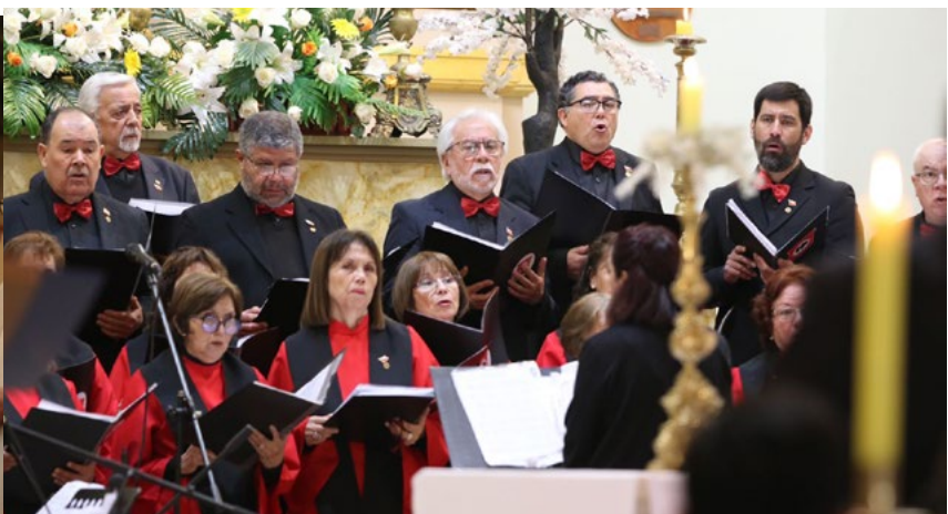
El Coro Braden interpretó el tradicional canto del Te Deum, rogando todos los presentes a Dios por el futuro de Chile.