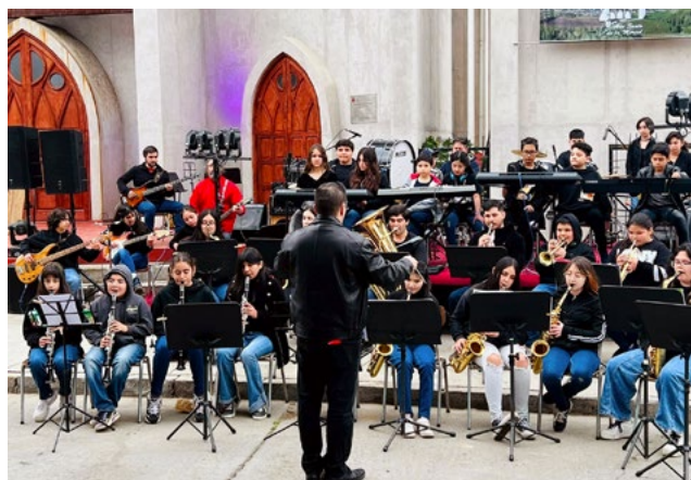
La banda instrumental comunal durante la ceremonia de apertura de la Puerta Santa de la parroquia de Doñihue.

Posteriormente, en su homilía, el obispo Vera señaló en relación con el bicentenario que “estamos siendo testigos de un acontecimiento grande en el mundo de la Iglesia y para la comunidad de Doñihue”. Agregó: “hoy estamos celebrando que hace 200 años caminan como parroquia, pero son muchos más los que han caminado como comunidad creyente”.