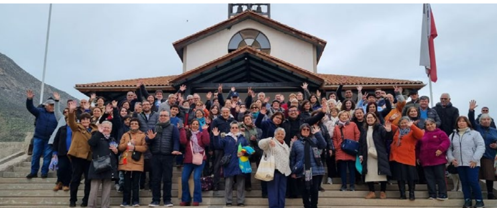
Los fieles de la parroquia realizaron el pasado 2 de septiembre un viaje al Santuario de Santa Teresa de Los Andes.