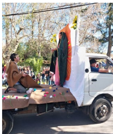
Una hermosa celebración, con procesión, esquinzazo y cuecas en la calle principal y carros alegóricos alusivos la Virgen, se veneró a la Virgen de La Merced en Zúñiga, durante su fiesta patronal.