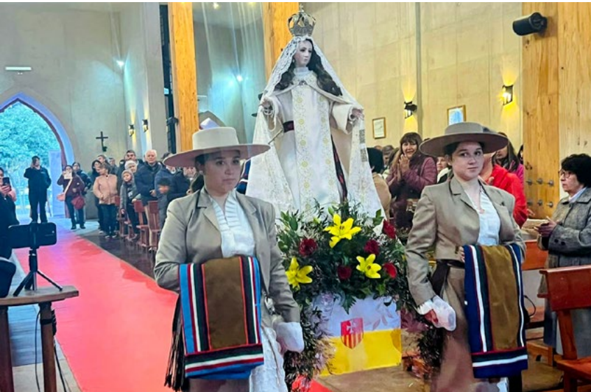
Después del rito, afuera del templo, jóvenes vestidos de huasos escoltaron la imagen de la Virgen hasta un costado del altar, en medio de aplausos espontáneos de los asistentes.