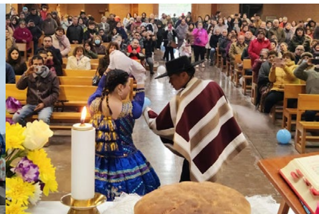
La parroquia San Agustín de San Fernando, cuenta con dos capillas, la de María y de Nuestra Señora del Buen Consejo.