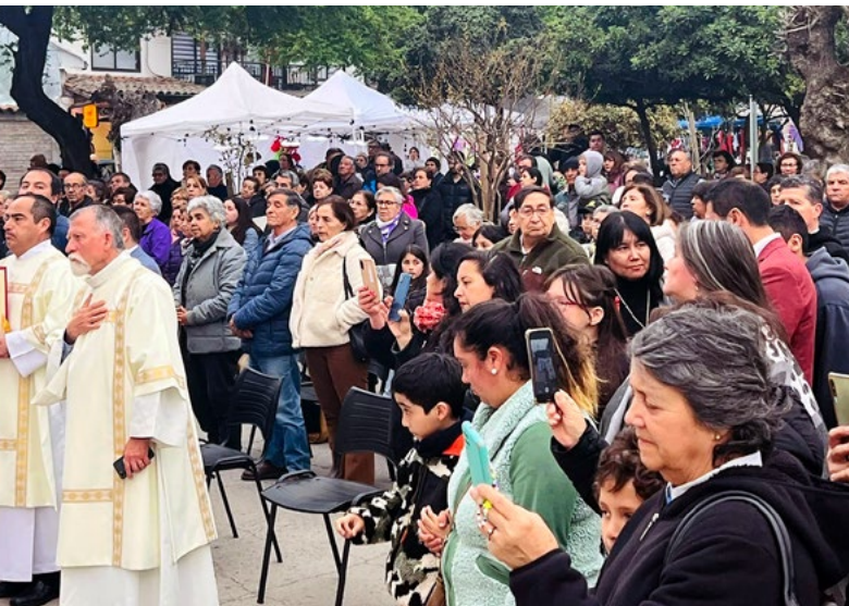
La comunidad participó con mucha alegría y fe en la ceremonia y posterior Eucaristía solemne, presidida por el obispo de Rancagua.