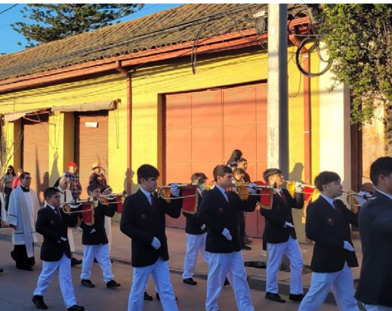
La Virgen de La Merced recorrió las calles de Chimbarongo.