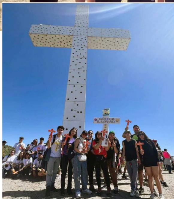
Jóvenes de la Parroquia El Sagrario llegaron hasta el Santuario de Santa Teresa de Los Andes.