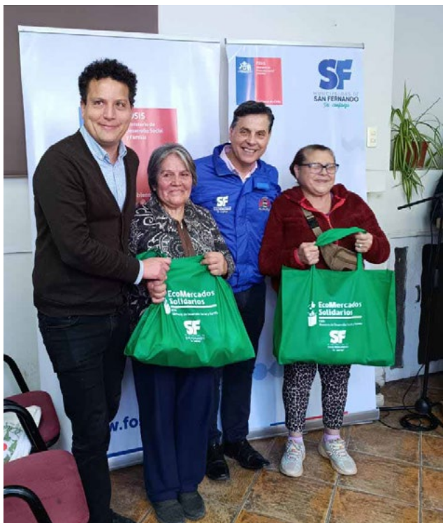
Beneficiarios recibirán entre 4 y 7 kilos de alimentos a la semana.