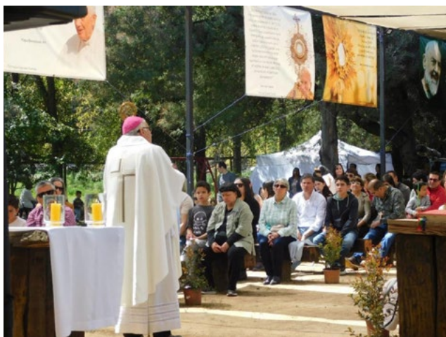
En una masiva eucaristía, celebrada por el obispo de Rancagua en los campos de la parroquia, se agradeció por esta nueva fiesta patronal de la Sagrada Familia.