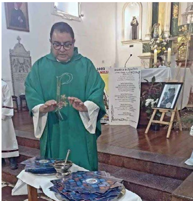
El Mes de la Familia comenzó en las parroquias con la bendición de los altares.