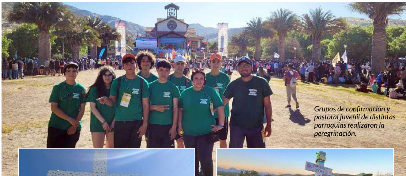
Grupos de confirmación y pastoral juvenil de distintas parroquias realizaron la peregrinación.