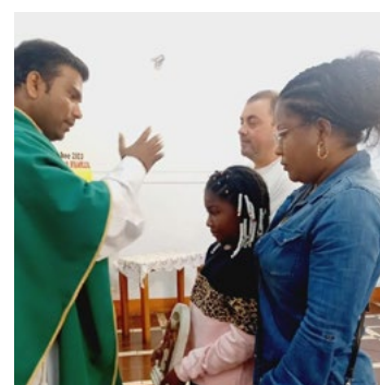
En la Parroquia Asunción de María de Quinta de Tilcoco se bendijo la imagen de la Sagrada Familia.