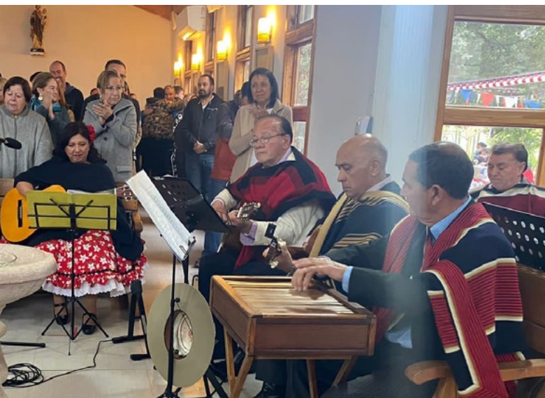
Con alegría los fieles acompañaron al coro en los cantos durante la misa a la chilena.