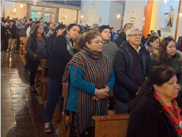
Decenas de fieles participaron en la Eucaristía donde se dio gracias a San Judas Tadeo.