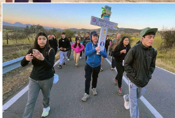
Una caminata de cerca de 28 kilómetros realizaron los peregrinos de la diócesis.