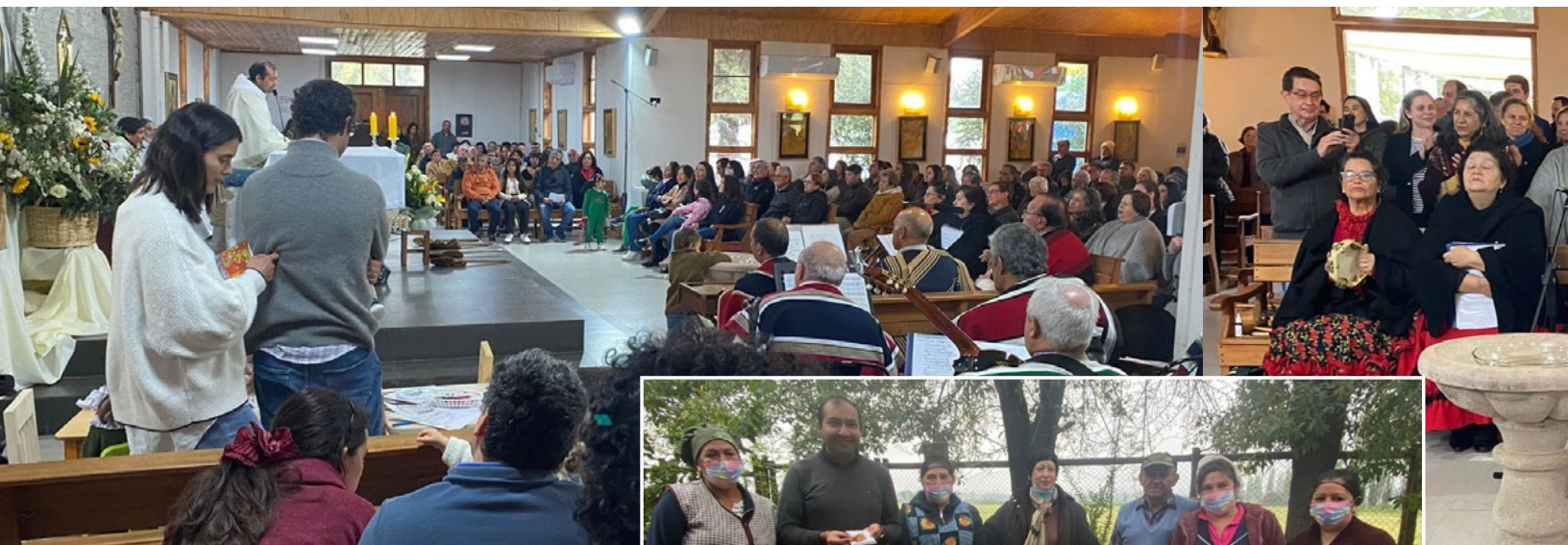
La celebración de la fiesta patronal de la Sagrada Familia comenzó con una misa a la chilena.