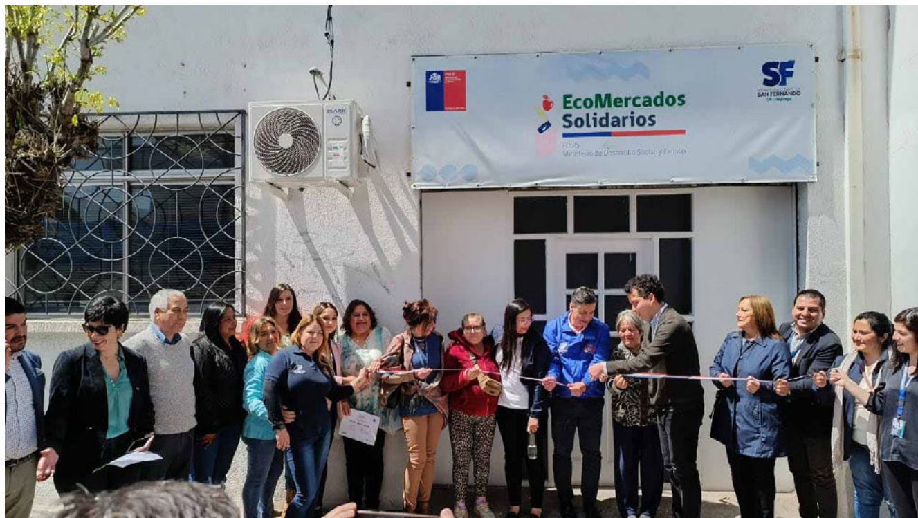
Inauguración del proyecto EcoMercado Solidario en la región de O'Higgins.