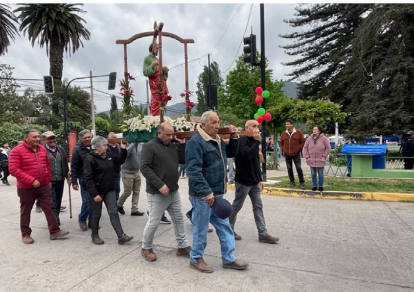
El 28 de octubre, como es tradición se realizó la procesión por las calles de Malloa.