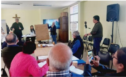
Pelequén, matrimonios e integrantes de la pastoral Familiar diocesana se reunieron en lo que fue la Segunda Jornada de Encuentro.

Un Mes de la Familia que fue vivido con alegría y mucho entusiasmo en toda la diócesis de Rancagua.