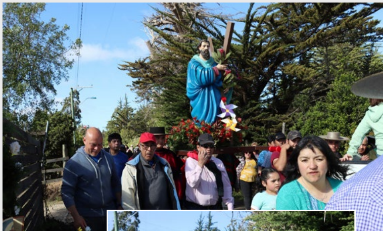
En la foto, los fieles y huasos a caballo acompañan a San Andrés desde Quebrada del Nuevo Reino, hasta Nuevo Reino.