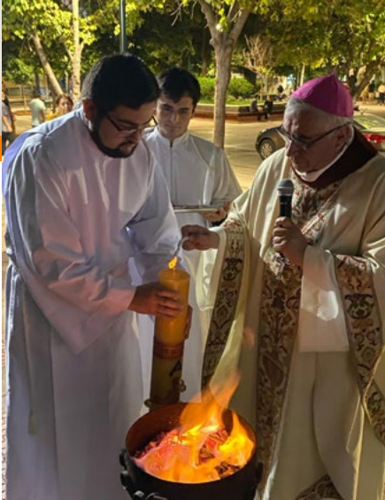
El obispo diocesano celebró la vigilia pascual en la Catedral.