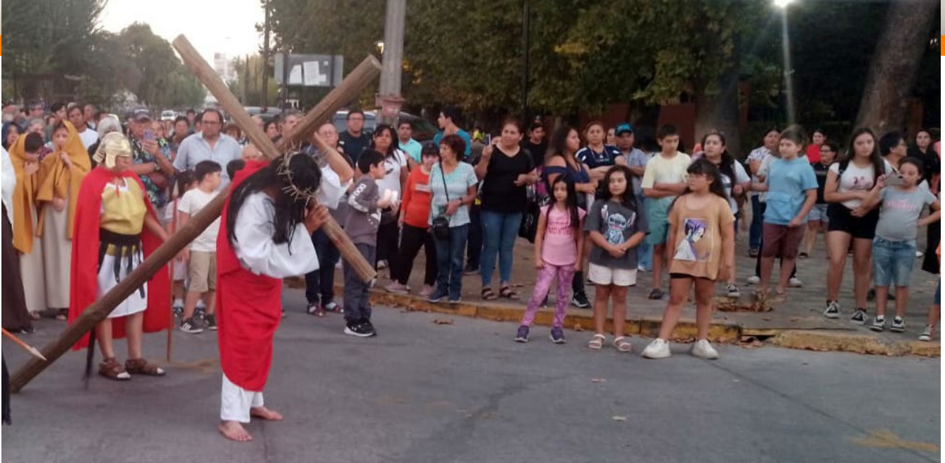
En Graneros los fieles dieron vida al Vía Crucis en la Parroquia Nuestra Señora del Carmen.