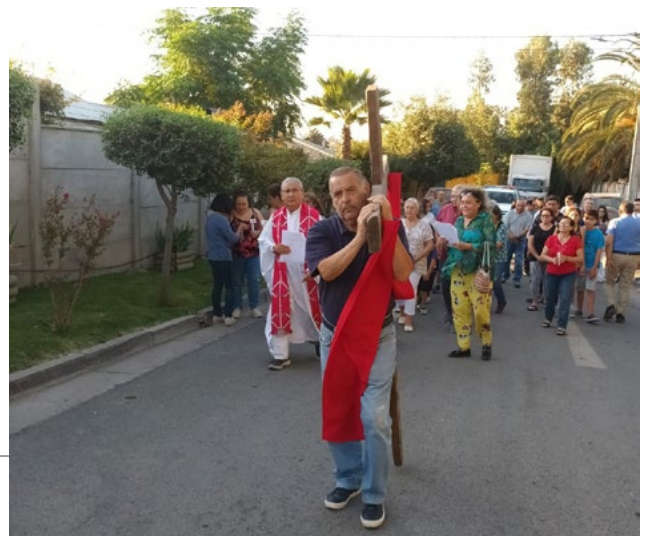
Vía Crucis por las calles de Los Lirios, con fieles de la Parroquia Jesús Crucificado.