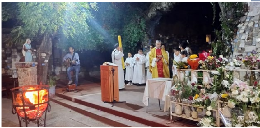
En la Parroquia Cristo de Rey de Rancagua se vivió la vigilia en la gruta.