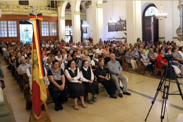
Fieles llegaron a la Catedral