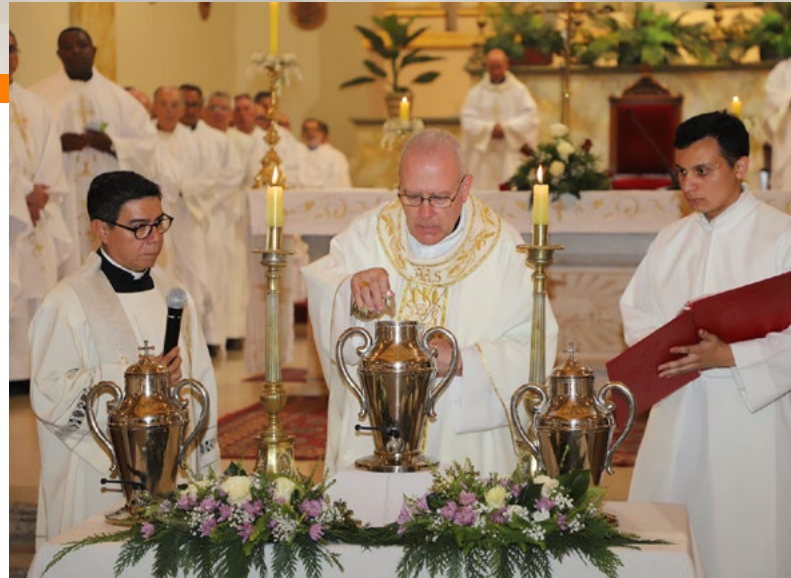
Bendición de los óleos.