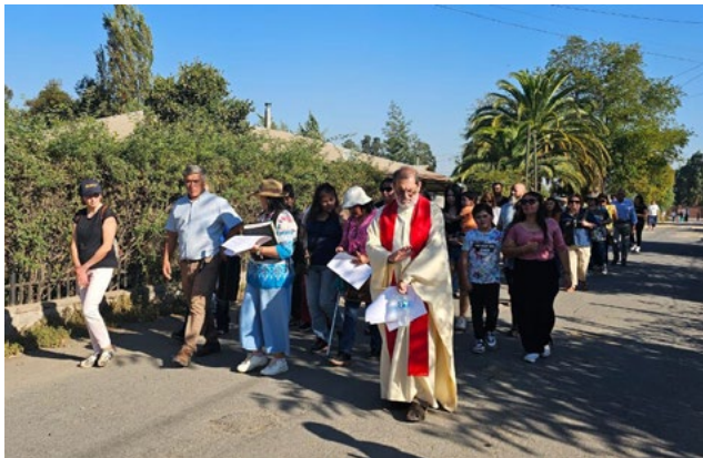
Comunidad de la Santa Cruz de Tinguiririca la comunidad participó de uno de los momentos más importantes de la fe católica.