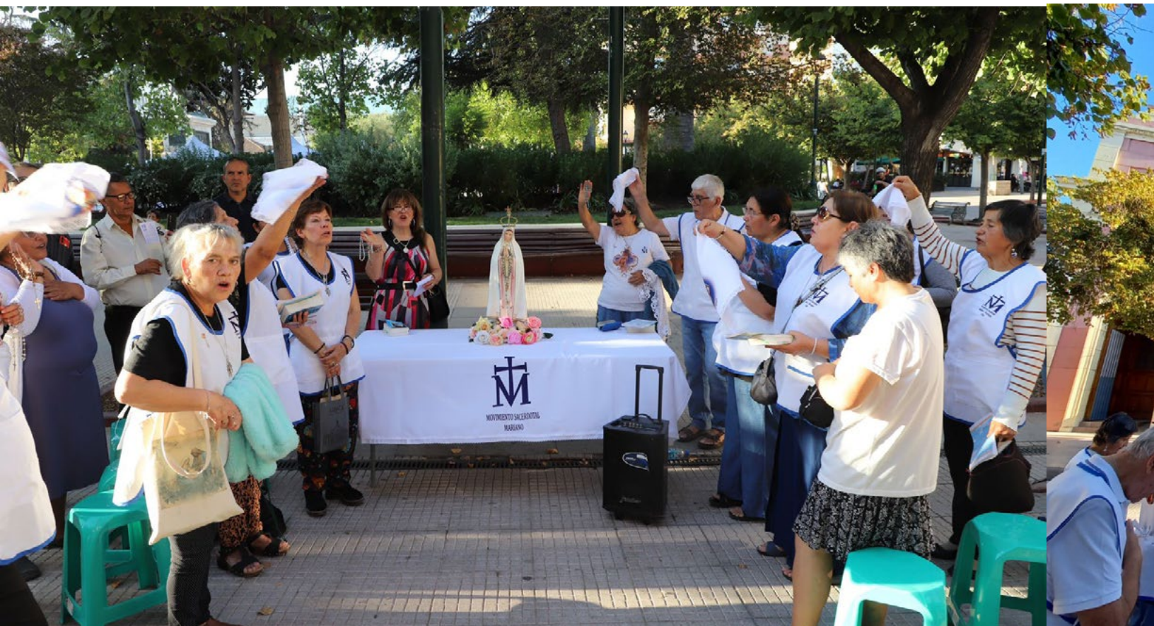
Antes de la Misa Crismal los fieles se reunieron para rezar el Rosario.