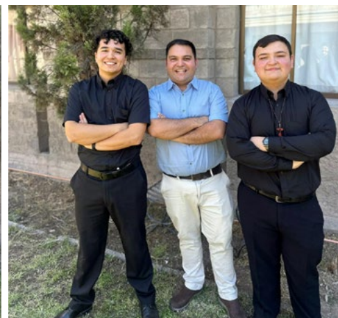
Los tres nuevos aspirantes que ingresaron a estudiar al Seminario de San Bernardo