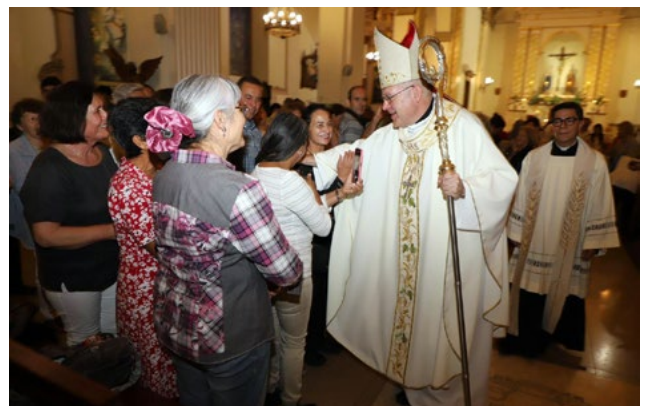
Nuncio Apostólico saludó a los presentes en la misa.

que el coro cantara “no se eligieron ustedes, fui yo quien los elegí”, se procedió a este tradicional rito en que los sacerdotes renovaron las promesas realizadas el día de su consagración.