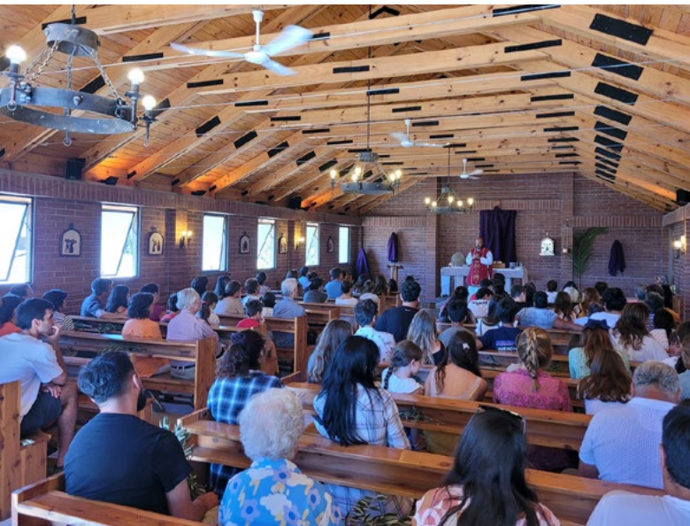
Gran participación hubo en las misas y celebraciones de la Semana Santa.