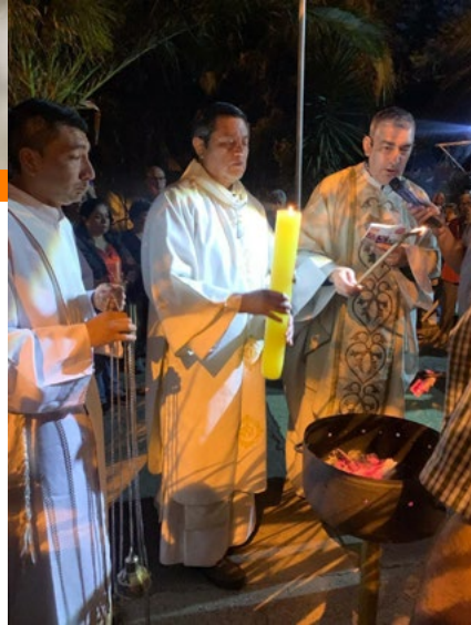
En la Parroquia San Juan Bautista de Machalí hubo mucha participación de fieles.