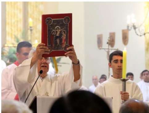
Presentación del crisma.