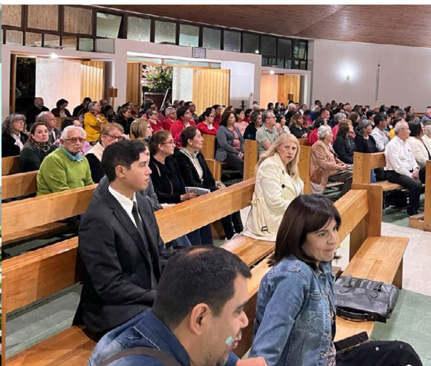
240 personas participaron del encuentro en San Vicente de Tagua Tagua.