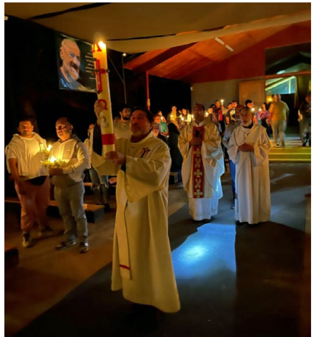
En la Parroquia Sagrada Familia de Machalí se vivió una hermosa jornada de vigilia.