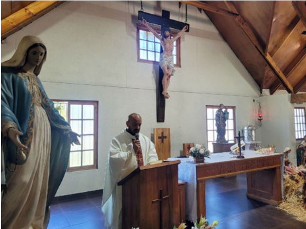
Los fieles han vuelto al templo después de la pandemia.