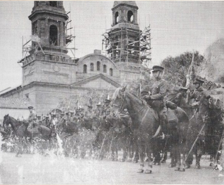
Foto de Catedral año 1937.

a la Avenida Brasil y a las cercanías de la estación de los ferrocarriles, una animación extraordinaria. Aún los no católicos o los indiferentes se acercaban, movidos por la curiosidad, al notar el despliegue de gente, de banderas, de estandartes, de caballería huasa, para saber de qué se trataba.