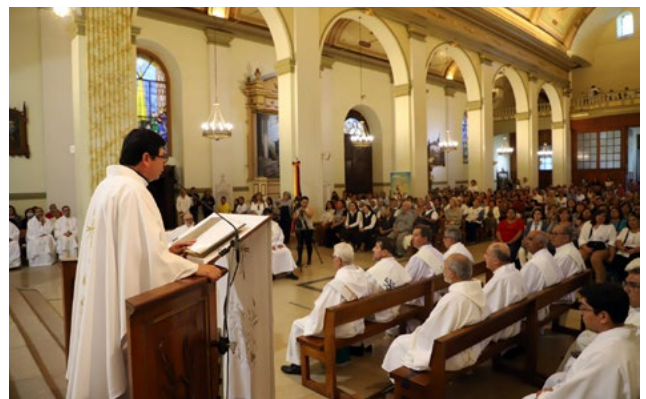
Clero diocesano llegó para participar de la Misa Crismal.