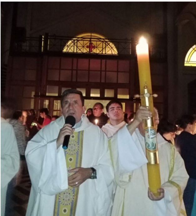
En la Parroquia Santa Ana de Rengo los fieles participaron activamente en la Vigilia Pascual.

Les dejamos un testimonio gráfico de cómo se vivió la semana más importante del año para los católicos.