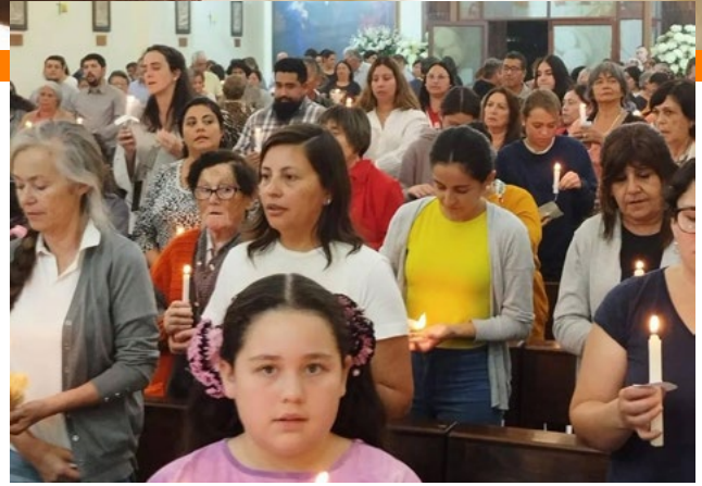
Gran participación de feligreses hubo en Pichidegua.