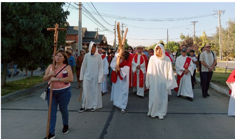
Vía Crucis. Parroquia San Nicodemo de Coínco.