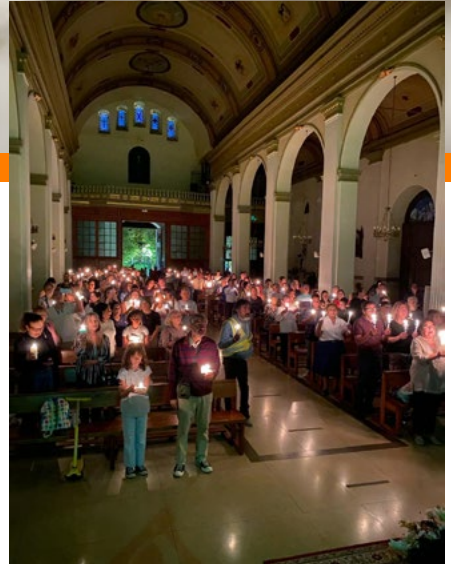
La luz del fuego representa a Cristo resucitado.