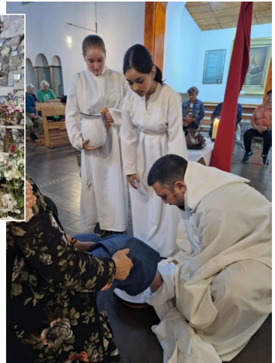
El lavado de pies en el Santuario San Judas Tadeo de Malloa.