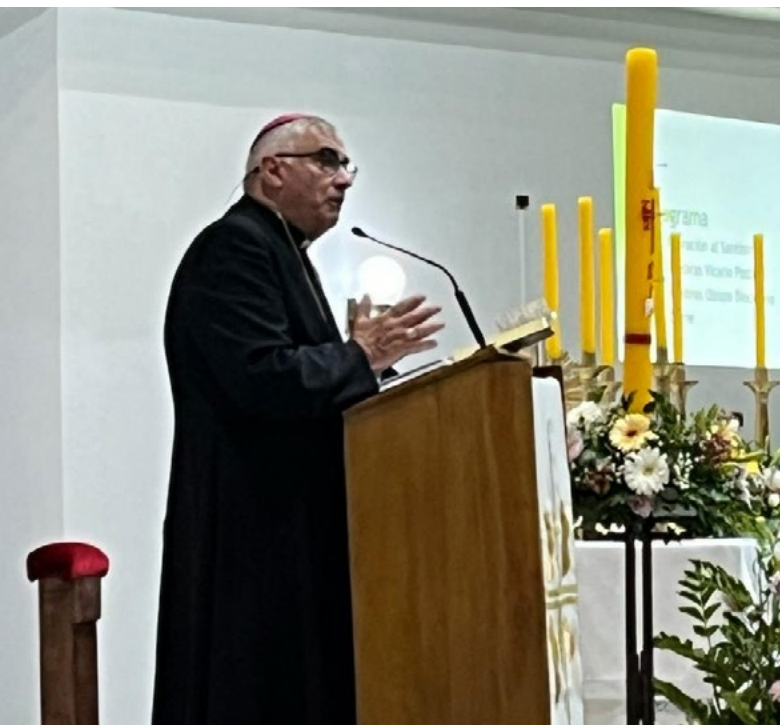
El obispo diocesano, monseñor Guillermo Vera, entregó su mensaje indicando el rumbo de la Iglesia diocesana este año.