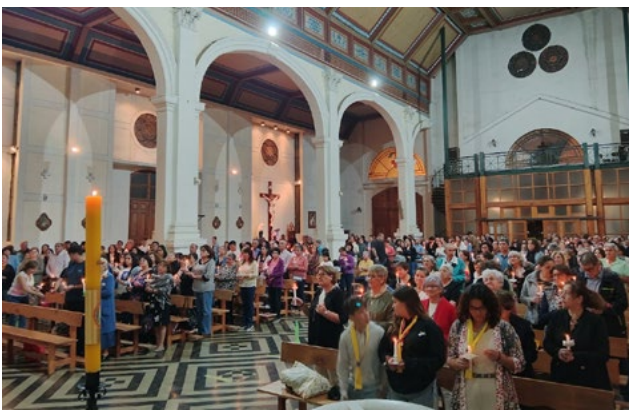
Masivas celebraciones hubo en Renego.