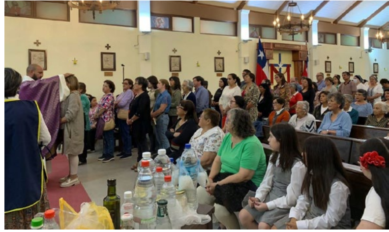
Las misas de sanación han convocado a muchos fieles.

y encomienda sus dolores y penas a Dios, es una de las características de la feligresía del sector parroquial, por ello, las misas de recordación y de sanación son muy concurridas.