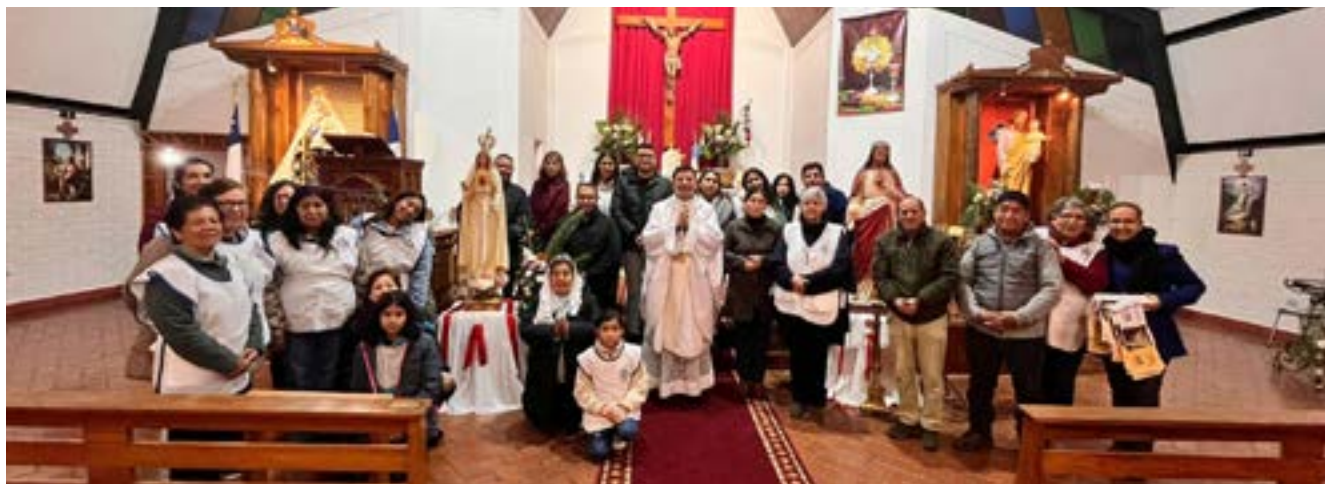
Niños y adultos participaron en la parroquia.

Parroquia Monte Carmelo en Villa Teniente: