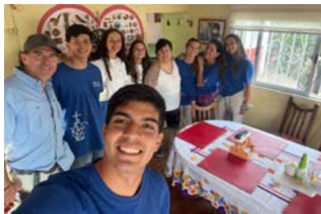
Los jóvenes misioneros evangelizando con mucha alegría y entusiasmo a los habitantes Corcolén, Sal si puedes, Cantarrana y San Pedro.

En conjunto, estas experiencias confirman que la Diócesis de Rancagua continúa consolidando una pastoral territorial, cercana y comprometida, donde la misión no es un evento aislado, sino una forma concreta de vivir el Evangelio en medio de la realidad local.