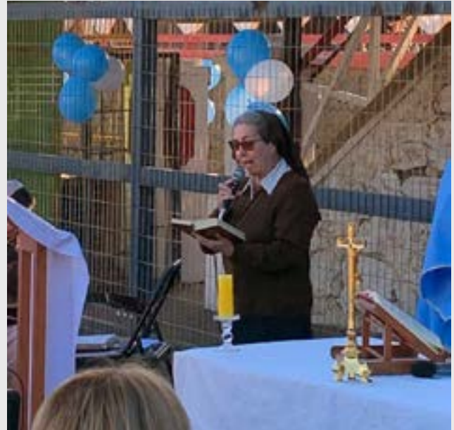
Religiosas que misionaron en Pichilemu.