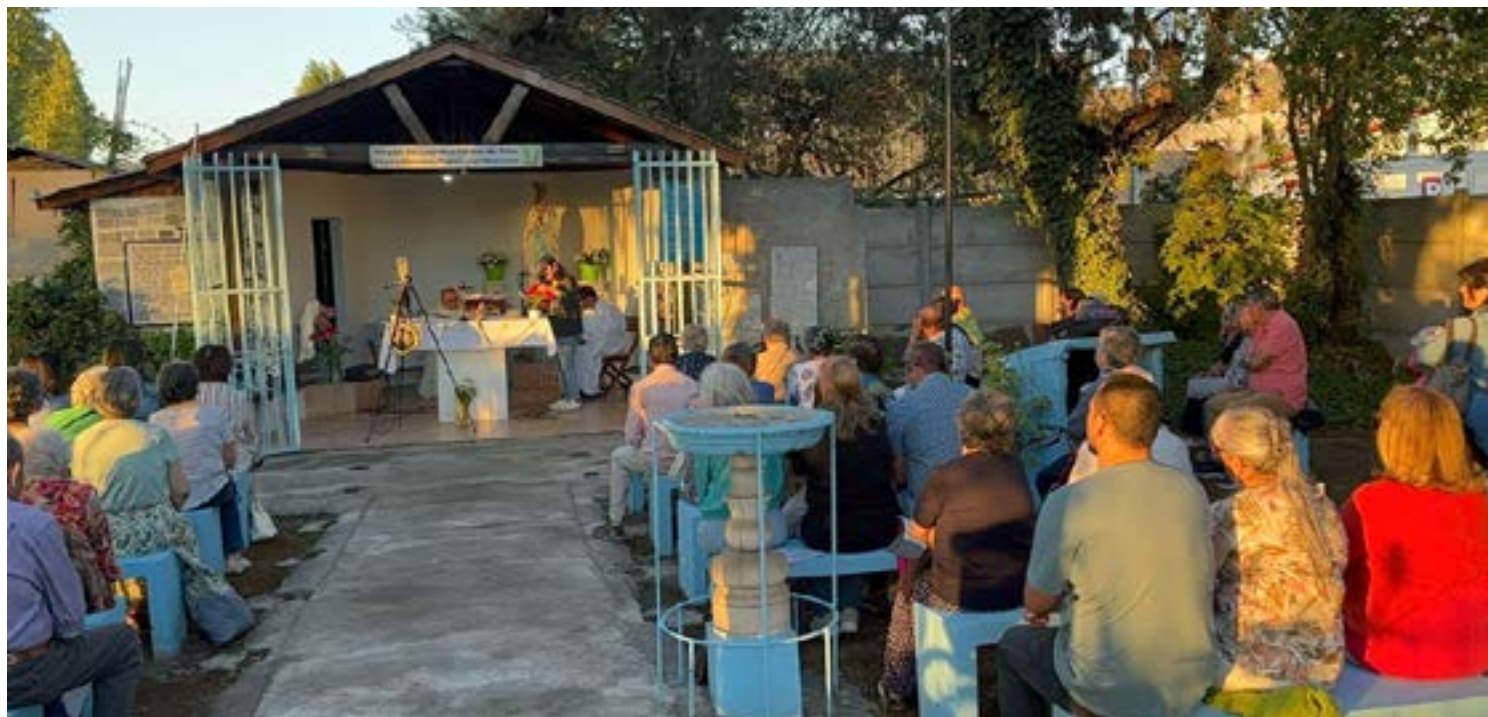
En la Parroquia San Juan Evangelista de San Vicente de Tagua Tagua, la celebración se realizó en la ermita de Pueblo de Indios.