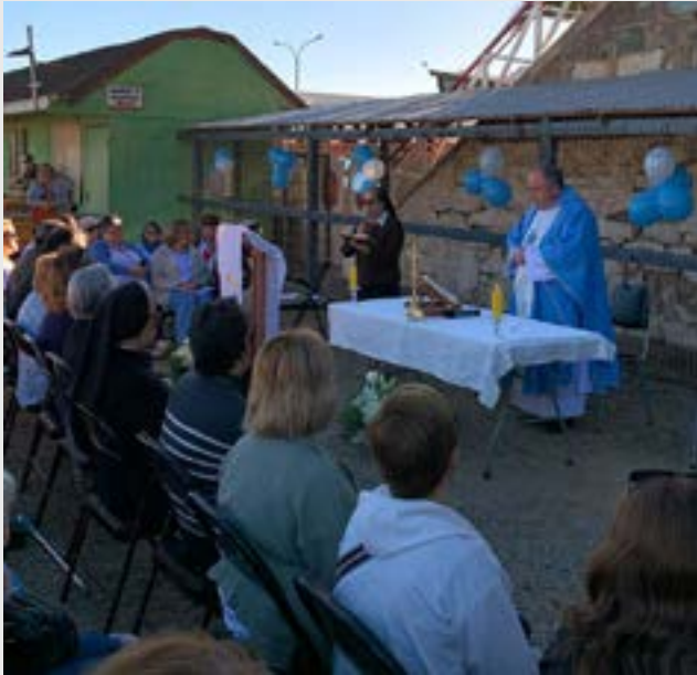
Misioneras participando en la celebración de la solemnidad de la Virgen de Lourdes en Pichilemu