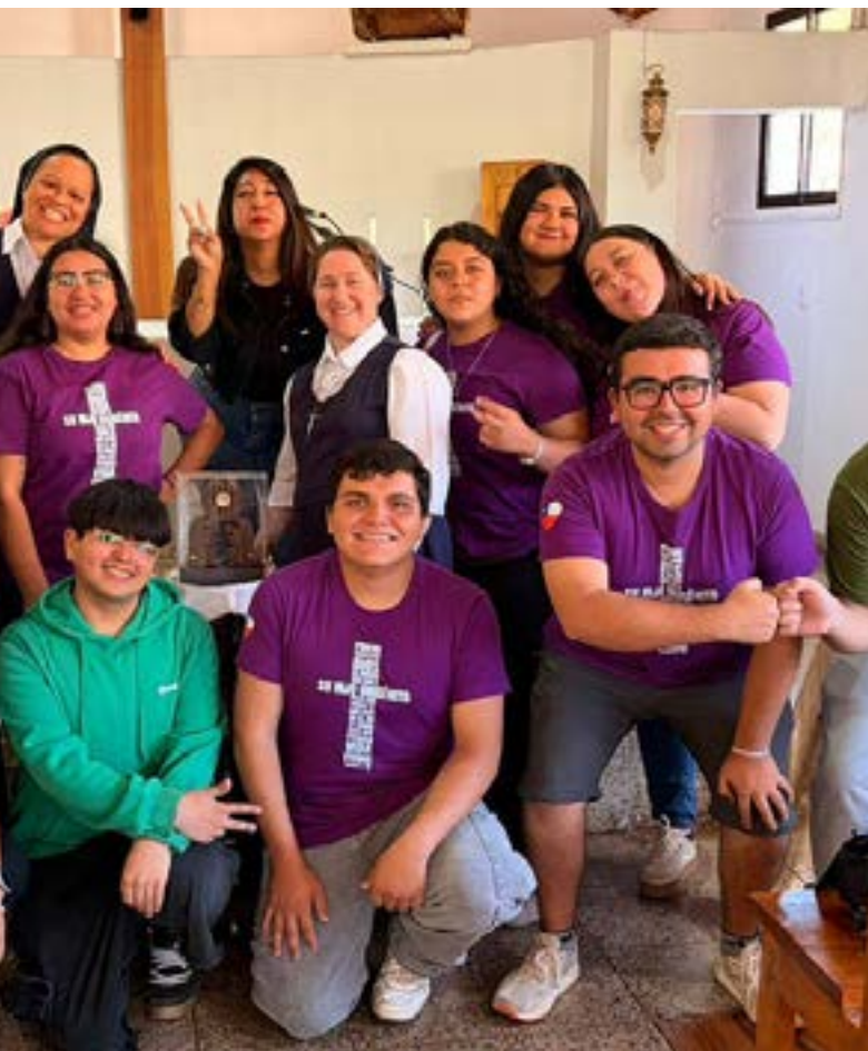
Los jóvenes acompañaron a las religiosas en su misión por los hogares de Lo Miranda.

al grupo de ayuda fraterna. La misión comenzó con la celebración de la Santa Misa por el día de Nuestra Señora de Lourdes y el cierre de la novena en la capilla dedicada a la Virgen.