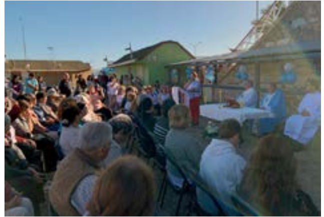
En Pichilemu celebraron a la Virgen de Lourdes con misioneras del Carmelo Misionero Seglar.