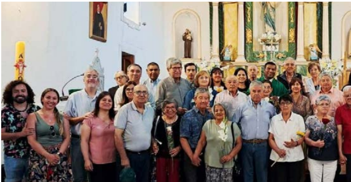
Una de las primeras actividades del año fue celebrar el Día del Sacramento del Matrimonio, el 15 de febrero. En ese marco, 25 parejas participaron en una eucaristía de renovación de votos matrimoniales y bendición especial en la Parroquia Asunción de María de Quinta de Tilcoco.