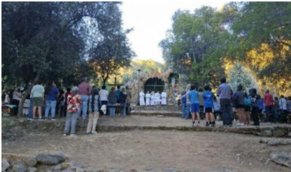
La comunidad de Peumo celebró en la gruta del fundo Concha y Toro de la ciudad.