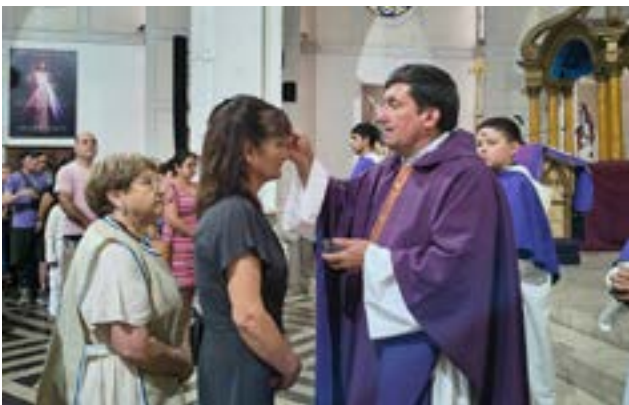
La basílica Santa Ana de Rengo estaba repleta de feligreses.