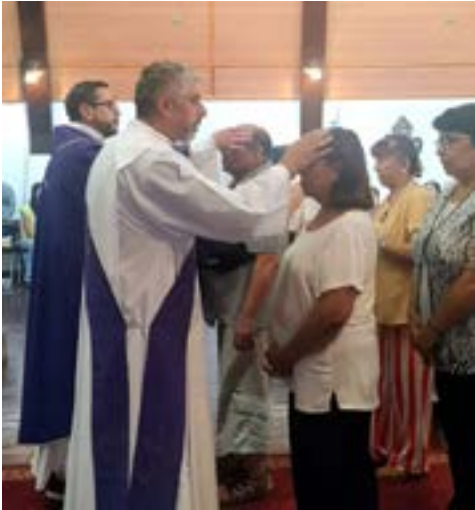
La marca de la cruz con cenizas en la frente fue un distintivo de los cristianos que participaron de las misas en todo el mundo. En la foto, la P. San Agustín de Rancagua.