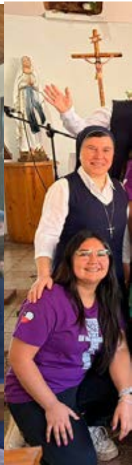
La hermana celebrando sus 25 años de vida consagrada en Lo Miranda.