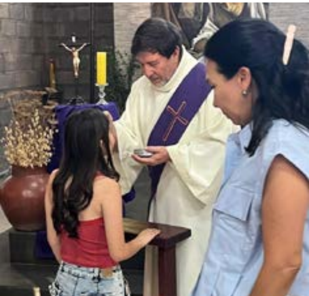
En la Parroquia Sagrada familia de Nogales hubo gran presencia de fieles.