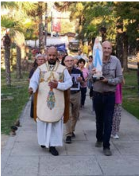
Fieles de la parroquia San José de El Manzano celebraron solemnemente a la Virgen de Lourdes.