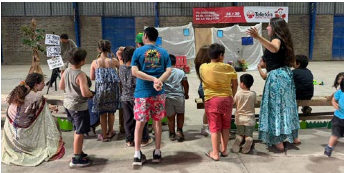
Los más de 120 misioneros del Santuario Los Pinos de Viña del Mar llevaron la palabra a distintas familias. Acá compartiendo con los niños de la comunidad.