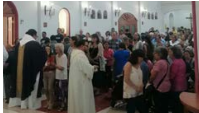
P. Cristo Rey realizó la misa en la tarde.