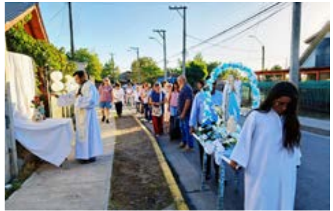
En la Parroquia Asunción de María de Quinta de Tilcoco celebraron a nuestra madre con una procesión y posterior misa, con gran participación de la comunidad.