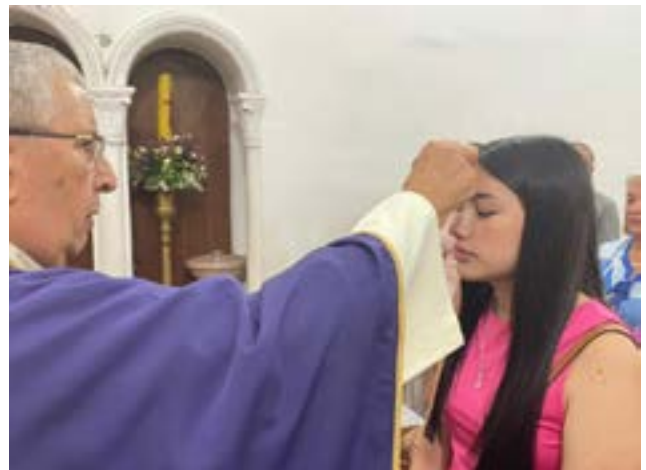
Niños, jóvenes y adultos llegaron hasta el templo de Los Lirios.