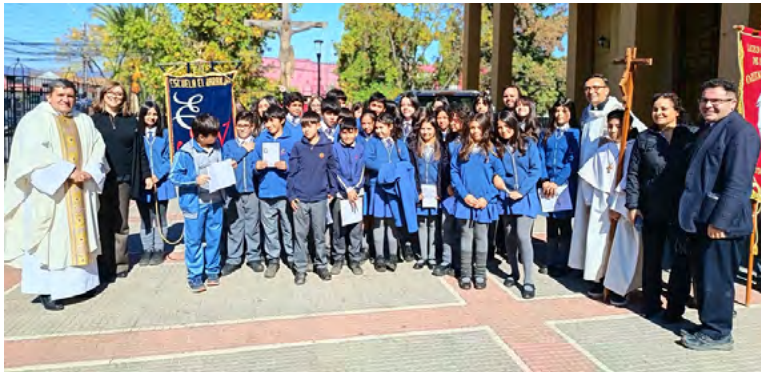
Delegaciones escolares estuvieron presentes en la misa