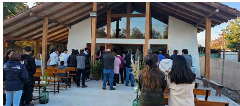
La comunidad se dio cita en la nueva capilla

La celebración culminó con un fraterno y muy agradable compartir, instancia que permitió fortalecer los lazos de unidad y agradecer a todos quienes hicieron posible este sueño que hoy se convierte en realidad para la comunidad católica de Quicharco.