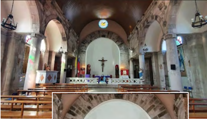
Interior de la Parroquia, que fue fundada en 1967.