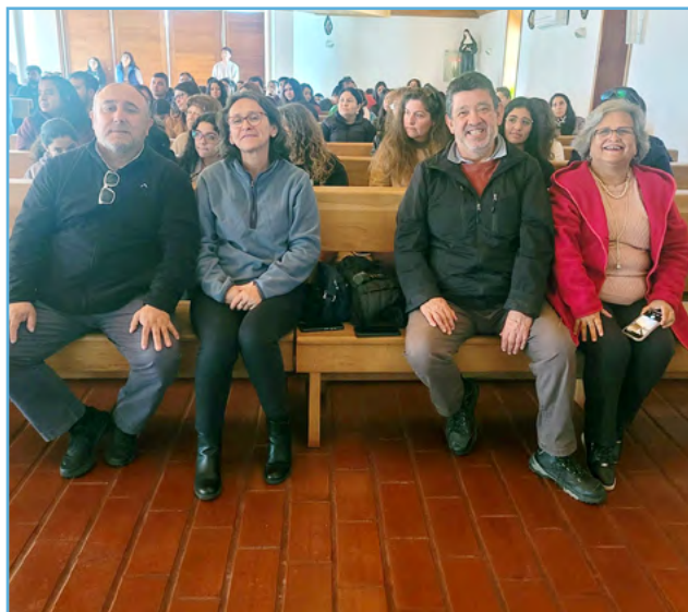
En Las Cabras se dieron cita los miembros de pastoral familiar.