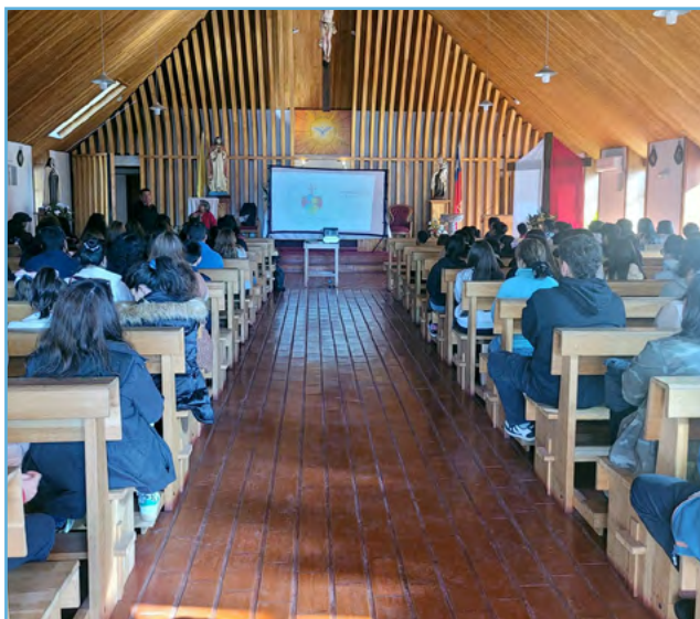
Gran participación de entusiasmo en este encuentro.

La comunidad parroquial respondió con entusiasmo a la iniciativa, generando un ambiente de escucha, participación y compromiso. Este tipo de encuentros permite renovar el sentido de pertenencia eclesial y asumir con mayor claridad la responsabilidad en la educación de la fe.