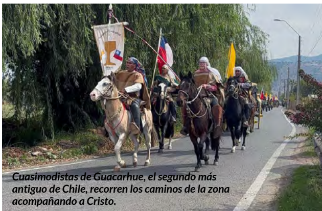
Cuasimodistas de Guacarhue, el segundo más antiguo de Chile, recorren los caminos de la zona acompañando a Cristo.

de recogimiento, de oración compartida y de profunda espiritualidad, donde la Iglesia se hace cercana y concreta.