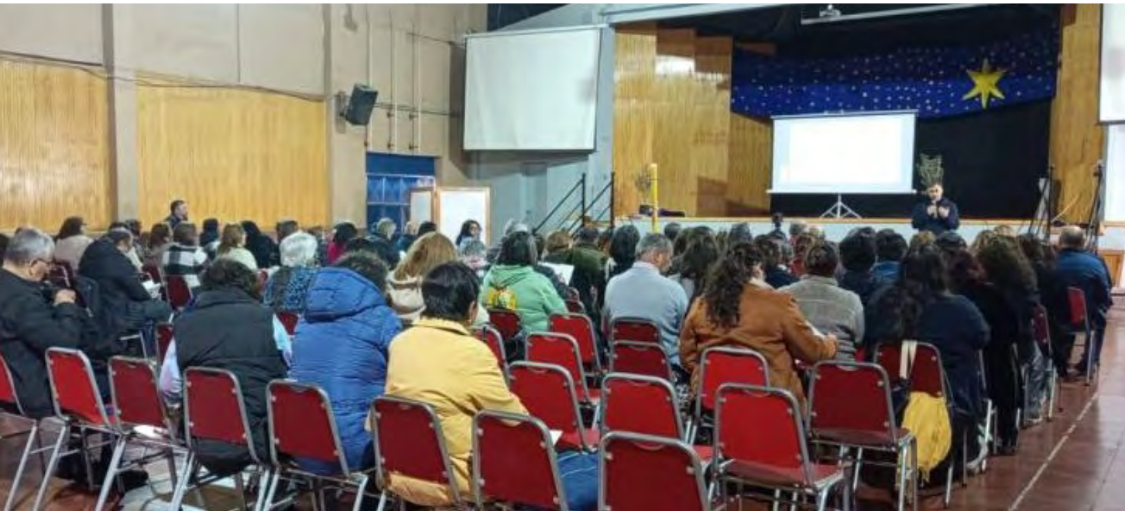
Agentes pastorales del Decanato Santa Rosa participando en la capacitación para formadores de discernimiento sinodal.