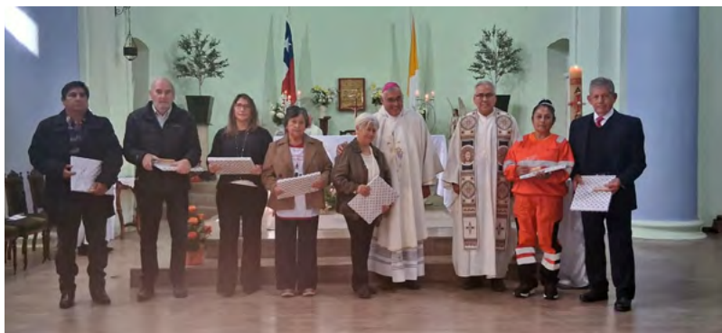
Trabajadores premiados en la misa.