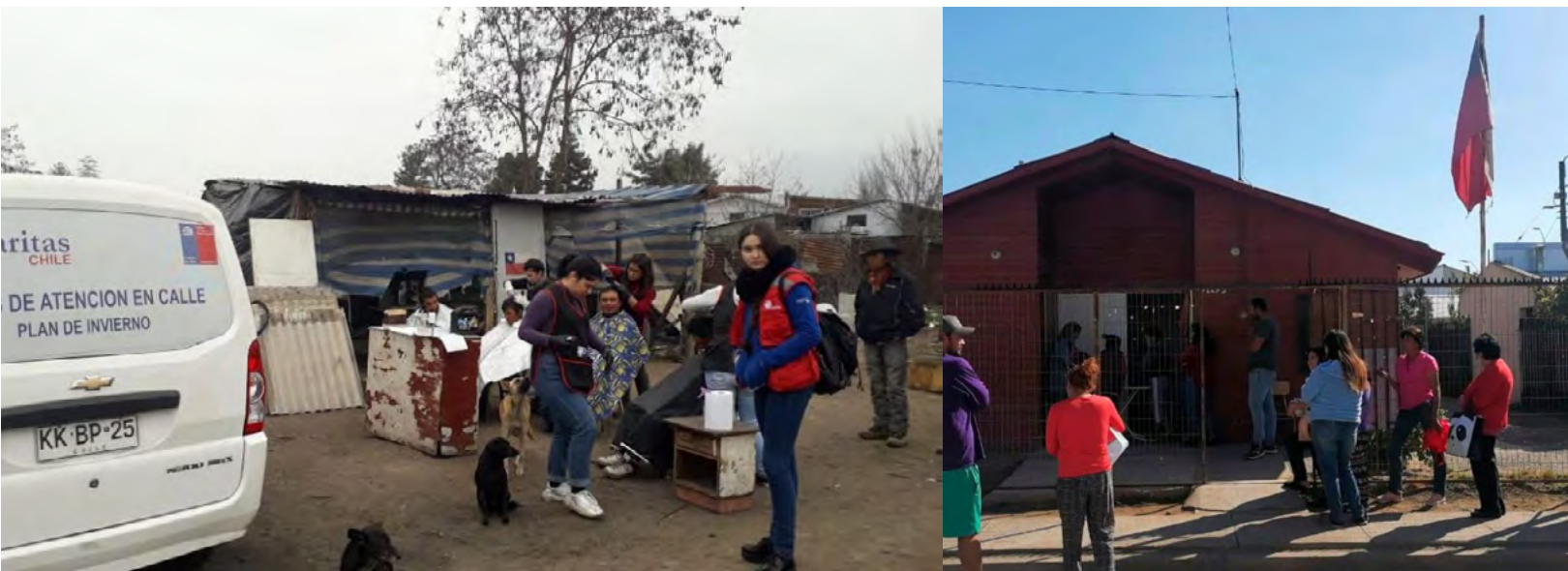
Una vez más Caritas ejecutará los programas de invierno.

años de funcionamiento y que ha sido extendido hasta mayo de 2027. Esta iniciativa está dirigida especialmente a personas en situación de calle mayores de 50 años, entregando alimentación diaria y acompañamiento en jornadas de mañana y noche, en la misma vía pública.