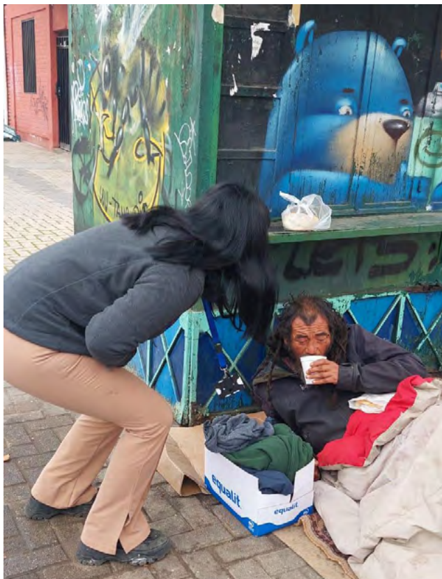
La ruta calle es uno de los programas. (foto archivo).

El secretario ejecutivo de Caritas destacó la existencia de otros dispositivos solidarios que complementan el Plan Invierno. Ese es el caso de la Ruta Protege, programa que ya cumple tres