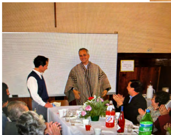
El Santo Padre, León XIV; cuando visitó la parroquia en 2003 como superior de la orden de los Agustinos.