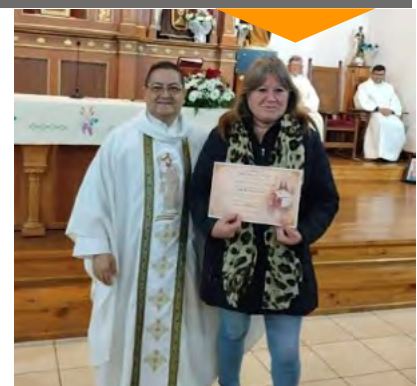
Feligreses fueron reconocidos por su trabajo.