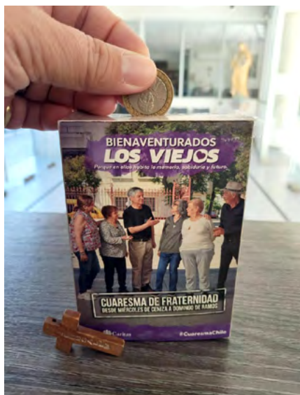
Gracias a los aportes al alcancía de Cuaresma, se han podido desarrollar distintas actividades en apoyo de los adultos mayores.

El sacerdote explicó que este proceso formativo, que se extiende por cerca de seis meses, no solo permite desarrollar una labor solidaria, sino que también abre oportunidades laborales para