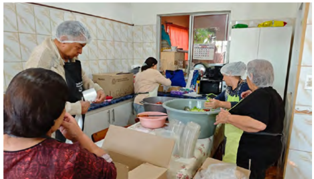
Fieles de la parroquia trabajando en el comedor solidario que cada viernes atiende a los más necesitados.