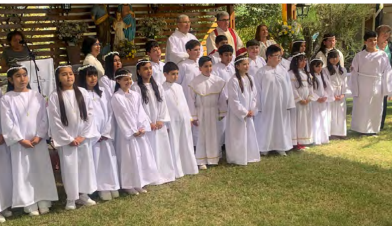
Las primeras comuniones en 2024 fueron 4.640 y en 2025 subieron levemente a 4.680.

En otro orden de cosas, la matrícula de los colegios de inspiración católica o de congregaciones que están bajo el alero de la Vicaría de Educación nos muestran un constante avance. En efecto, en 2024 hubo un total de 23.444 alumnos, los que subieron en 2025 a 23.567 alumnos. Los de la etapa prebásica subieron de 2.463 a 2.501. Los de la etapa básica bajaron de 13.820 a 13.703. Y los de enseñanza media subieron de 7.161 en 2024 a 7.363 alumnos en 2025. Los colegios con mayor