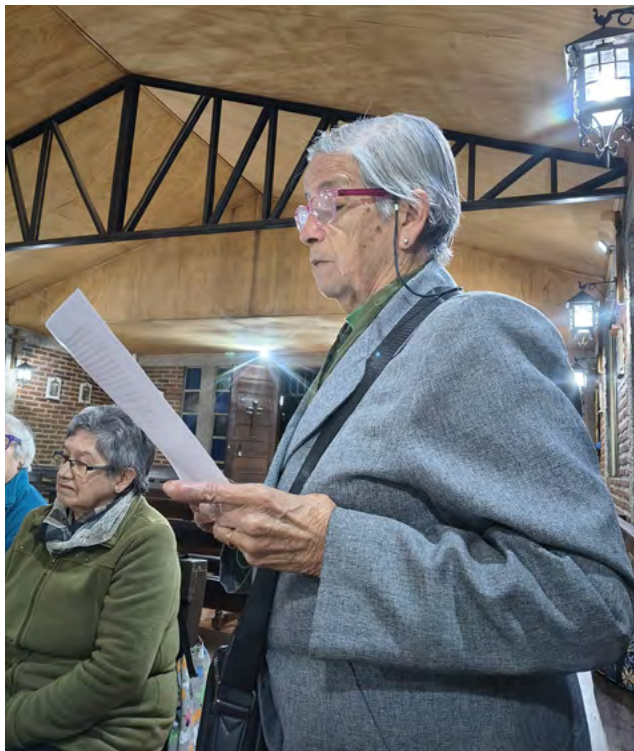
El total de católicos estimados en 2025 es de 731.352

cantidad de matrícula son el Instituto O'Higgins de Rancagua (con 2.161 alumnos), el Liceo San José de Requínoa (con 1.796 alumnos) y el Instituto IRFE de Santa Cruz (con 1.695 alumnos). El año 2004, primer año en que la Vicaría Pastoral tiene registro de esa información, los alumnos en total fueron 15.118 alumnos, lo que revela un aumento constante y de manera regular. Hay que destacar igualmente la gran cantidad de personas que se ven incorporadas a este ámbito de influencia, si consideramos a sus padres y al menos un hermano, que son cerca de 100.000 personas.