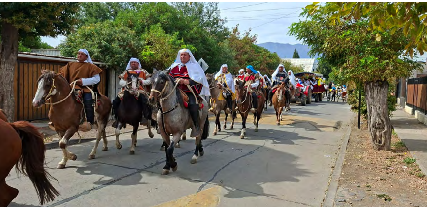
En Mostazal, los jinetes acompañaron a los sacerdotes franciscanos de la parroquia San Francisco de Asís, a llevar la sagrada comunión por la comuna.