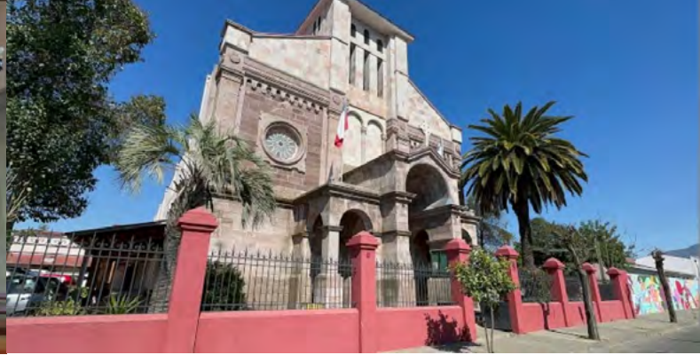
Frontis del templo El actual templo es de piedra, en estilo románico y fue construido entre 1909 y 1912.