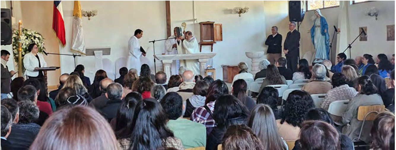
El obispo de Rancagua bendijo este nuevo templo