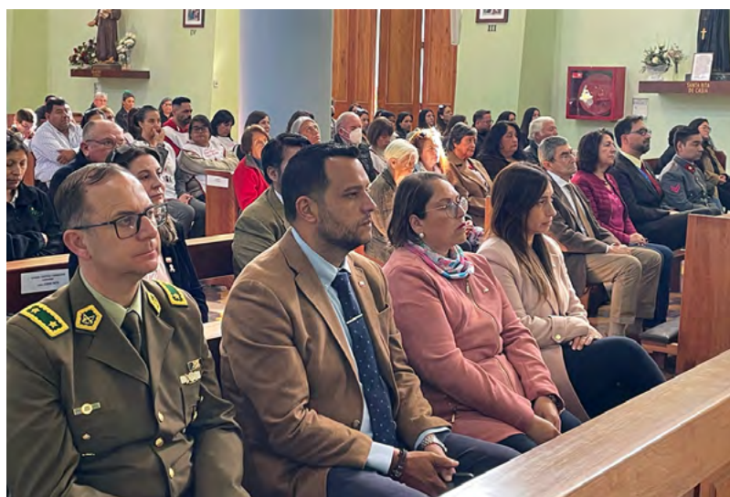
Autoridades presentes en la Eucaristía.