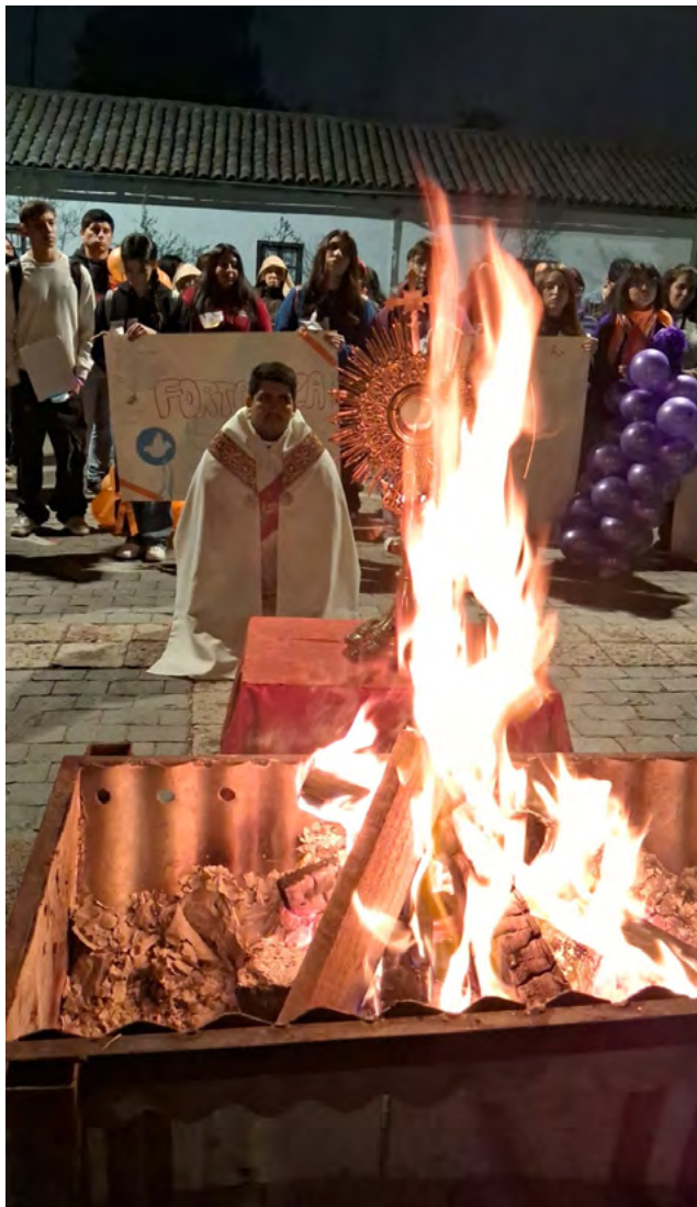
Celebración de Pentecostés del año pasado, congregó a gran cantidad de jóvenes.