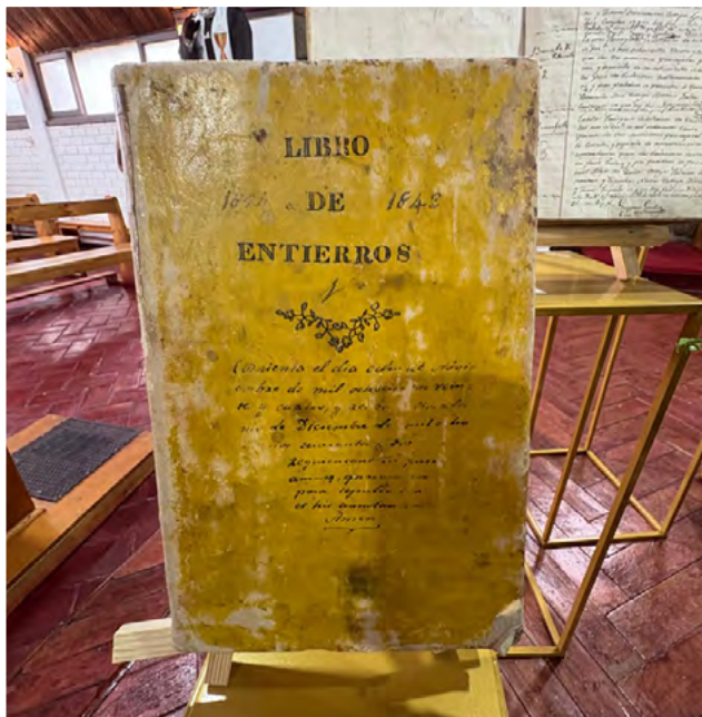
Coltauco la celebración unió fe y tradición mediante una Eucaristía a la chilena, muestras documentales y presentaciones folclóricas en el atrio del templo. Especial interés despertaron los antiguos registros de bautismos, matrimonios y sepultaciones conservados desde 1824.