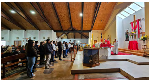
Parroquia La Santa Cruz de Tinguiririca

La celebración también tuvo un momento especial con la gran fiesta organizada por la Renovación Carismática Católica en la parroquia San Juan Evangelista de San Vicente de Tagua Tagua. Durante toda la jornada, fieles provenientes de distintas comunidades participaron en instancias de alabanza, predicación, oración y sanación espiritual.