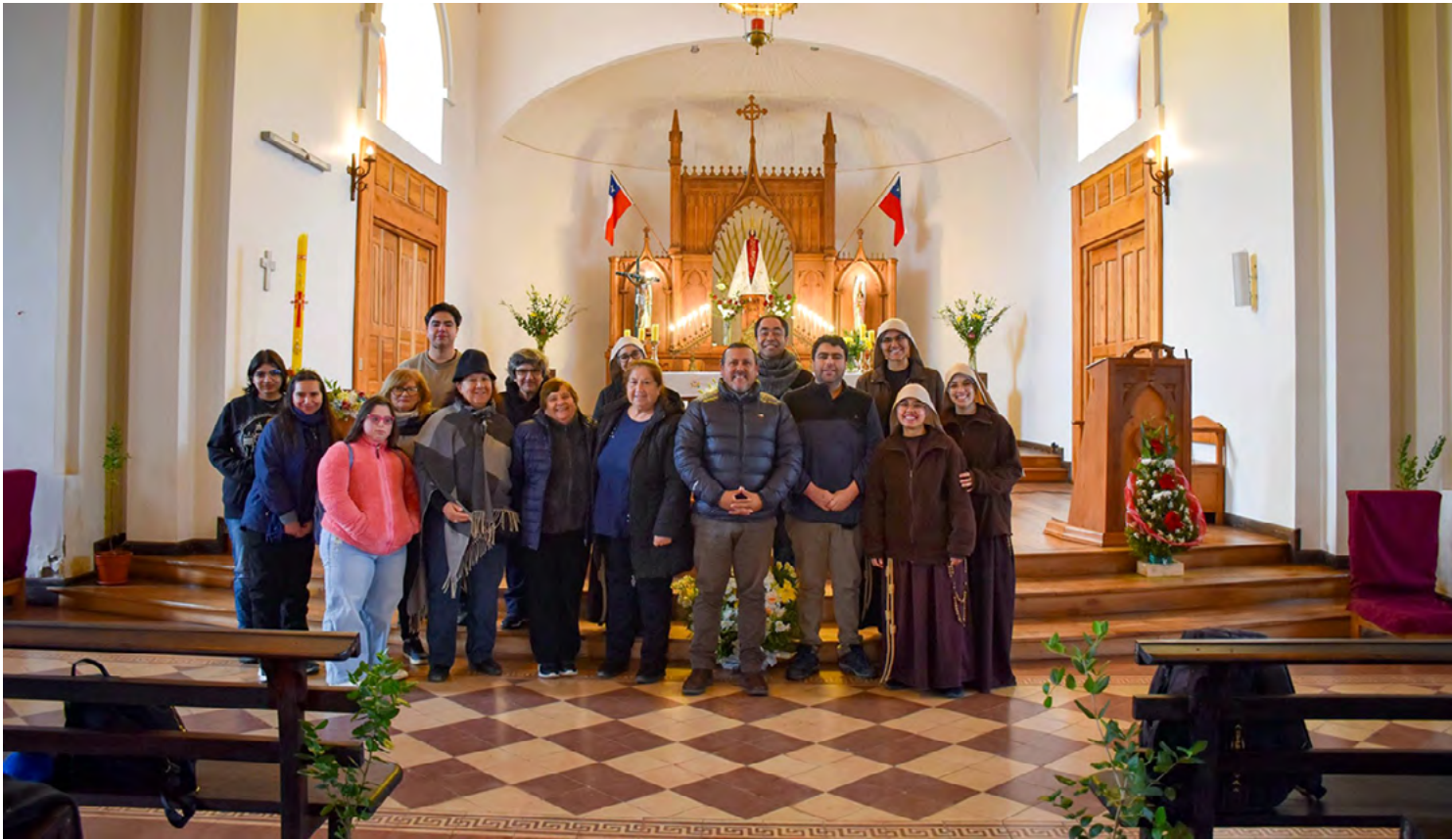
Grupos de visitantes llegaron hasta la Iglesia Nuestra Señora de las Nieves de Paredones donde fueron recibidos por las religiosas.