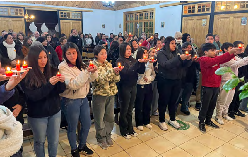
P. Jesún Buen Pastor de Santa Cruz