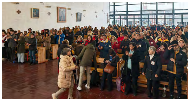
P. San Vicente de Tagua Tagua