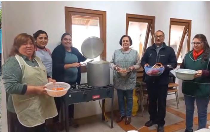
La Olla de San Antonio es una de las tradiciones solidarias.