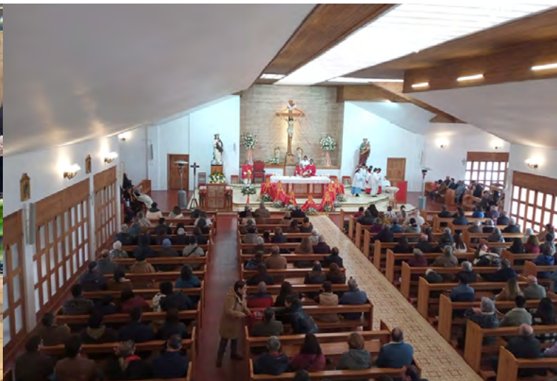
Parroquia de Pichilemu