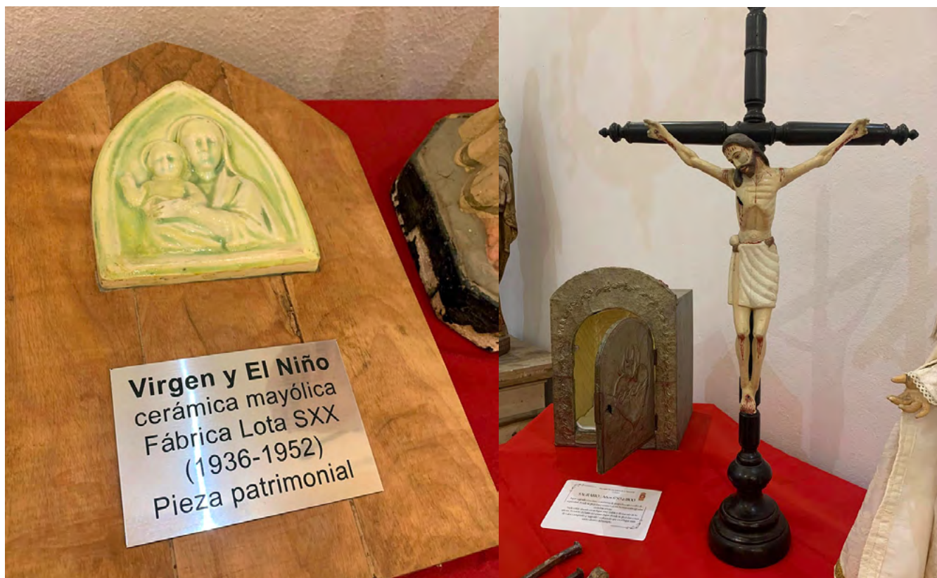
En la Parroquia Nuestra Señora de la Merced de Codegua, la histórica Capilla La Punta abrió sus puertas para exhibir reliquias, ornamentos, libros y diversos objetos que forman parte de más de dos siglos de historia eclesial. La jornada contó con la participación de jóvenes de catequesis de Primera Comunión y Confirmación, además de visitantes provenientes de Santiago que llegaron atraídos por el valor patrimonial del lugar. La comunidad destacó con orgullo los más de 200 años de vida de la parroquia, fundada en 1824.