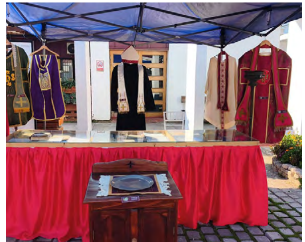
Una exposición de vestiduras litúrgicas y otros objetos históricos se pudo ver en Las Cabras.