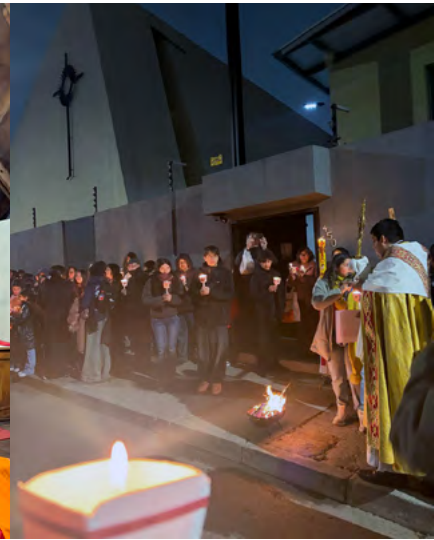
Encuentro de Pastoral Juvenil en Rancagua

Ni el frío detuvo la alegría de Pentecostés: