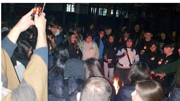
En el Santuario de San Expedito de Rosario