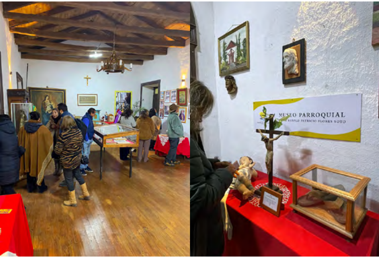
En Pichidegua, la comunidad abrió las puertas del Museo Parroquial Padre Ronald Flores Soto, permitiendo a los visitantes conocer piezas religiosas, antiguas vestimentas litúrgicas, fotografías y objetos históricos vinculados a la vida de la parroquia. El recorrido incluyó además la historia de la Iglesia de La Torina, considerada uno de los tesoros patrimoniales de la zona y vinculada al legado arquitectónico de Joaquín Toesca.