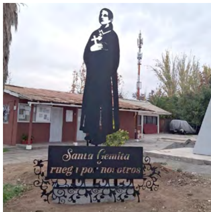
La imagen de Santa Gemita fue ubicada en la entrada del templo.