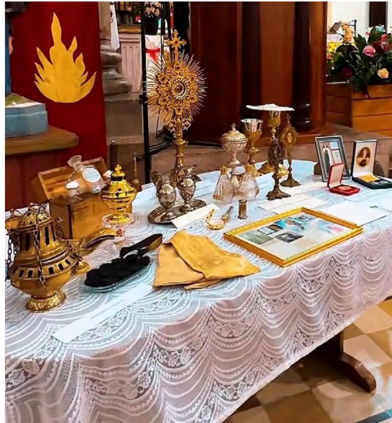
En la parroquia San Fernando Rey de San Fernando se unieron a la celebración patrimonial, bajo el lema "282 años de fe"