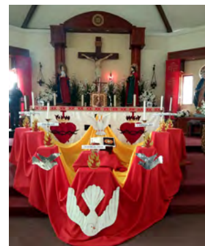
Parroquia de Pichidegua