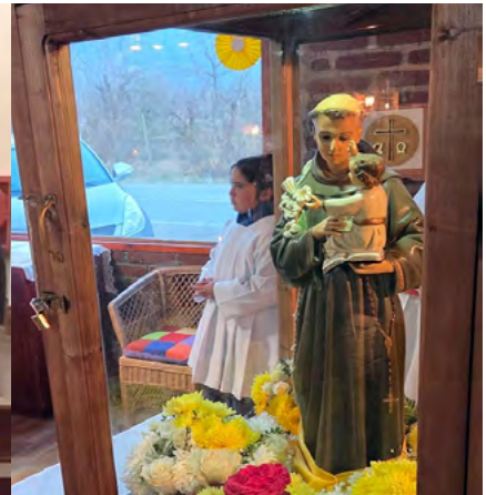
Imagen de san Antonio recorre las 17 comunidades.

bien uno de los desafíos pastorales es lograr una mayor continuidad después de la recepción de los sacramentos, la parroquia ha impulsado nuevas iniciativas para fortalecer el sentido de pertenencia. Una de ellas fue reunir en el templo parroquial las celebraciones de primeras comuniones y confirmaciones de todas las comunidades. La experiencia resultó altamente positiva y permitió que el templo se llenara de familias, catequistas y agentes pastorales, reforzando la identidad de una sola comunidad parroquial.