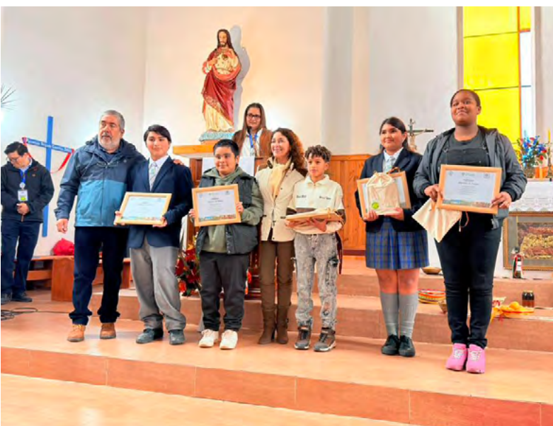
En el contexto del día del patrimonio la parroquia homenajéo a miembros de la comunidad.

Desde la parroquia señalaron que estas actividades buscan honrar al Sagrado Corazón de Jesús, pero también fortalecer los lazos de fraternidad entre quienes forman parte de la comunidad parroquial.