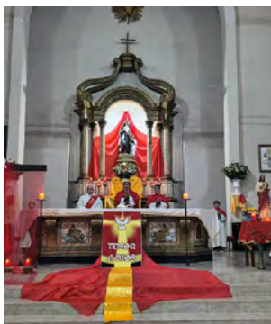
Basilica Santa Ana de Rengo

Las celebraciones recordaron además los siete dones del Espíritu Santo: sabiduría, entendimiento, consejo, fortaleza, ciencia, piedad y temor de Dios. Un mensaje que resonó con fuerza en una diócesis que, pese al frío, volvió a demostrar que la fe, la esperanza y el encuentro fraterno siguen encendiendo el corazón de sus comunidades.