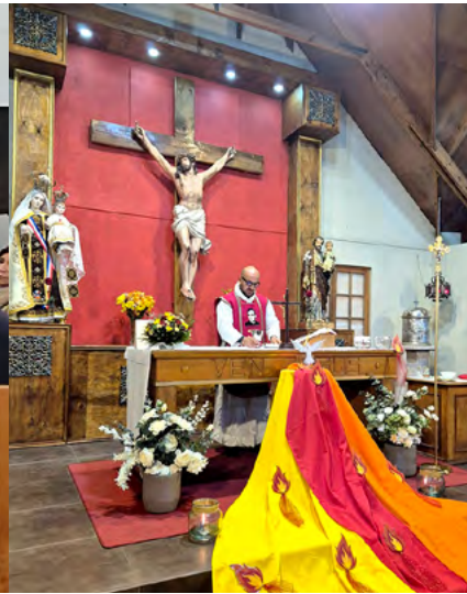
Parroquia San José de El Manzano