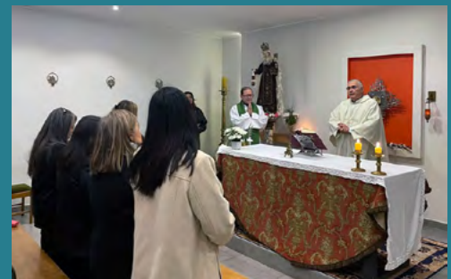
La misa de aniversario se realizó el 29 de mayo en la capilla del obispado.