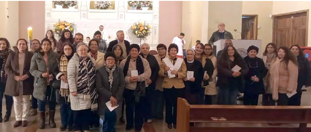
Gracias a la labor de los catequistas la parroquia tiene una intensa vida sacramental.