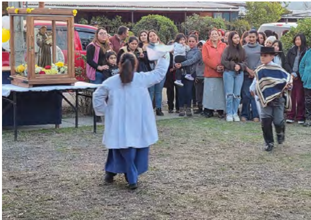
Niños, Apoderados y Personal de Escuela Las Alamedas participan en la bienvenida del Santo Patrono al sector.