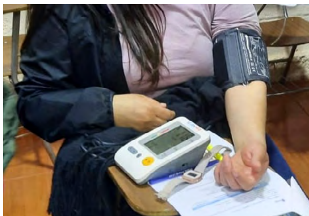
La capacitación se financia con fondos de la campaña de Cuaresma de Fraternidad