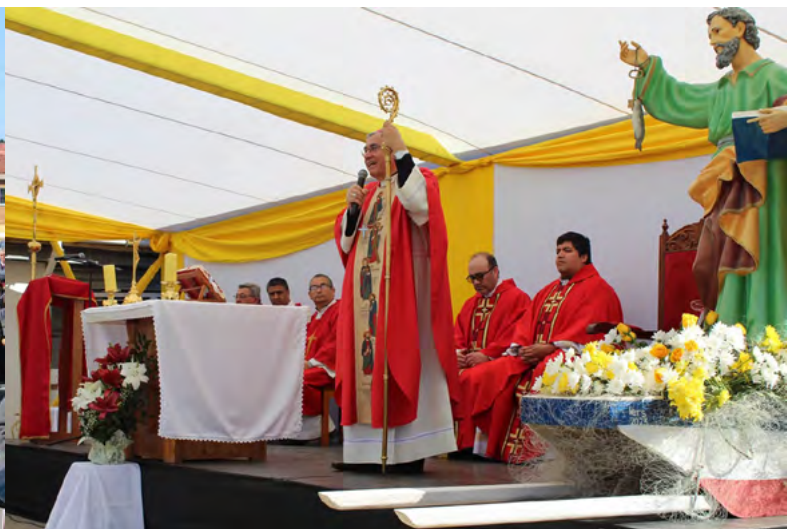
Obispo Guillermo Vera presidió la misa en la caleta de pescadores de Pichilemu.