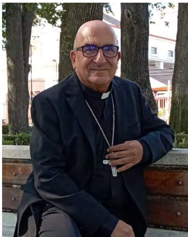
Cardenal Fernando Chomalí estuvo en Machalí para dar una charla

En entrevista con Rumbos, el arzobispo de Santiago abordó los desafíos que enfrentan los hogares, llamó a fortalecer la vida comunitaria y destacó el papel de la Iglesia en el acompañamiento de las familias.