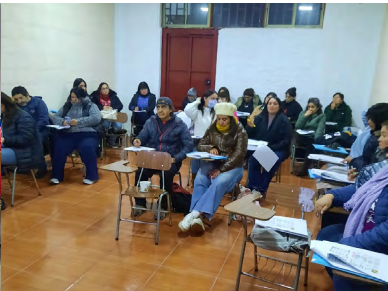
Uno de los aspectos que se aborda es el bienestar del cuidador.

como el duelo o el deterioro progresivo de un ser querido”, señala.