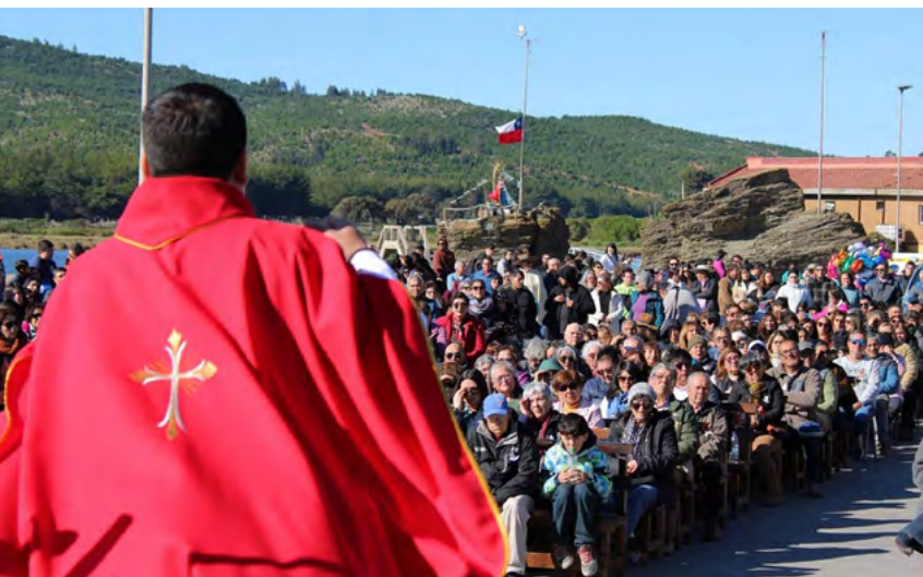
Gran cantidad de gente se congregó en la caleta de Bucalemu.