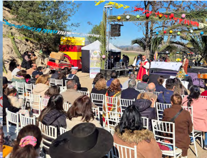
En Rapel, la comunidad se reunió para participar de una eucaristía.