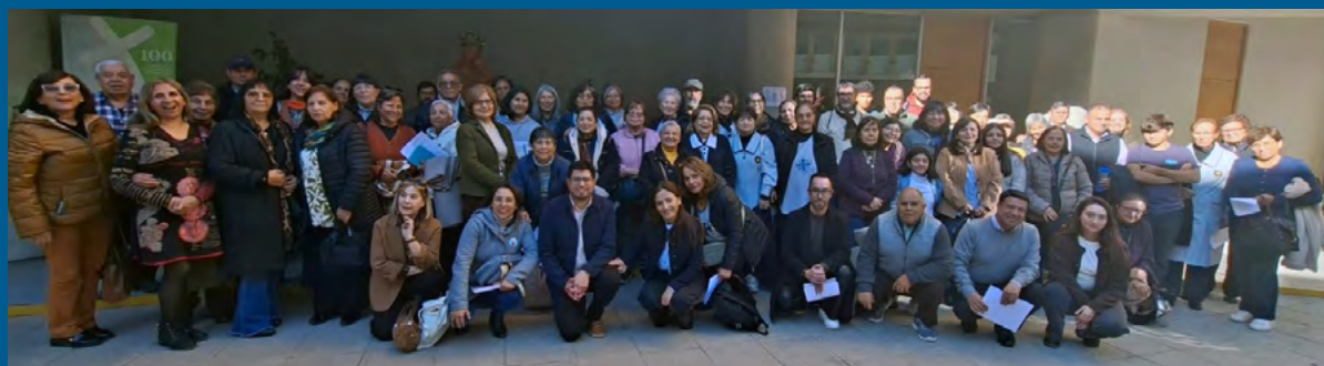
Participantes de la jornada de formación en Rancagua.

Un programa similar se ejecutó el 27 de junio, entre las 9:30 y las 13:30 horas, en la parroquia San Juan Evangelista de San Vicente de Tagua Tagua, contando con la participación de personas que prestan algún servicio pastoral en el Decanato de Santo Apóstoles.