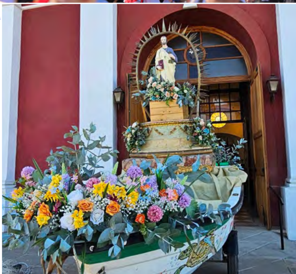
San Pedro, en un bote adornado, salió en procesión desde Paredones.