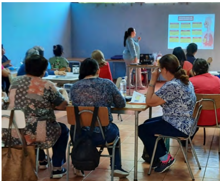
El curso cuenta con un equipo profesional que entrega la capacitación.