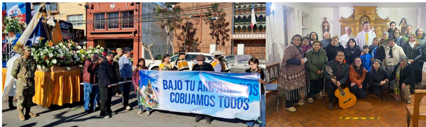
La devoción a la Virgen del Carmen es palpable en la parroquia.