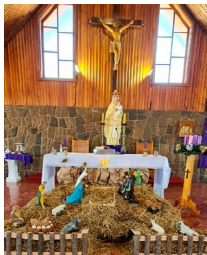
Parroquia Nuestra Señora de La Merced de Coltauco.