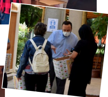
En la parroquia de Pichidegua se distribuyeron 200 cajas para ser entregadas durante el 23 y 24 de diciembre.