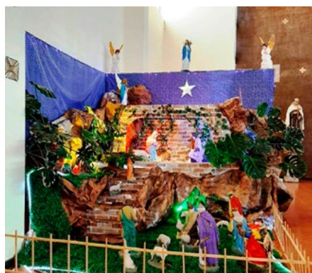
Parroquia Nuestra Señora del Carmen de San Fernando.