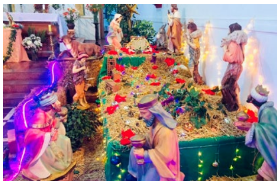
Parroquia Asunción de María de Quinta de Tilcoco.