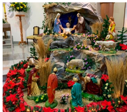
Parroquia Nuestra Señora del Carmen de Rancagua.