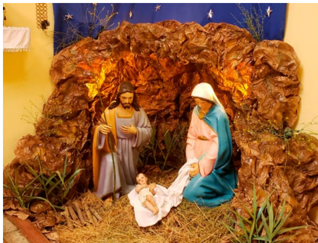
Parroquia Santa Clara, de Rancagua.