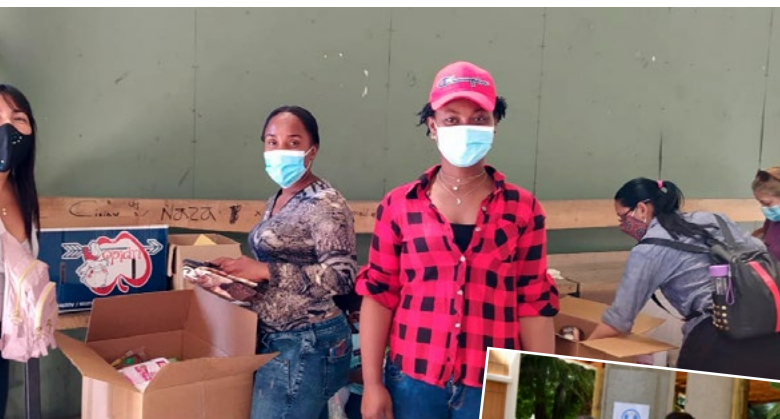
Que todos tengan una Navidad digna era el eje de la campaña.