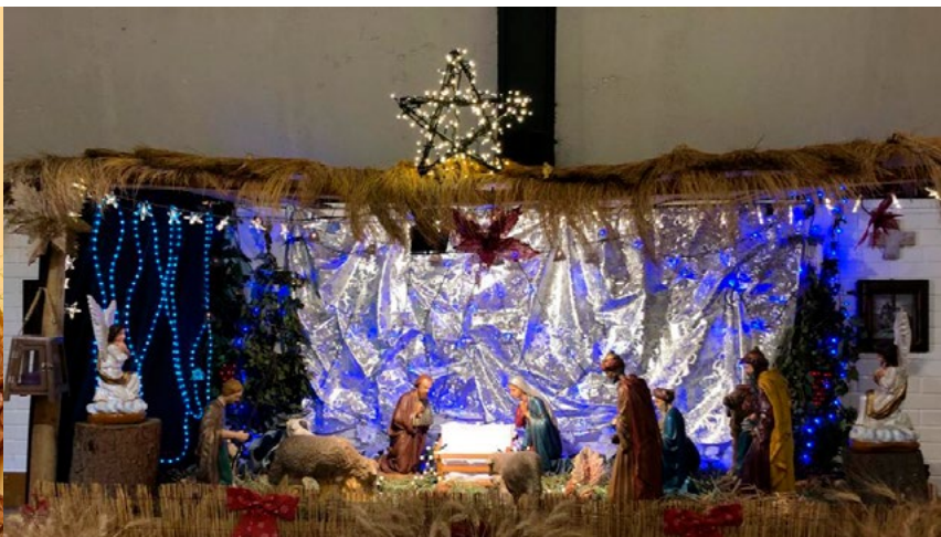
Parroquia Monte Carmelo de Rancagua.