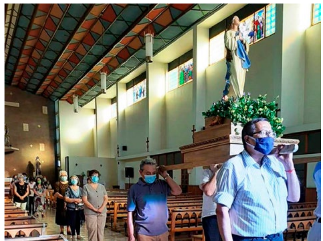
La parroquia Nuestra Señora del Carmen de San Fernando celebró -el 7 de diciembre- con el rezo del Santo Rosario para concluir el Mes de María y la Eucaristía, para posteriormente realizar una procesión dentro del templo.

La Región de O'Higgins cuenta con dos santuarios en su honor, no obstante, todas las parroquias la homenajean.