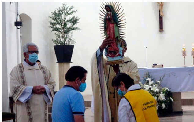
La parroquia San Francisco de Asís de Rancagua, celebró el 8 de diciembre, reabriendo sus puertas y homenajeando a la Virgen de la leche.