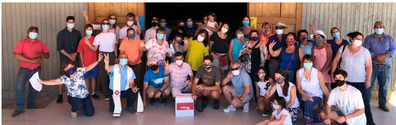
La parroquia Sagrada Familia distribuyó cajas de Navidad en todas sus comunidades.