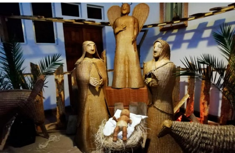
Parroquia La Merced de Chimbarongo.