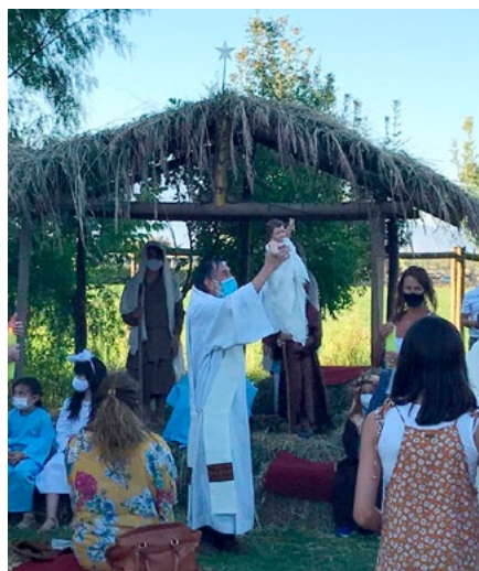
Parroquia Sagrada Familia, Machalí.