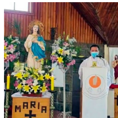
La parroquia Nuestra Señora de La Merced, de Coltauco celebró con el grupo de liturgia de forma presencial, para prevenir los contagios y apoyar la transmisión vía facebook.