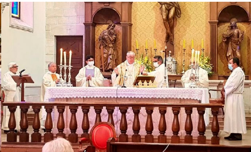
A partir del próximo año, trabajará junto al padre Angel (también Idente) en las parroquias San Agustín de Hipona y de la parroquia Santo Cura de Ars.

El pasado 12 de diciembre, él fue ordenado sacerdote.