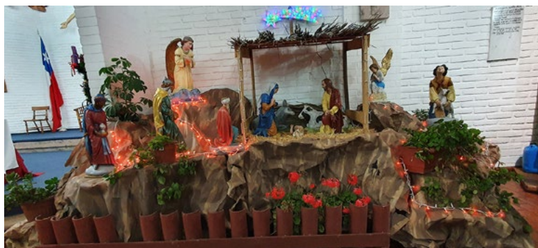
Parroquia Santa Rita de Casia, de San Fernando.