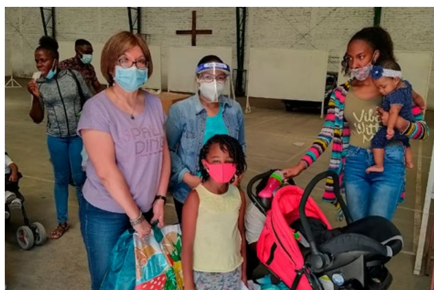
La Pastoral de Migrantes diocesana también realizó entrega de cajas de Navidad.