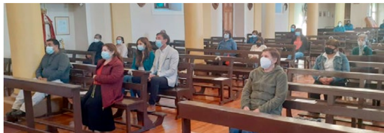
En la parroquia San Francisco de Placilla, también se celebró el Rosario del Alba.