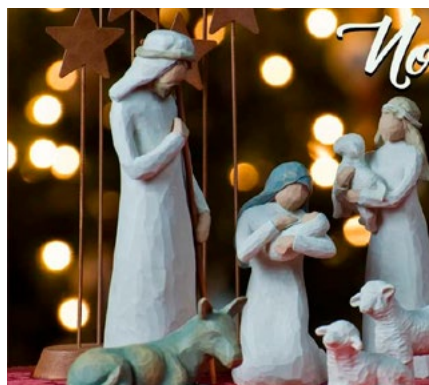
Parroquia Asunción de María de Lo Miranda.