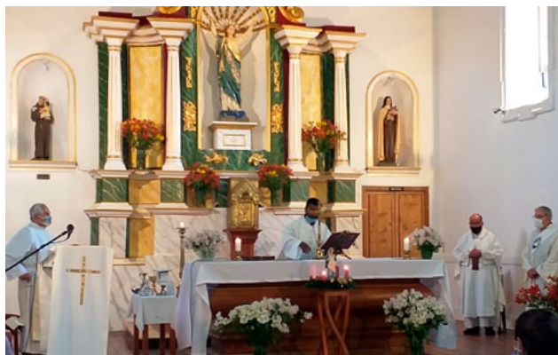
Celebración de Inmaculada Concepción en la parroquia Nuestra Señora de la Asunción de Quinta de Tilcoco.