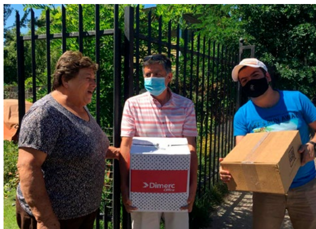
Hasta los sectores más alejados llegaron los agentes pastorales para entregar las cajas de Navidad.

Algo similar ocurrió en la Parroquia Sagrado Corazón de Las Cabras que llegó a decenas de familias. También la Pastoral de Migrantes en cada una de las parroquias realizó un esfuerzo por entregar este obsequio para una Navidad digna.