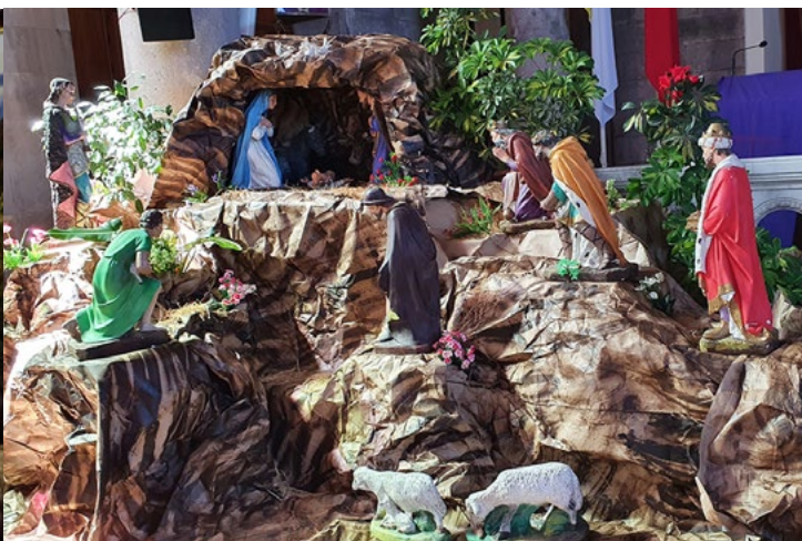
Parroquia San Agustín, de San Fernando.