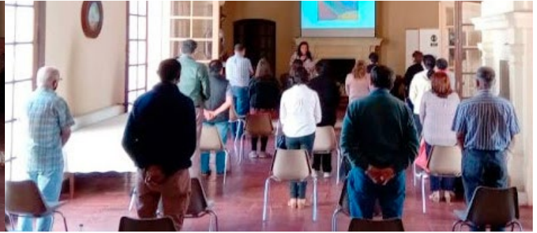
La jornada concluyó con una Eucaristía.