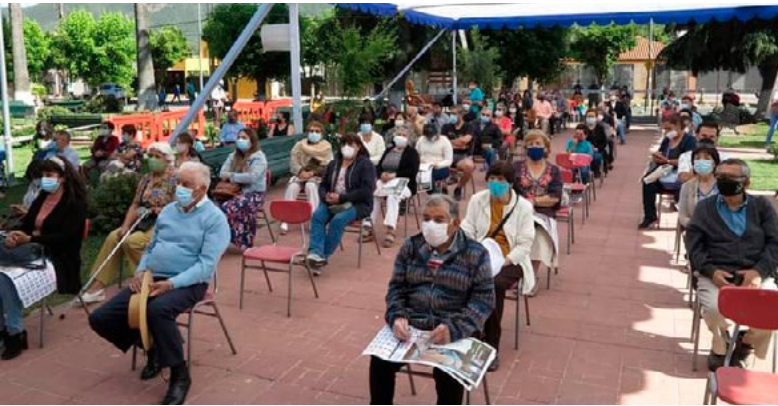
En la capilla de Puquillay Bajo se autorizó la celebración de la Eucaristía de forma presencial con aforo restringido.

Este año, aunque de forma diferente y respetando las medidas sanitarias, muchas de estas demostraciones de cariño fueron de forma virtual. A continuación les presentamos un breve recorrido de esta devoción por nuestra Diócesis.