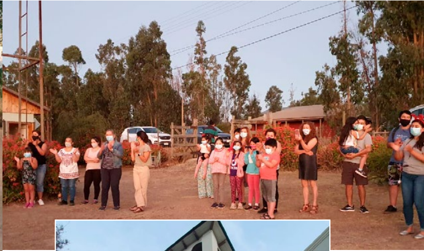
Cumpliendo todas las medidas sanitarias, la parroquia está celebrando algunas acciones pastorales.