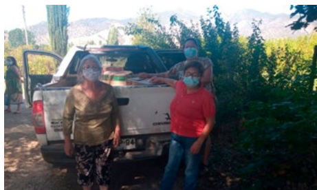
La parroquia Sagrado Corazón de Las Cabras salió a distribuir las cajas de Navidad a las diferentes comunidades.