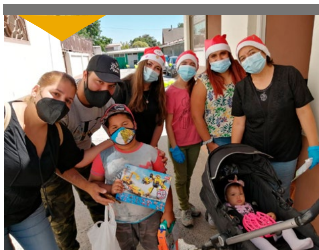
Cerca de 200 niños pudieron participar en la Navidad de los Príncipes.