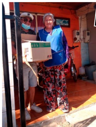
Para algunos era difícil movilizarse hasta la parroquia, por ello los agentes pastorales no dudaron en ser ellos quienes se trasladaran.