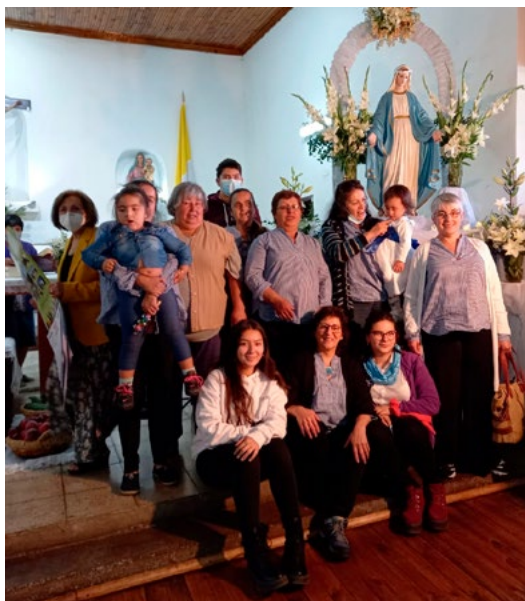
La parroquia San Nicodemo de Coínco celebró de forma presencial, respetando los aforos.