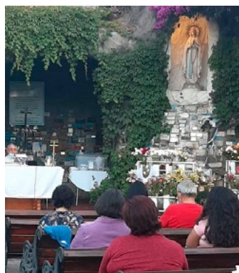
Parroquia Cristo Rey, celebró la Inmaculada Concepción, venerando la Virgen de Lourdes en su Santuario.