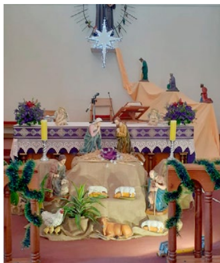
Parroquia San Francisco de Asís, de Placilla.

representando el nacimiento del Niño Dios, de algunas de las parroquias de nuestra diócesis, que con tanto cariño fue confeccionado por agentes pastorales y sacerdotes, invitando a sus comunidades a vivir esta Navidad en familia.