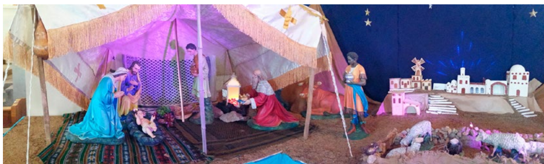
Parroquia San Antonio de Padua, de Chépica.